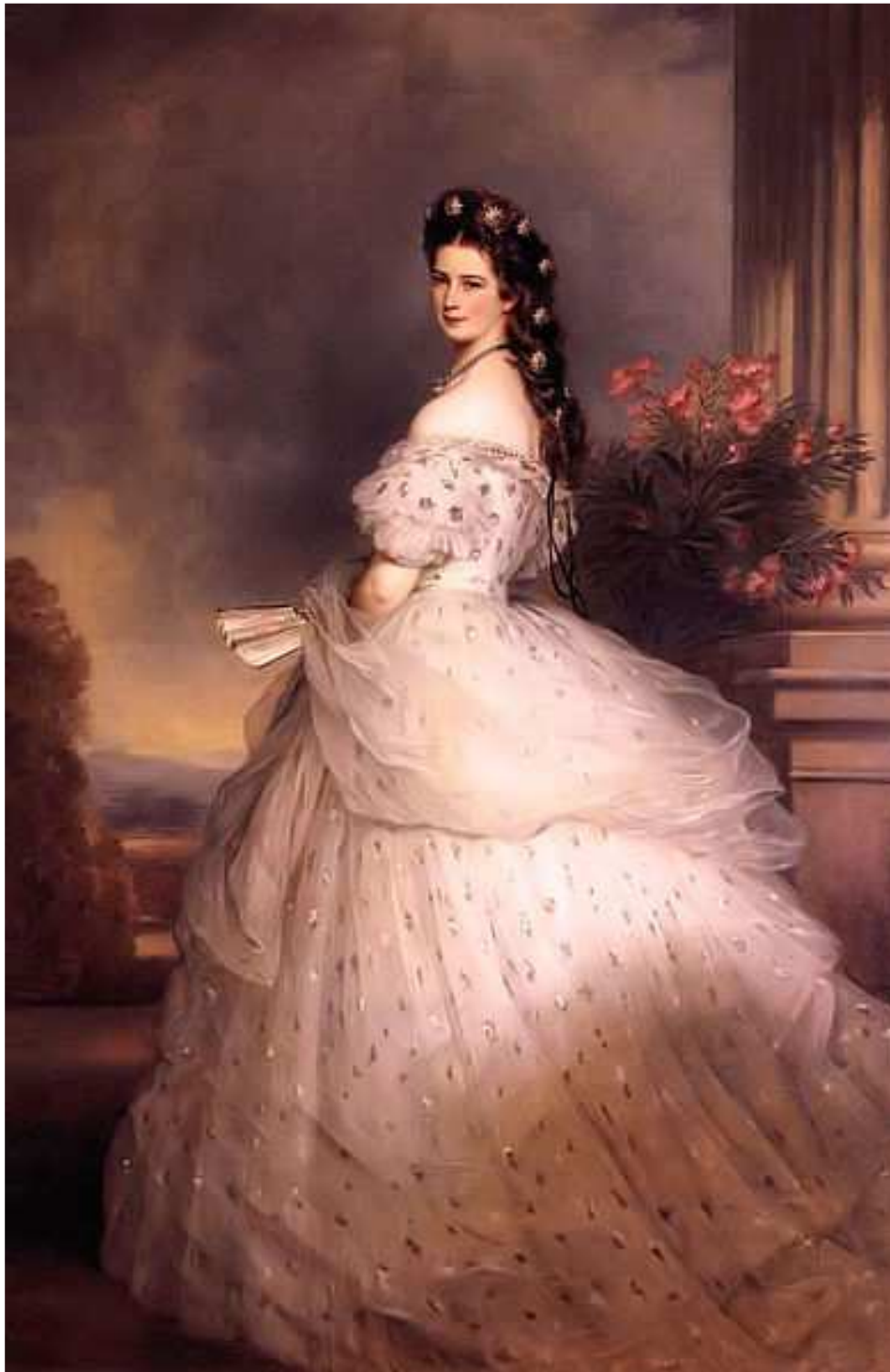
Bild N.1: Kaiserin Elisabeth von Österreich. In diesem Porträt von Franz Xaver Winterhalter trägt die Kaiserin in ihrem Haar die sogenannten Edelweiss-Sterne vom Hofjuwelier 65