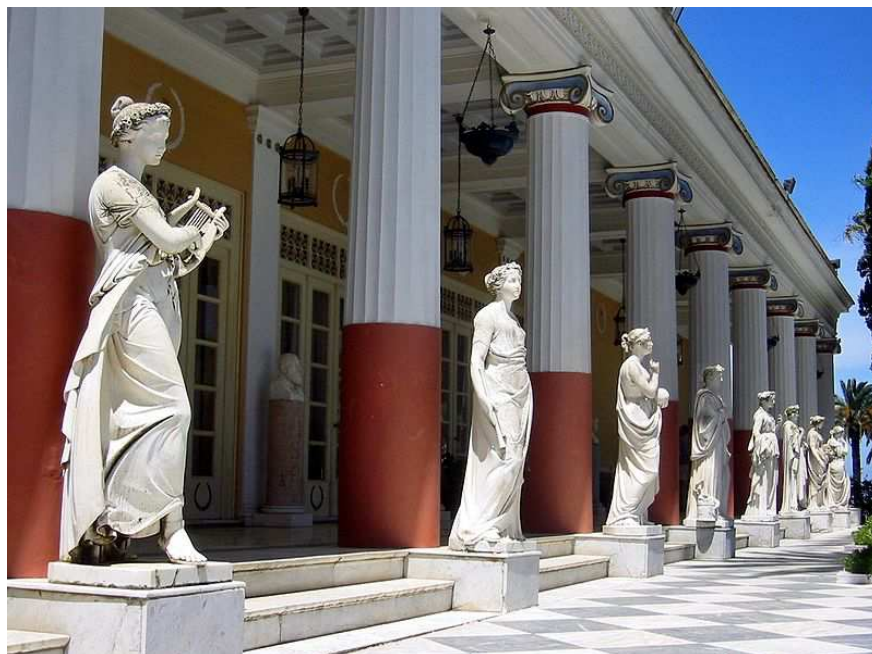
Bild N.12: Musen der griechischen Mythologie auf der Terrasse des Achilleion 75