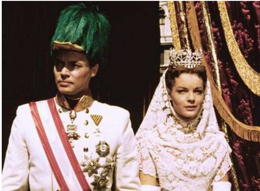
Bild N.8: Karlheinz Böhm als Franz Joseph I. und Romy Schneider als Kaiserin Sisi 72