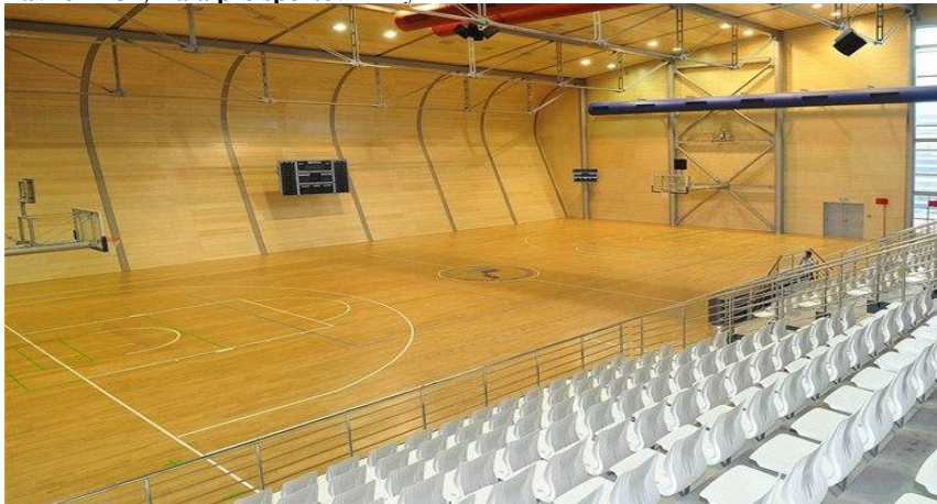
Pavilon A34, Hala pro sportovní hry