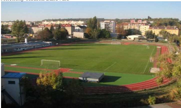
Atletický stadion SLAVIA