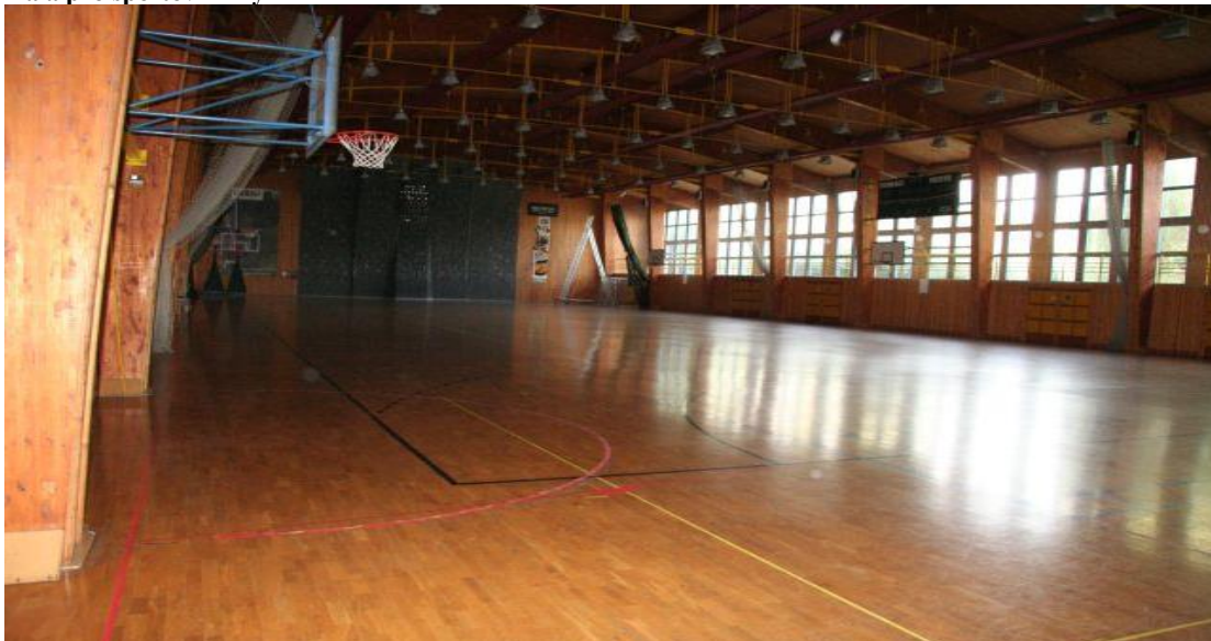
Hala pro sportovní hry