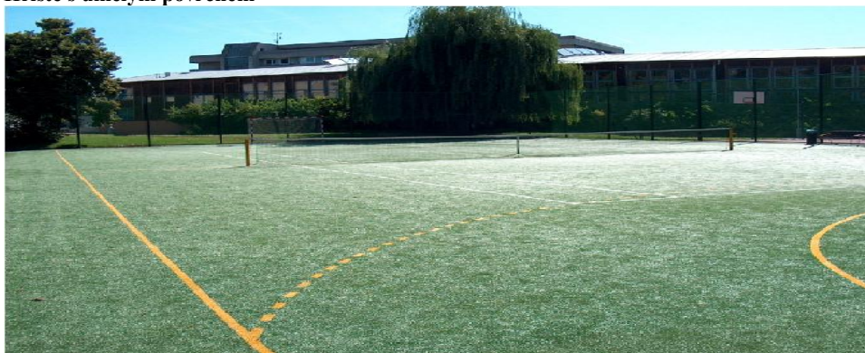
Hřiště s umělým povrchem