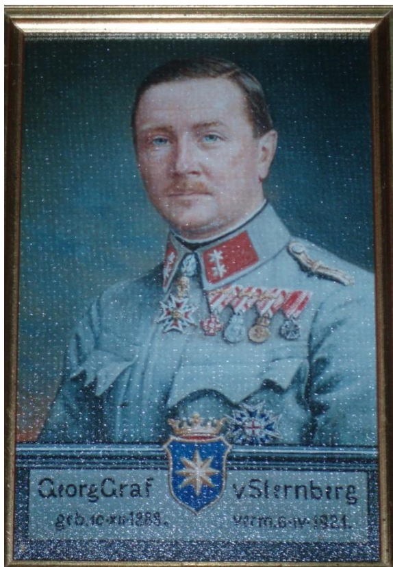
Jiří D. Sternberg v uniformě důstojníka rakousko-uherské armády, poč. 20. století. (Portrét umístěn v expozici hradu Český Šternberk).