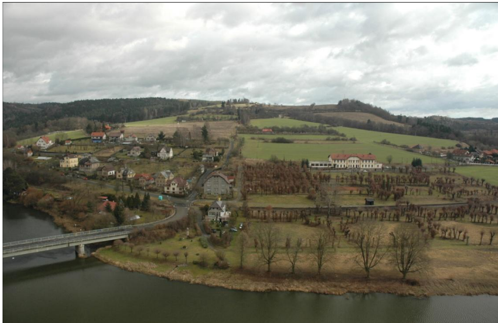
Pohled z hradu Český Šternberk na Parkohtel a zbytky původní francouzského parku z 18. století. Park protíná železnice, malá černá budova představuje původní železniční zastávku.