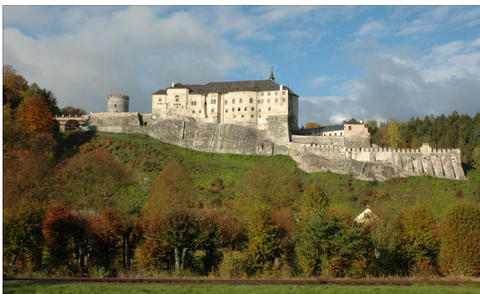
Hrad Český Šternberk (současnost).