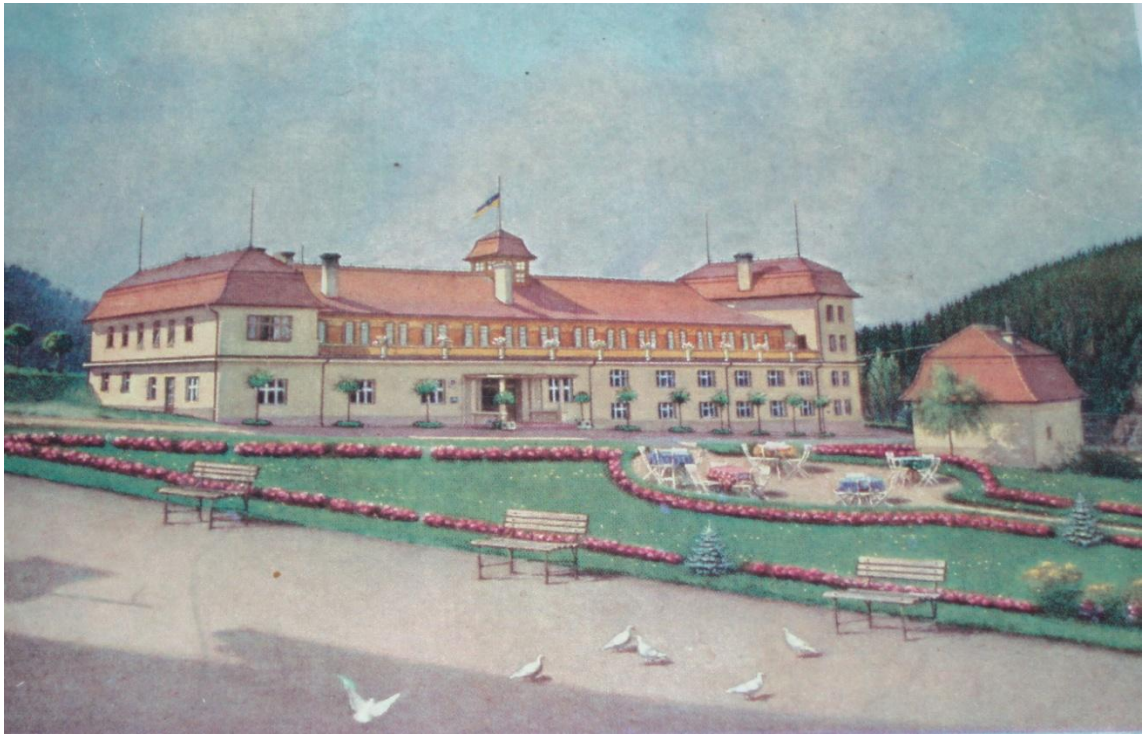
Pension Čejkovice ve 30. letech 20. století. (Obrázek umístěn v kanceláři hradu Český Šternberk).