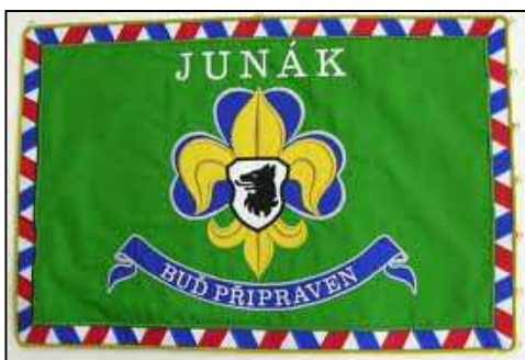
5 Junácká vlajka

Vlajka Junáka má rozměr 150 x 100 cm. Na zeleném podkladě nese znak Junáka, nad ním nápis JUNÁK a pod ním stuhu s nápisem SVAZ SKAUTŮ A SKAUTEK ČESKÉ REPUBLIKY na rubu a BUĎ PŘIPRAVEN na líci.