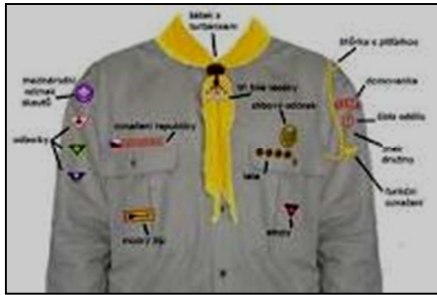
6. Skautský kroj

Na tomto obrázku, je znázorněno umístění všech insignií tak, jak je popsáno výše. Ostatní oděvní součástky, nemají žádnou specifickou náročnost, snad pouze barevnou jednotnost. Měli by ladit s košilí a s přírodou. Vhodná barva je příkladně khaki, nebo zelená, či hnědá