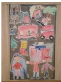
Obrázek 78 Hasiči

1. Koláž, kolektivní práce – malba vodou roztíratelnými pastelkami, detaily dokreslené tuší, lepení na karton vystřížených, aut, hořících objektů, osob... (Obrázek 78)