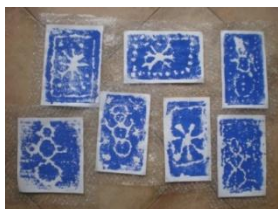
Obrázek 39 Zimní motivy

Tisk z výšky, modrá temperová barva, vyřtí motivu do polystyrénových desek, podlepení bublinovou fólií. (Obrázek 39)