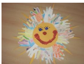
Obrázek 72 Letní slunce

Koláž z obkreslených a vystříhaných rukou, paprsky ze žlutého papíru a vystříhaných dlaní, obličej malovat prstovými barvami. (Obrázek 72)