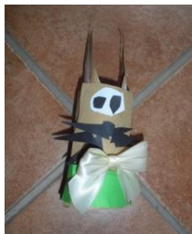
Obrázek 57 Zajíček

Z toaletní ruličky – držák velikonočních kraslic, polepování barevným papírem, lepení a stříhání podle fantazie. (Obrázek 57)