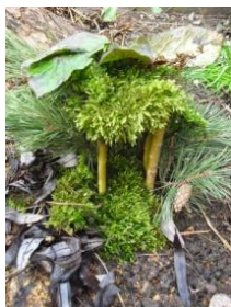
Obrázek 4 Domeček skřítků Podzimníčků

1. V přírodě při pobytu venku děti skládají domečky z přírodních materiálů: listů, mechu, dřívěk, kamínků, šišek, různých druhů trav a plodů. (Obrázek 4)