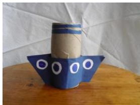
Obrázek 80 Auta a dopravní prostředky

Auta nebo lodě z papírových krabiček, polepování barevnými papíry, kola z tvrdé papírové lepenky; lodě z toaletních ruliček. (Obrázek 80)