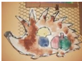
Obrázek 15 Ježek

Zapouštění vodových barev do vlhkého podkladu, dokreslení tuší, vystříhnutí. (Obrázek15)