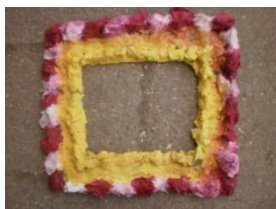
Obrázek 82 a 83 Kaširované rámečky