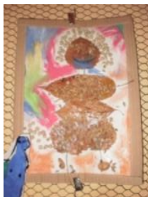
Obrázek 1 a 2 Skřítki Podzimníčci

2. Malba suchým pastelem, vystřihování a nalepení karton s vylisovanými listy. (Obrázek 3)