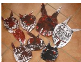
Obrázek 25 Mikuláš, čert a anděl

5. Obličej čerta – nalepení kousků papíru na podklad, přetření tmavou temperovou barvou. (Obrázek 25)