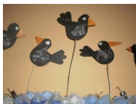
Obrázek 35 a 36 Vrány