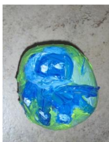
Obrázek 76 Ryby

3. Malba temperovými barvami na různě velké kameny, fixace barvy bezbarvým lakem. (Obrázek 76)