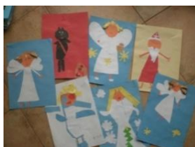
Obrázek 21 Mikuláš, čert a anděl

1. Koláž z barevných papírů – stříhání, lepení na barevný podklad, dokreslení tuší. (Obrázek 21)