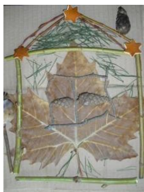
Obrázek 5 Domečky skřítků Podzimníčků

2. Ve třídě: lepení přírodních materiálů na lepenku. (Obrázek 5)