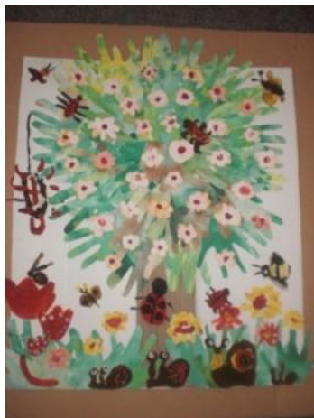
Obrázek 66 Jarní strom

Koláž z obkreslených a vystříhaných rukou; kmen z vlnité lepenky; květiny, šneci, brouci namalovaní na karton temperovými barvami a vystříhaní. (Obrázek 66)