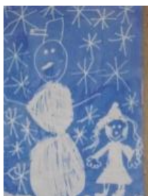
Obrázek 41 Sněhuláci

2. Kresba zmizíkem na papír natřený inkoustem. (Obrázek 41)