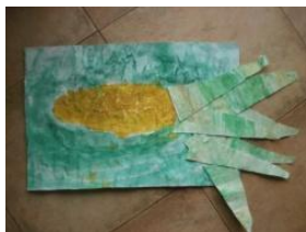
Obrázek 13 Kukuřice

Malba temperovými nebo vodovými barvami, listy vytvoříme muchláží z nabarveného papíru, lepení šupolí. (Obrázek 13)