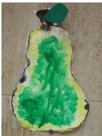
Obrázek 11 Zelenina a ovoce

2. Zapouštění barev do klovatiny ve tvaru jablka, hrušky nebo jiných podzimních plodů, vystřihání, nalepení na list z barevného papíru nebo vlnité lepenky. (Obrázek 11)