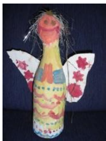
Obrázek 24 Mikuláš, čert a anděl

4. Kašírování na skleněnou láhev, po zaschnutí natření latexem a temperovými barvami, vlasy z různých materiálů (lýko, seno, sláma, přírodní provaz). (Obrázek 24)