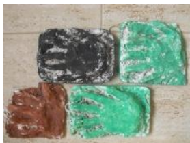
Obrázek 67 Otisky ze sádry

1. Vtisknutí ruky do hlíny, odlití otisků, po zaschnutí sádry malba temperovými barvami. (Obrázek 67)