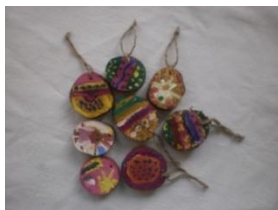
Obrázek 61 Vajíčka a slepička

2. Malba temperovými barvami na dřevěné špalíčky – jarní motivy. (Obrázek 61)