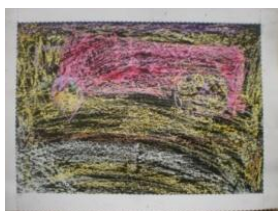
Obrázek 79 Hasiči

2. Malba hasičských aut voskovými barvami, přetření tuší a vyškrabání kovovým předmětem. (Obrázek 79)