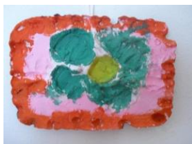
Obrázek 68 Otisky ze sádry

2. Ryty do ještě nezaschlé sádry dřívkem nebo špejlí, malba temperovými barvami, zavěšení na přírodní provázek. (Obrázek 68)