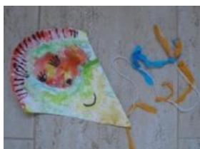
Obrázek 7 Drak

2. Zapouštění vodových barev do klovatiny, vystříhnutí a dolepení vlasů a ohonu z barevných papírů. (Obrázek 7)