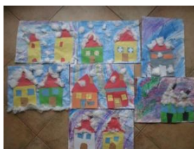
Obrázek 32 a 33 Zimní domky

2. Koláž z barevných látek na karton, zavěšení na lýko. (Obrázek 34)