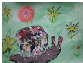
Obrázek 70 a 71 Šneci