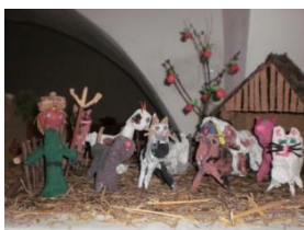
Obrázek 28 Betlém

1. Stavba betléma z lepenkové krabice a dřívěk, kůry, sena a slámy. Podkladem pro betlém byla dřevěná překližka. Zvířátka: tělo – rulička od toaletního papíru, kašírování (staré noviny, lepidlo na tapety); končetiny – špejle, kašírování; detaily ze zbytků barevného papíru. Postavy: tělo z cívek od nití, obličej kašírovaný (smačkaný papír do kuličky), malba temperovými barvami. (Obrázek 28)