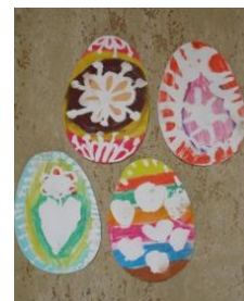
Obrázek 58, 59 a 60 Vajíčka a slepička

2. Malba temperovými barvami na dřevěné špalíčky – jarní motivy. (Obrázek 61)