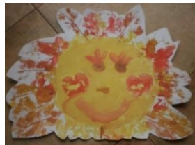
Obrázek 8 a 9 Podzimní sluníčko