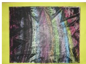
Obrázek 46 Zimní slunce

2. Malba voskovými pastely, přetření tuší a vyškrabávání kovovým předmětem. (Obrázek 46)