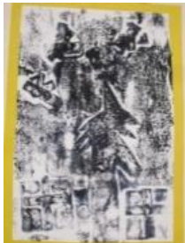
Obrázek 27 Vánoční přání

Lepení papíru s adventními motivy, tisk z výšky temperovými barvami, nalepení na lepenkový vlnitý karton. (Obrázek 27)