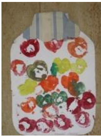
Obrázek 10 Zelenina a ovoce

1. Nádoba s ovocem: ovoce – tisk jednotlivých částí na plochu; nádoba – trhání barevného papíru, lepení na tvrdý karton nebo lepení sena, slámy do požadovaného tvaru. (Obrázek10)