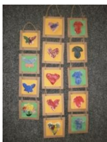
Obrázek 81 Letní motivy ze slaného těsta

Slané těsto, modelování nebo vykrajování tvarů. Rytí do tvarů, použití různých druhů koření (na oči, ozdobu), po upečení nebo úplném zatvrdnutí nabarvit temperovými barvami, nalepit na vlnitý karton, zavěsit do prostoru. (Obrázek 81)