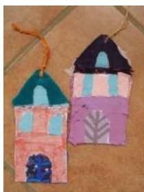
Obrázek 34 Zimní domky

2. Koláž z barevných látek na karton, zavěšení na lýko. (Obrázek 34)