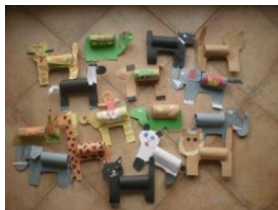
Obrázek 77 ZOO

Zvířata: plastické provedení, polepení toaletní ruličky barevnými papíry. (Obrázek 77)