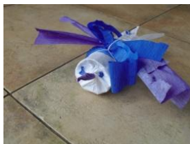
Obrázek 56 Závěsný ptáček

Tělo ptáčka je z ruličky od toaletního papíru, polepování krepovým papírem, stříhání, lepení, zavěšení nitěmi na dřívko. (Obrázek 56)