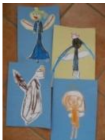
Obrázek 23 Mikuláš, čert a anděl

3. Malba suchými pastely, vystřihnutí a nalepení na barevný podklad. (Obrázek 23)