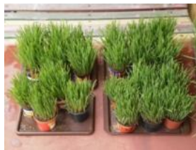
Obrázek 63 a 64 Květináče na osení