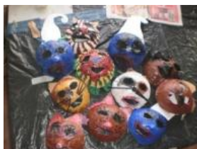
Obrázek 47 Masky

Kaširování na nafouklý balonek, vrstvení starého novinového papíru namočeného v lepidlu na tapety. Po zaschnutí malba temperovými barvami, detaily – nalepení barevných papírů. (Obrázek 47)