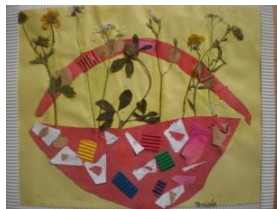
Obrázek 53 a 54 Jarní košíček

Obor environmentální výchovy Ptáci a jejich zpěv, létání, hnízdění