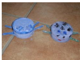
Obrázek 69 Berušky a broučci