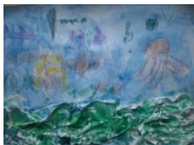
Obrázek 73 Moře

Muchláž na tvrdý karton (útesy), dokreslení voskovými pastely, tuší a vodovými barvami, lepení mušlí, písku. (Obrázek 73)