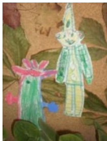
Obrázek 3 Skřítki Podzimníčci

2. Malba suchým pastelem, vystřihování a nalepení karton s vylisovanými listy. (Obrázek 3)