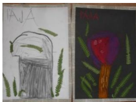
Obrázek 18 a 19 Houby