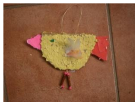
Obrázek 55 Ptáci

Polepování lepenkového kartonu kousky natrhaného barevného papíru, nohy z lýka a dřevěných korálek, křídla z peříček. (Obrázek 55)