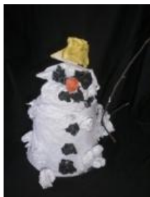
Obrázek 40 Sněhuláci

1. Lepení papíru na plastové kelímky, hlava z papírové koule, doplnění barevnými papíry a dřívkem (koště). (Obrázek 40)