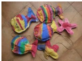
Obrázek 74 Ryby

1. Prostorová práce, nakreslení dvou shodných ryb nebo jiných živočichů na velký měkký papír, po vystřihnutí slepit k sobě, jedním nepřilepeným otvorem vycpat vnitřek starými novinami, potom slepit zbylé neslepené části k sobě. Malba temperovými barvami, zavěsit na přírodní provázek. (Obrázek 74)