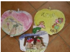
Obrázek 12 Zelenina a ovoce

3. Malba vodovými barvami a kresba tuší do tvaru jablka, vystřihnutí. (Obrázek 12)