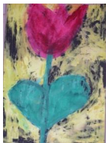
Obrázek 50 a 51 Jarní květiny

3. Rozfoukávání vodových barev plastovou trubičkou do tvaru květiny. (Obrázek 52)