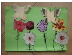
Obrázek 48 a 49 Jarní květiny

2. Malba temperovými barvami, po zaschnutí přetřít tuší a potom vymýt pod slabým proudem vody. (Obrázek 50 a 51)