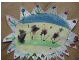
Obrázek 65 Jarní slunce

Malba na tvrdý karton vodovými barvami, vystřižené a tuší dokreslené jarní motivy. (Obrázek 65)