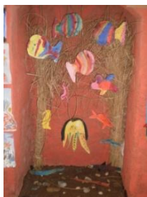
Obrázek 75 Ryby

2. Malba ryb a živočichů suchým pastelem nebo křídou, vystřihnout, zavěsit. (Obrázek 75)