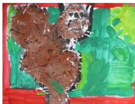
Obrázek 16 a 17 Veverka Zrzčka