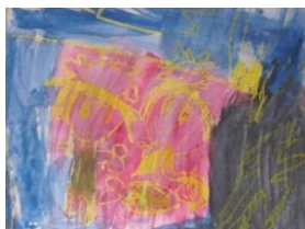
Obrázek 29 a 30 Betlém