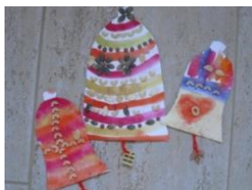
Obrázek 26 Vánoční zvonky

Malba vodovými barvami na tvrdý karton, vystřihnoutí do tvaru zvonku, po zaschnutí lepení různých druhů potravin (čočka, rýže, krupice, fazole apod.), sušené tvarované kůry z pomeranče. (Obrázek 26)