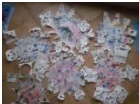
Obrázek 44 a 45 Zimní slunce

2. Malba voskovými pastely, přetření tuší a vyškrabávání kovovým předmětem. (Obrázek 46)