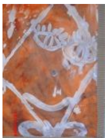
Obrázek 6 Drak

1. Kresba klovatinou, po zaschnutí zatření olejové barvy. (Obrázek 6)