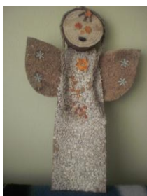
Obrázek 22 Mikuláš, čert a anděl

2. Tvar postavy anděla je z tvrdého lepenkového kartonu, stříhání, lepení přírodních materiálů a různých druhů potravin (čočka, rýže, krupice, fazole apod.), sušené tvarované kůry z pomeranče, sena, slámy; hlavička je z dřevěného špalíku; vlasy z lýka nebo přírodního provazu. (Obrázek 22)