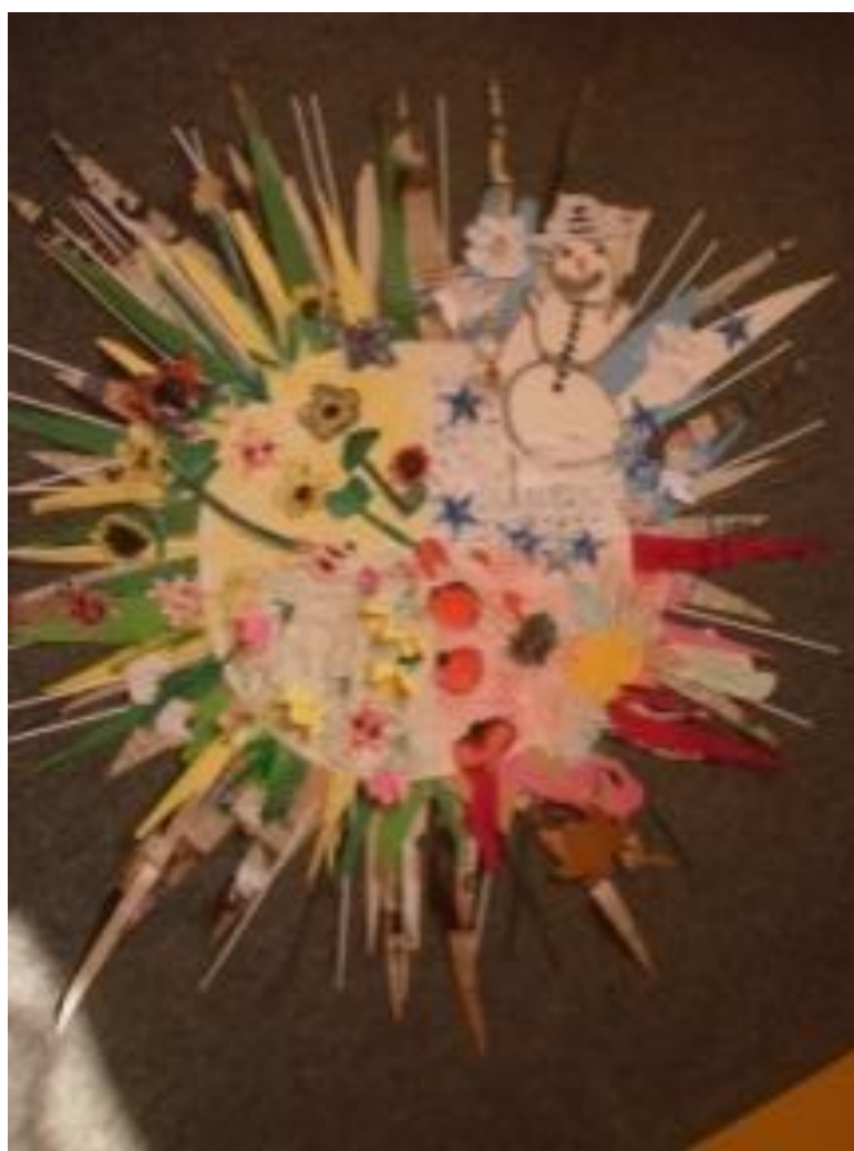
Obrátek 84 Slunce čtvero ročních období

Koláž – kolektivní práce: malba temperovou barvou různých symbolů ročních období, symboly složené z papíru – květy a hmyz, tisk zimních motivů, vystřihnutí, lepení na tvrdý podklad; paprsky z novin, starých tiskovin a zbytků krepového papíru. (Obrátek 84)