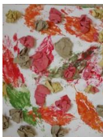
Obrázek 13 a 14 Podzimní strom