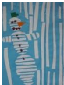
Obrázek 42 Sněhuláci

3. Lepení nastříhaných proužků bílého papíru na barevný podklad. (Obrázek 42)