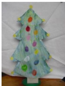
Obrázek 31 Vánoční stromek

Malba voskovými pastely, překrytí vodovými barvami. (Obrázek 31)