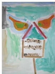
Obrázek 37 a 38 Ptáci na krmítku