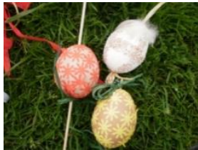
Obrázek 62 Kraslice z výdutků vajíček

Vyfouklé vajíčko – zdobené krupicí, lepením barevného papíru, zavěšení na větvíčku nebo na špejli – zápich. (Obrázek 62)