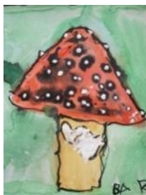
Obrázek 20 Houby