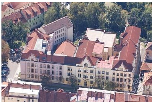
Obr. 6 Dámský spolek Ludmila – pohled shora