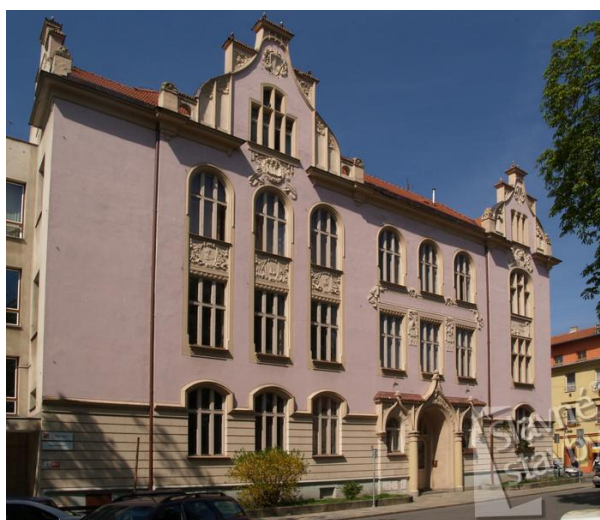
Obr. 7 Dámský spolek Ludmila – hlavní vchod