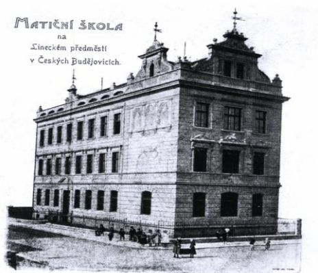
Obr. 3 Matiční škola na Lineckém předměstí v Českých Budějovicích 69

Matice školská byla jedním z prvních plodů dozrávající české společnosti ve městě. Všichni si byli vědomi, že své nejvlastnější poslání zakládat obecnou vzdělanost, může škola nejlépe vykonávat ve svobodném prostředí. Byla zřízena nikoliv úředním aktem státu, nýbrž ze svobodné vůle občanů samých, majících její potřebnost za veřejný zájem prvního řádu.