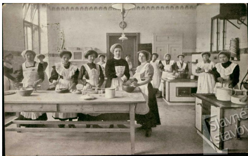
Obr. 8 Dámský spolek Ludmila – uvnitř spolku