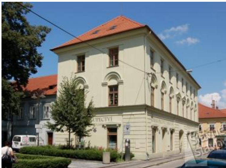
Obr. 2 objekt bývalé městské školy 56

Objekt bývalé městské školy tvoří součást samostatně stojícího bloku děkanství, od něhož je však oddělen funkčně i svým architektonickým výrazem. Celý děkanství areál je srostlicí budov, prozrazujících na první pohled složitější stavební vývoj: dnes má dvě protáhlá souběžná patrová křídla, která na východní straně propojuje právě školní budova s vlastním vchodem z Kněžské ulice. Nejstarší zmínka o škole pochází z roku 1373, další písemné zprávy jsou však dosti řídké a víceméně náhodné. Roku 1788 došlo k separaci žáků podle pohlaví, takže chlapci přešli do piaristické školy a v budově za děkanstvím zůstala městská dívčí škola. Budova v nynější klasicistní podobě vyrostla v květnu až říjnu 1831 podle plánů městského stavitele Josefa Bednaříka. Svým vnějším architektonickým výrazem se velmi podobala dnes již zaniklé veřejné nemocnici na Senovážném náměstí, která byla jen o dva roky starším Bednaříkovým dílem.