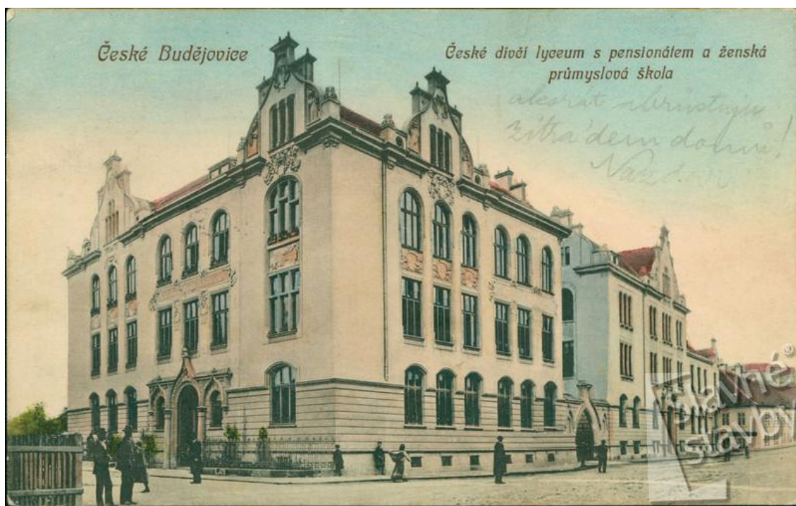
Obr. 5 České dívčí lyceum v Českých Budějovicích 75