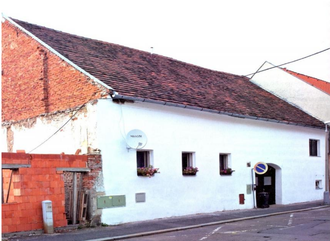
Obr. . 1