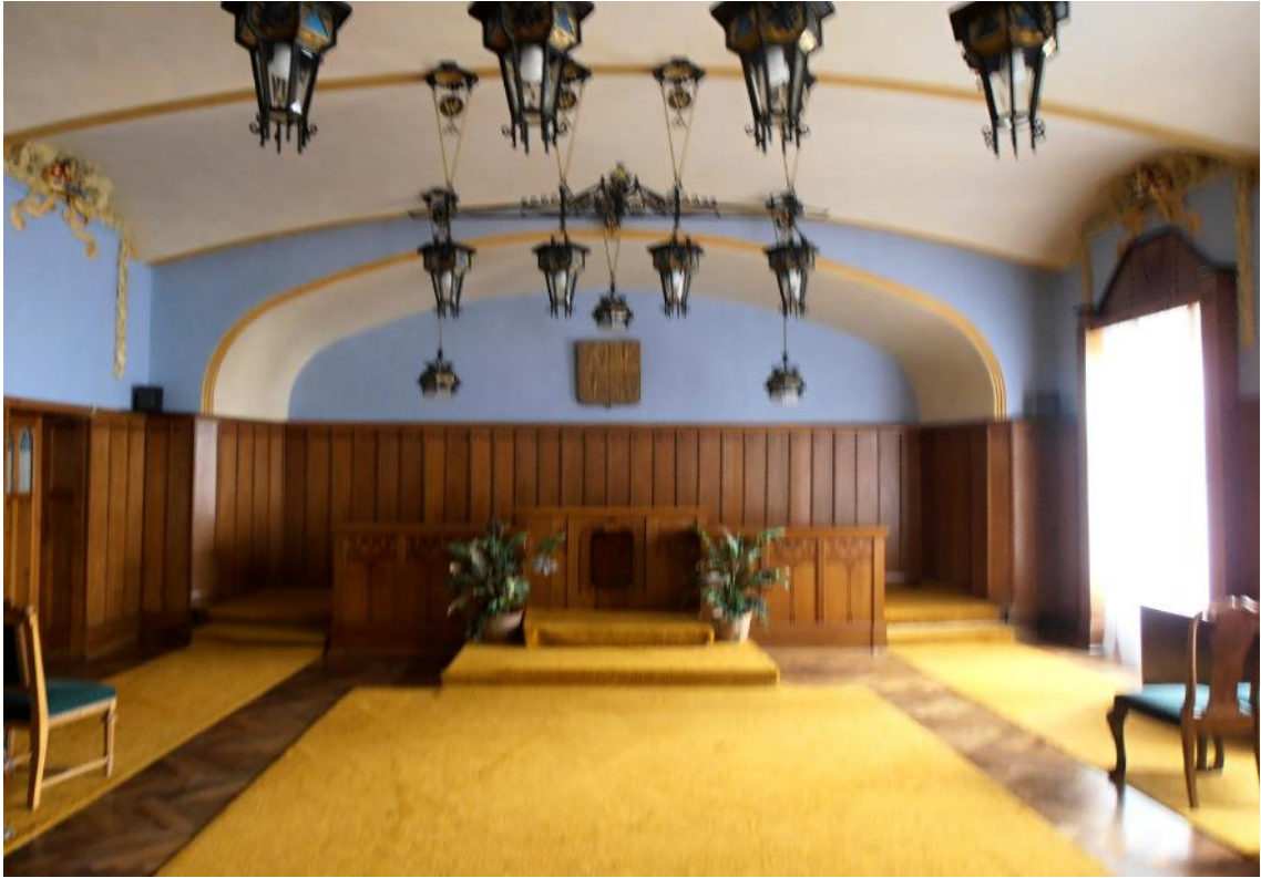
Obr. . 11