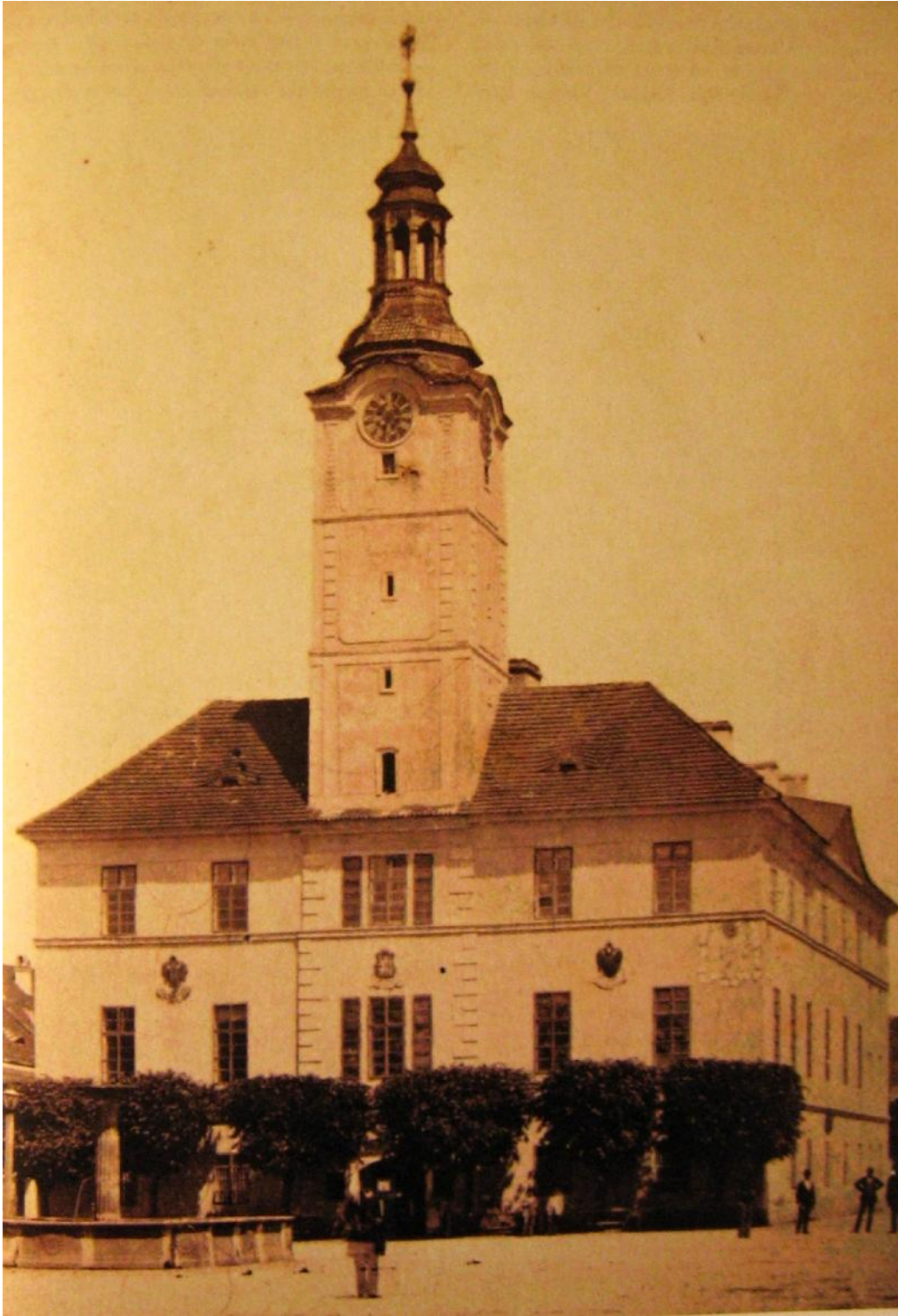
Obr. . 8