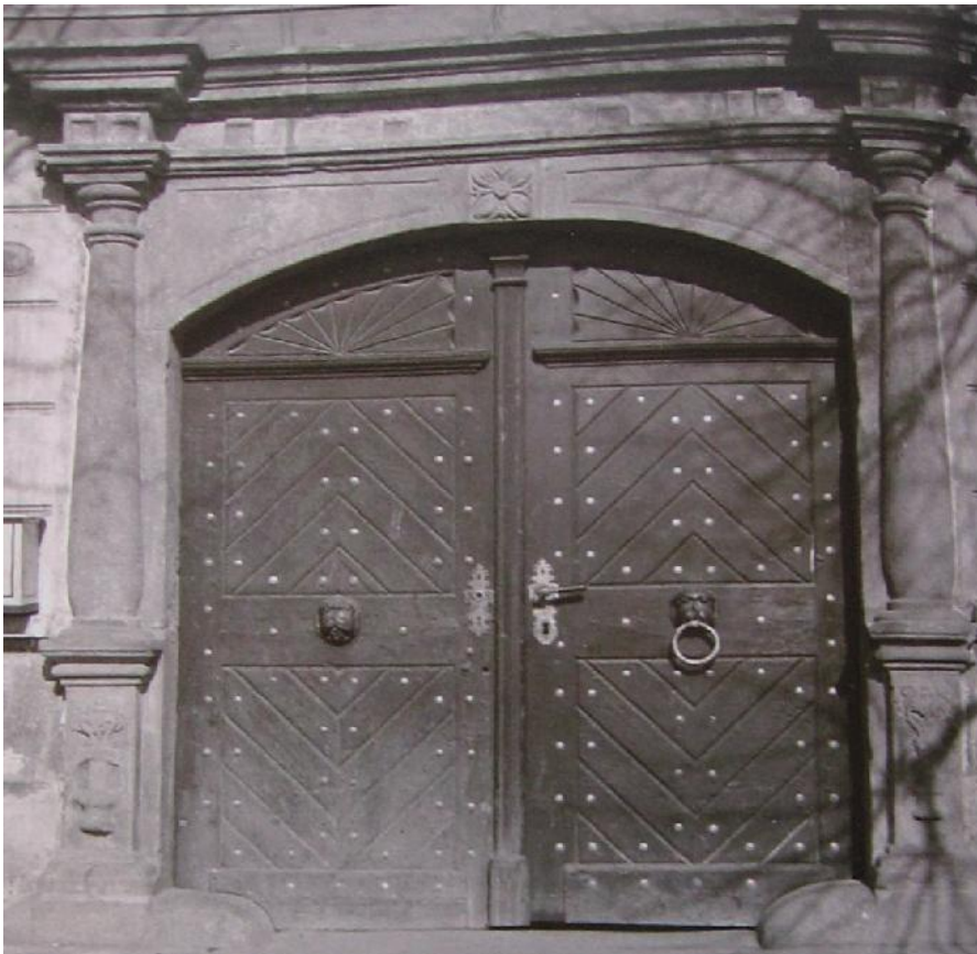
Obr. . 12