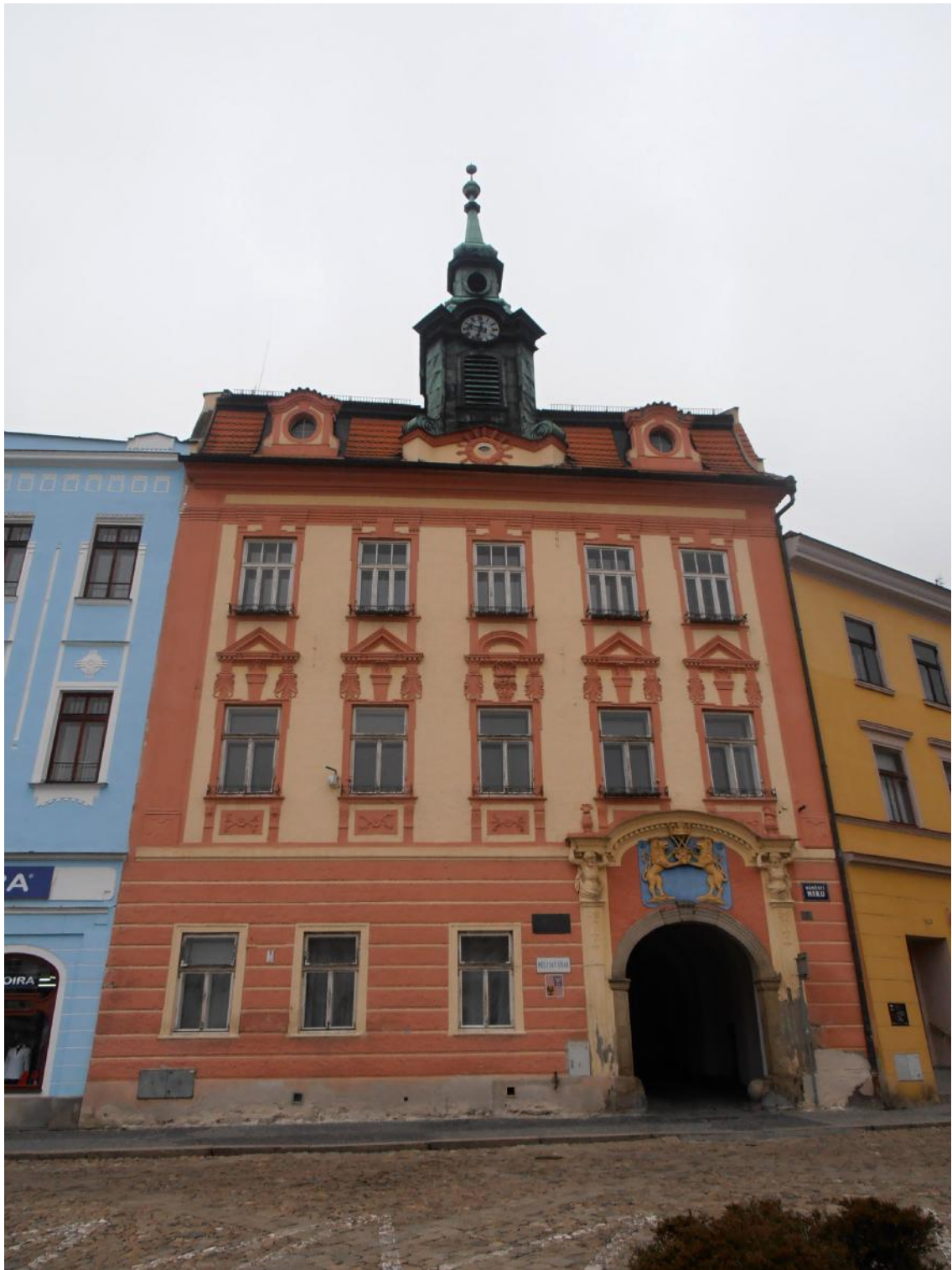
Obr. . 10