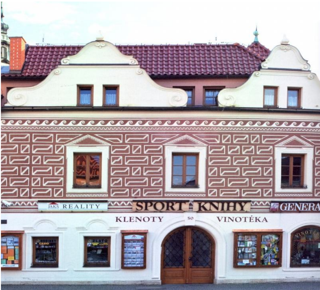
Obr. . 7