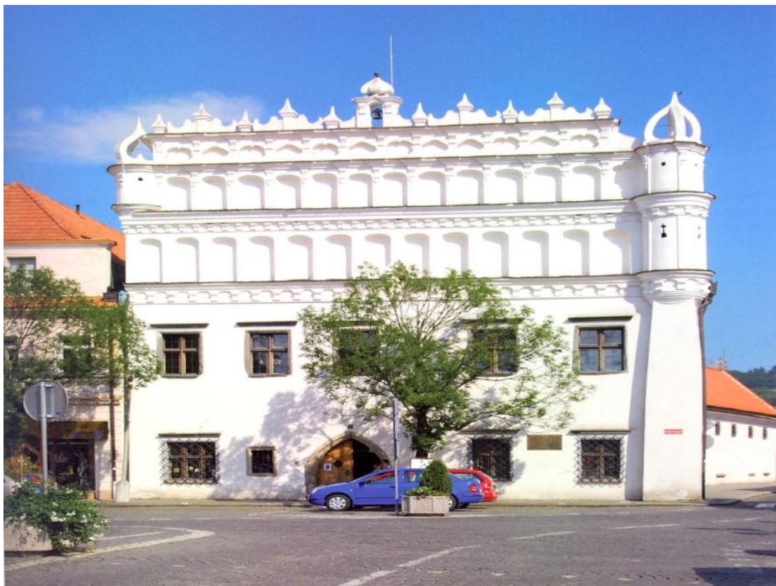
Obr. . 2