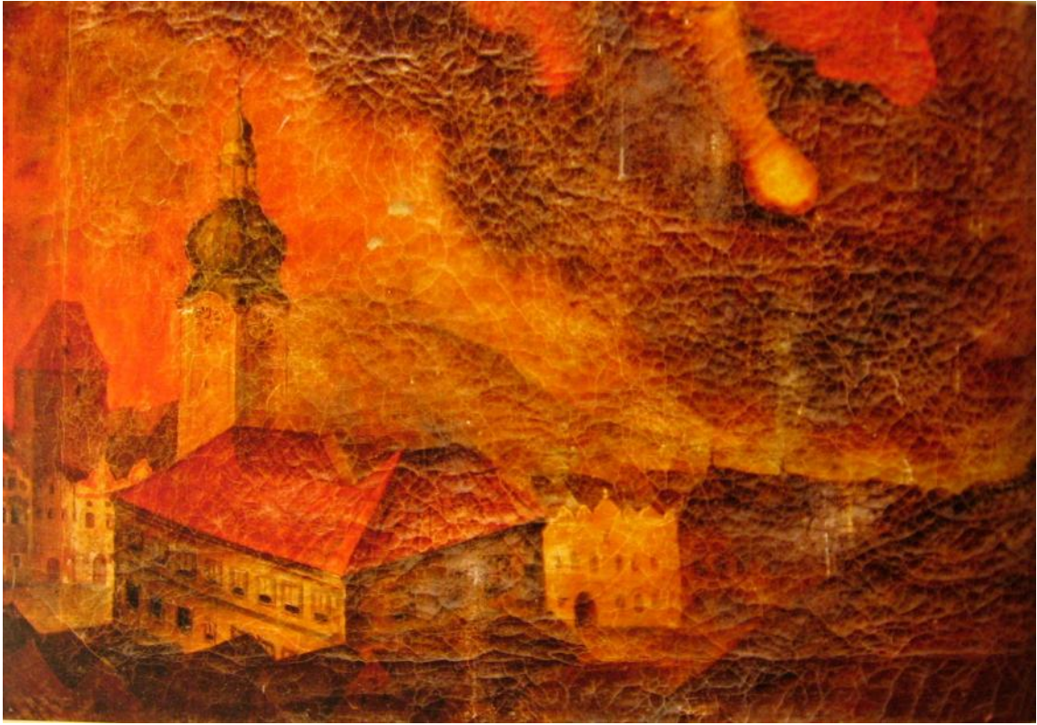
Obr. . 6