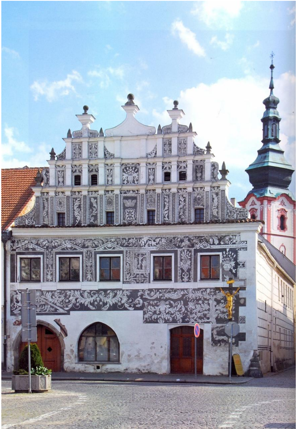
Obr. . 3