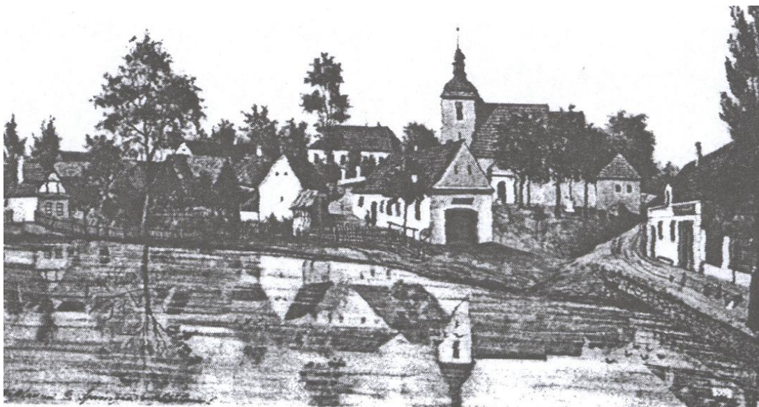
Chrášťany na začátku 20. století. Domek úplně vpravo patřil rodině Springerů.