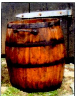
❁ Stará míra na obilí

(Bývaly to naturálie: vejce a koláče. Na kolik se odvádění koláčů r. 1842 výslovně připomíná při koledě o Michalu, může se z toho bezpečně říci, že tehdy bylo slaveno v Bělé posvícení (a ne až 3. neděli v říjnu). Jiného důvodu pro michalskou koláčovou koledu nebylo.)