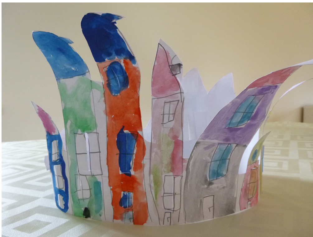
Obrázek č. 5 – Adventní městečko