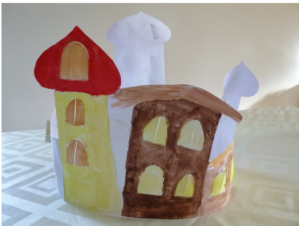
Obrázek č. 8 – Adventní městečko