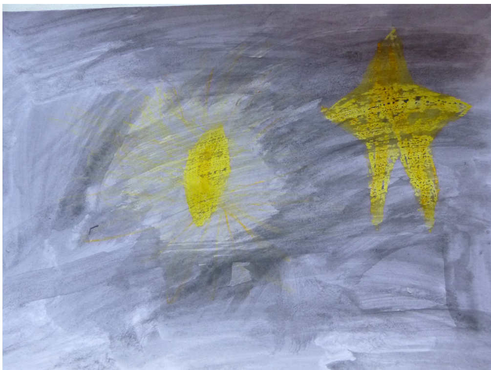
Obrázek č. 12 – Světlo ve tmě