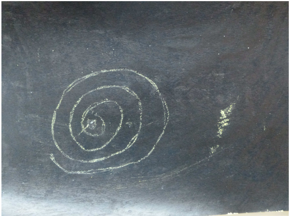
Obrázek č. 13 – Cesta