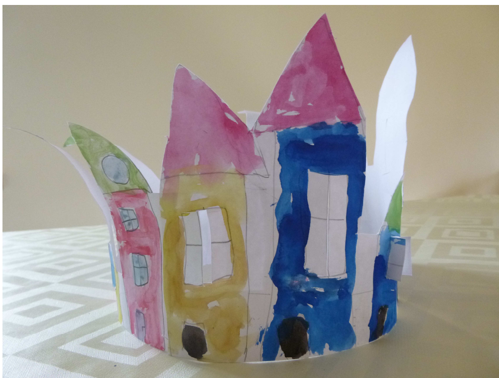
Obrázek č. 6 – Adventní městečko