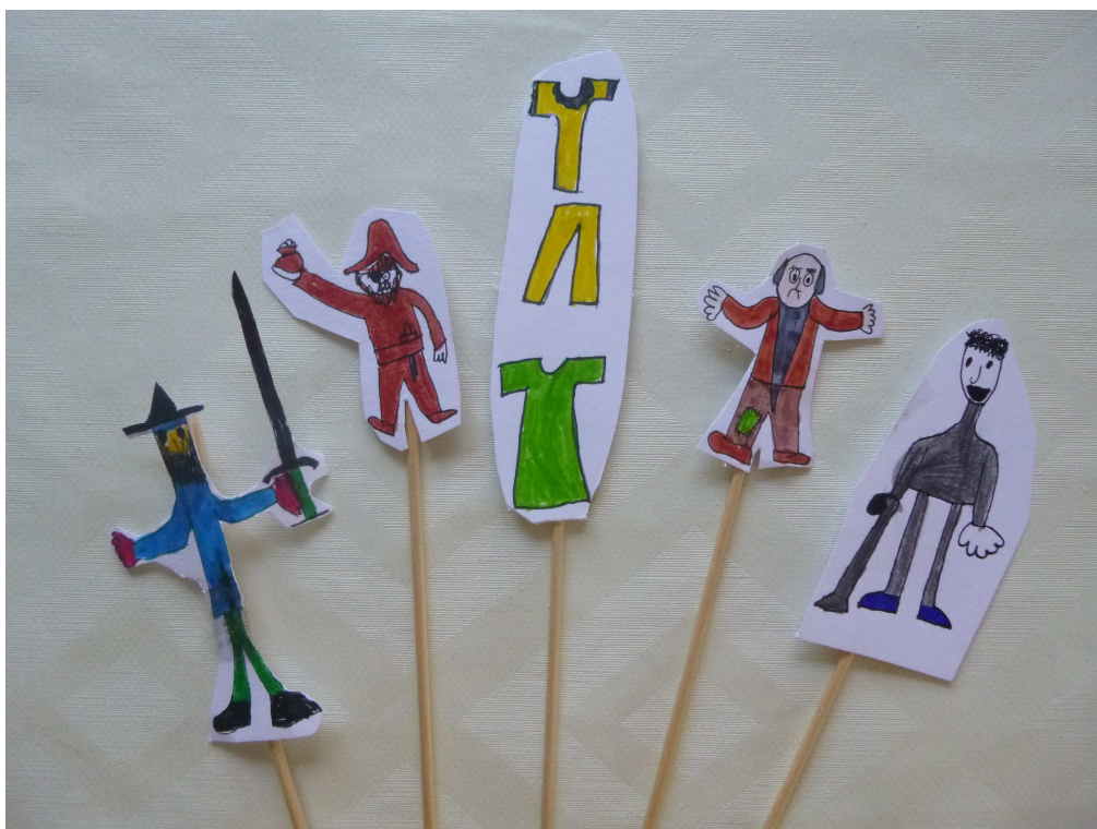
Obrázek č. 4 – Mariin malý oslík