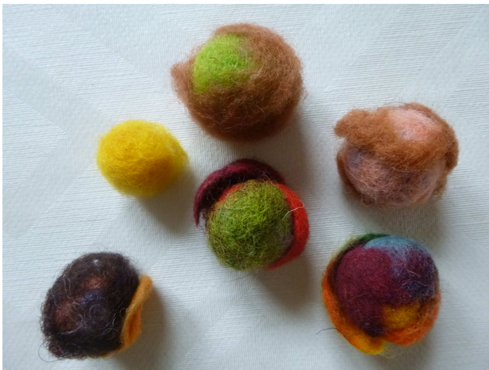
Obrázek č. 15 – Naděje