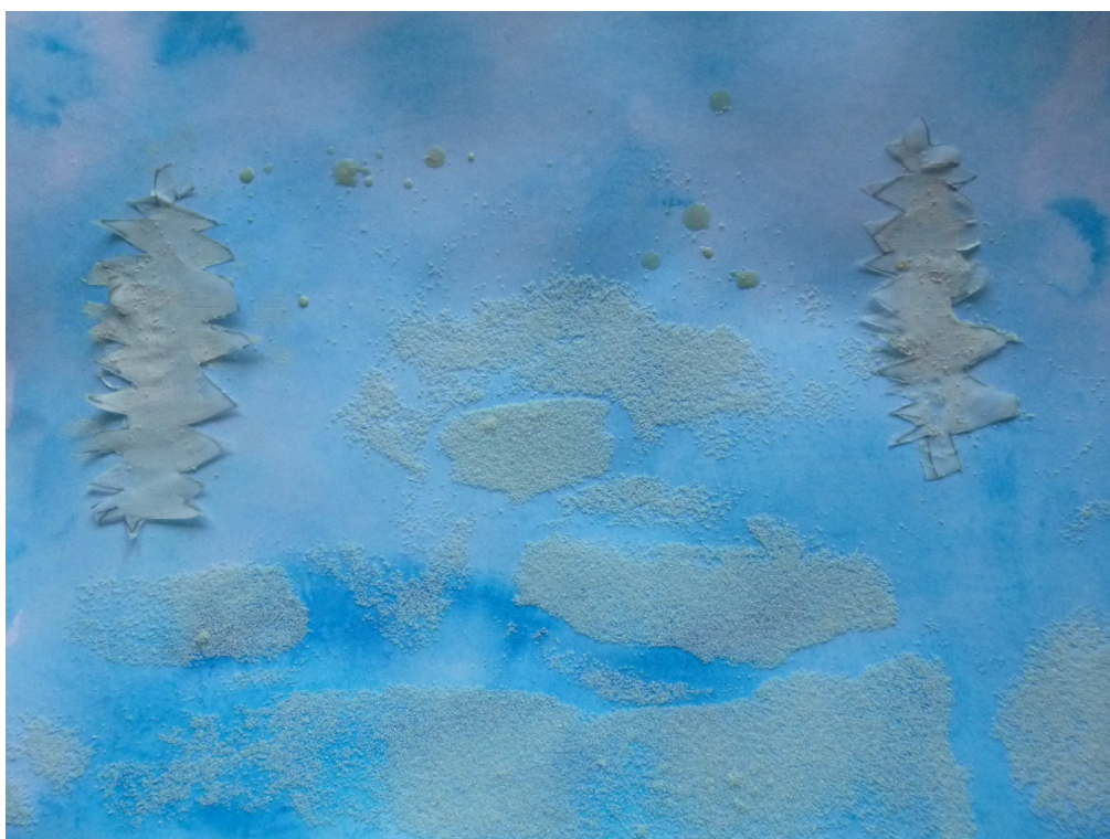
Obrázek č. 10 – Adventní krajina