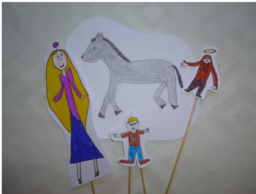
Obrázek č. 1 – Mariin malý oslík