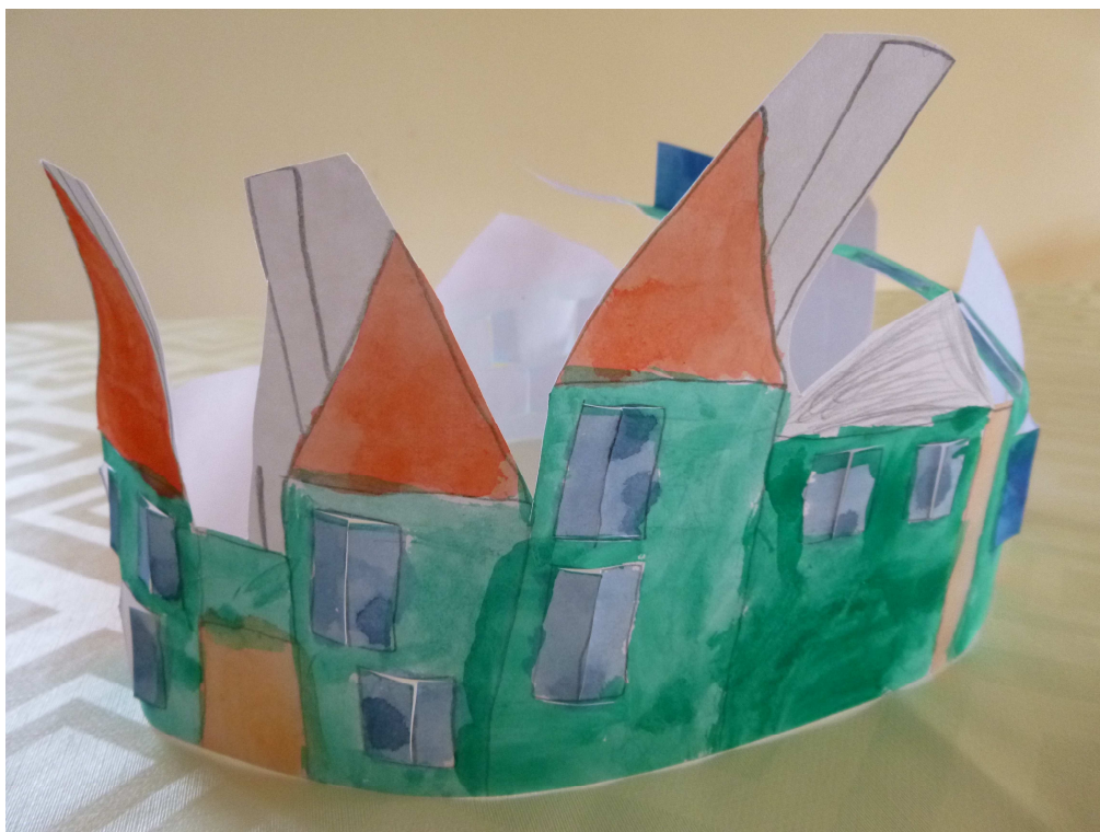
Obrázek č. 7 – Adventní městečko