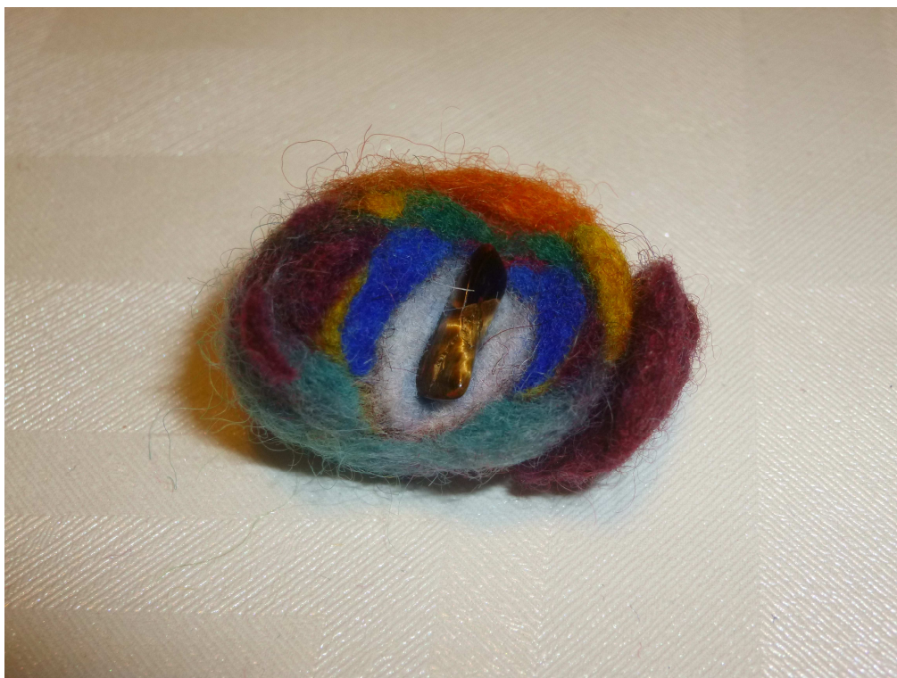
Obrázek č. 17 – Naděje