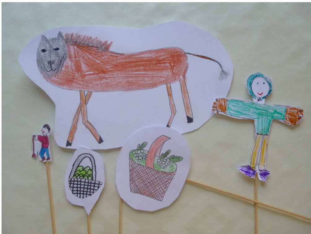
Obrázek č. 3 – Mariin malý oslík