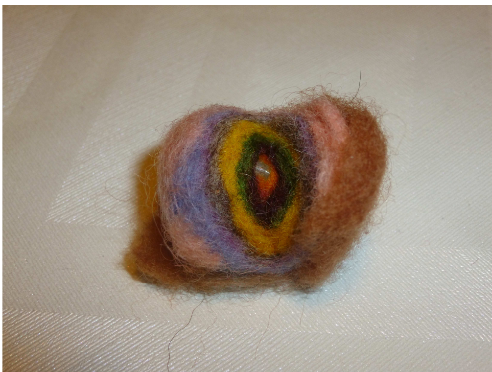
Obrázek č. 16 – Naděje