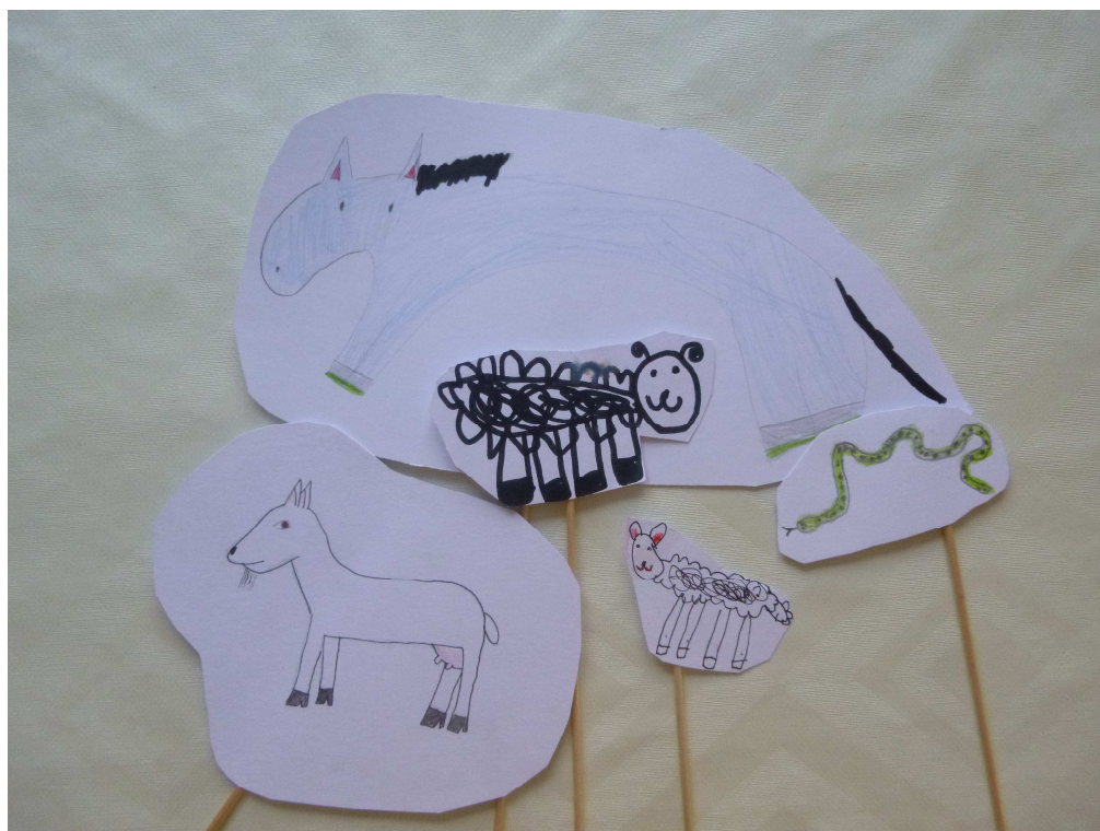
Obrázek č. 2 – Mariin malý oslík