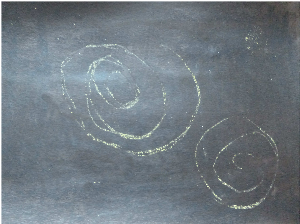
Obrázek č. 14 – Cesta