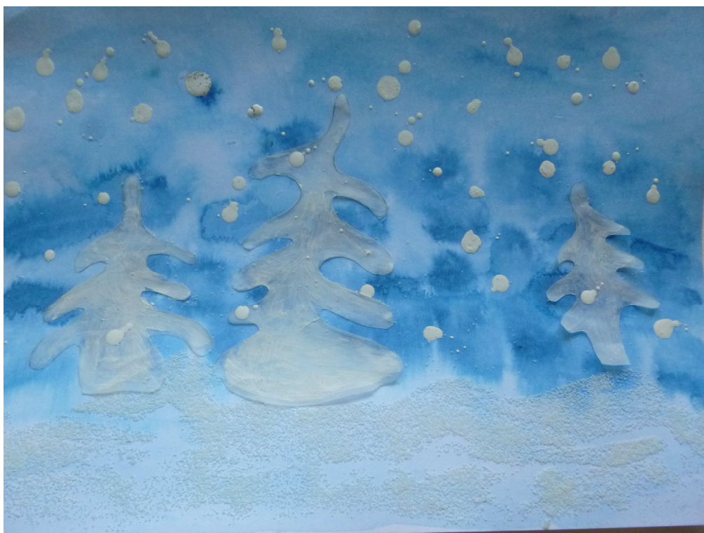
Obrázek č. 9 – Adventní krajina