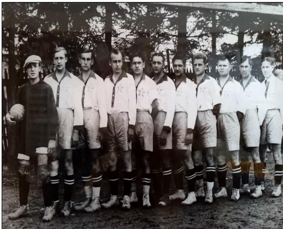
Příloha č. 6: Družstvo mužů A, které si zajistilo v sezóně 1976/1977 postup do 1. B třídy.