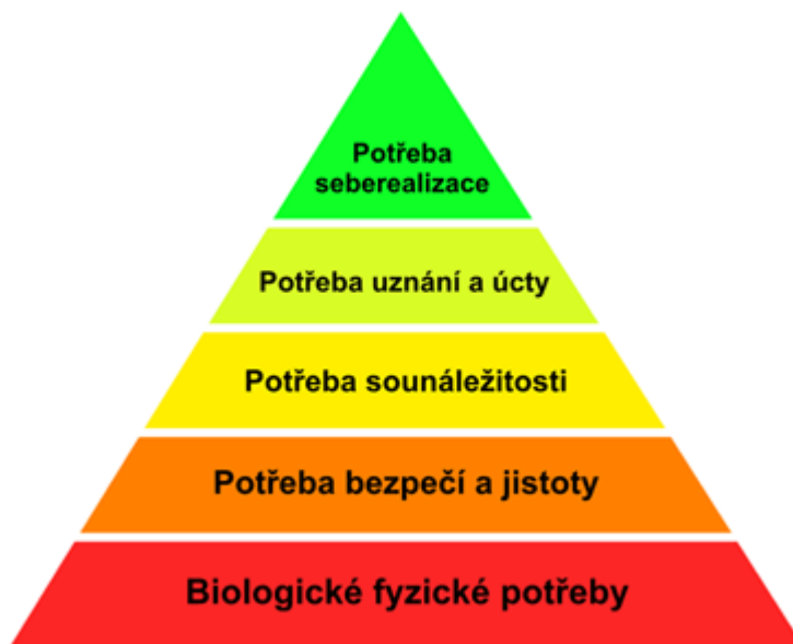
Obr. 2: Maslowova pyramida potřeb

Zdroj: Maslowova pyramida potřeb (Franěk, 2011-2014)