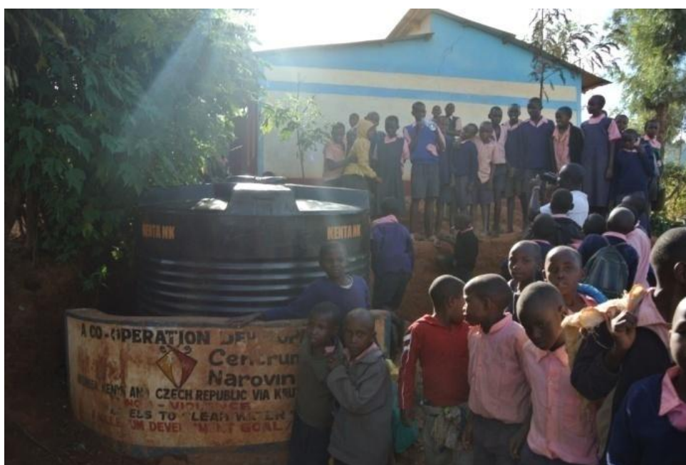
Obr. č. 3: Akumulační tank v Muthala Primary School http://www.centrumnarovinu.cz/content/voda-pro-kauti-3