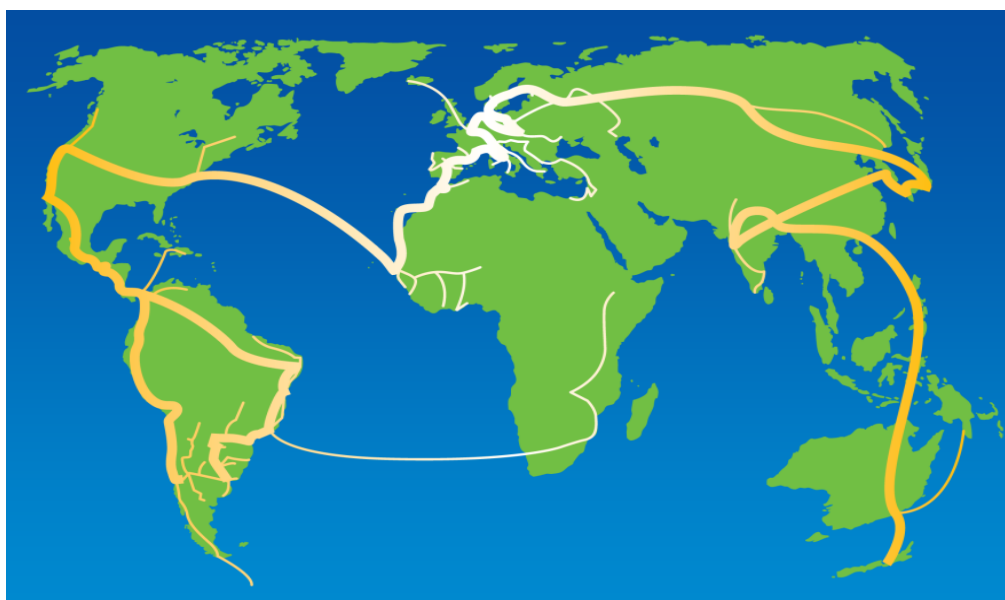
Obr. č. 4 : Mapa světového pochodu za mír a nenásilí http://www.svetovypochod.cz/files/tiny_mce/File/mapa/mapa_zjednodusena_2000x1372.png