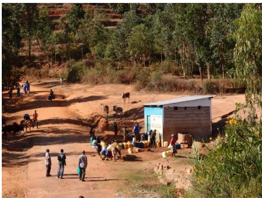
Obr. č. 2: Distribuční místo u hlavní cesty Kauti – Katitu

http://www.centrumnarovinu.cz/content/ostrov-nadeje-rusinga-island