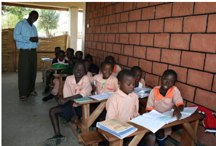
Obr. č. 1 : Děti ve škole

http://www.centrumnarovinu.cz/content/ostrov-nadeje-rusinga-island