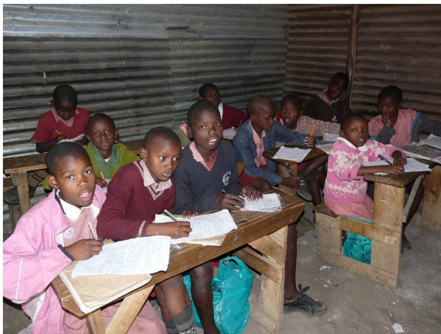
Obr. č. 5: Děti ve škole, foto poskytnuté od Simony Pilečkové