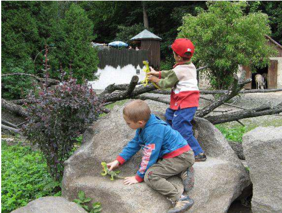
Obr. č. 1.