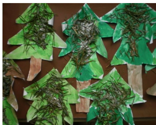
Obr. 2 - Les