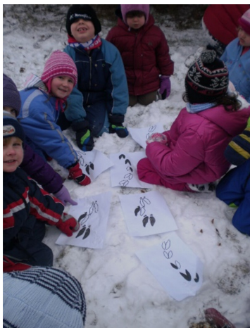
Obr. 13 - Stopy zvěře