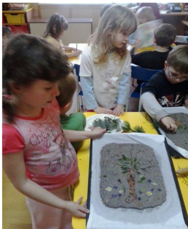
Obr. 27 – Výroba papíru