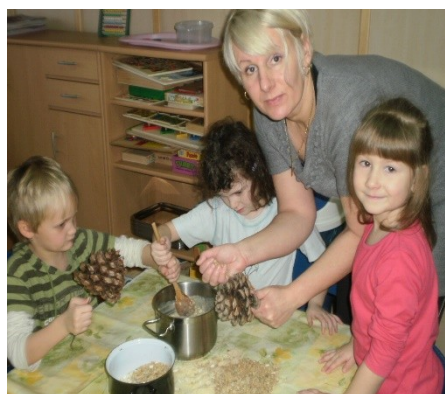
Obr. 16 - Potrava pro ptáčky