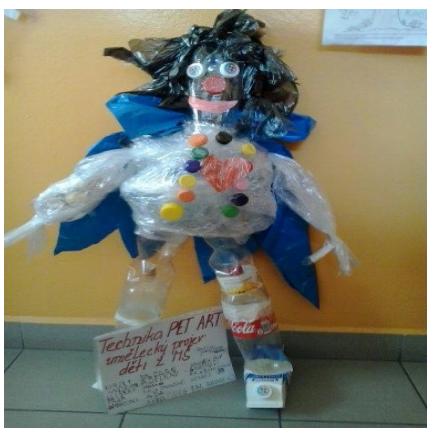
Obr. 21 - Výroba Pláštěčka