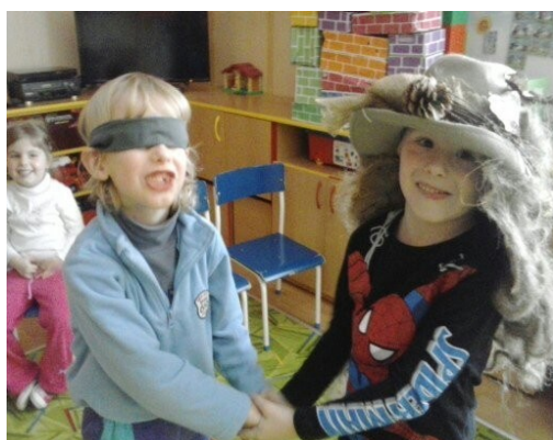
Obr. 1 - Nic nevidím, potřebuji pomoci