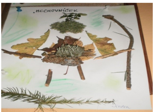
Obr. 7 - Volné kompozice