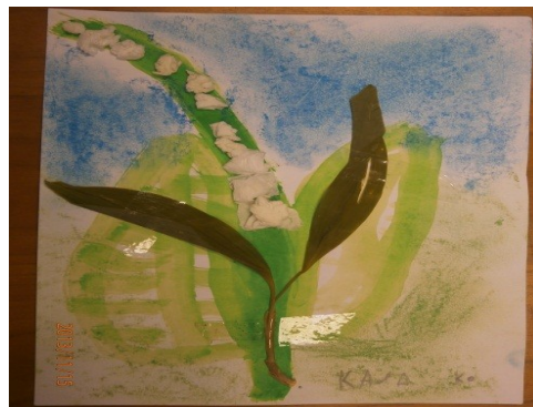
Obr. 18 – Konvalinka