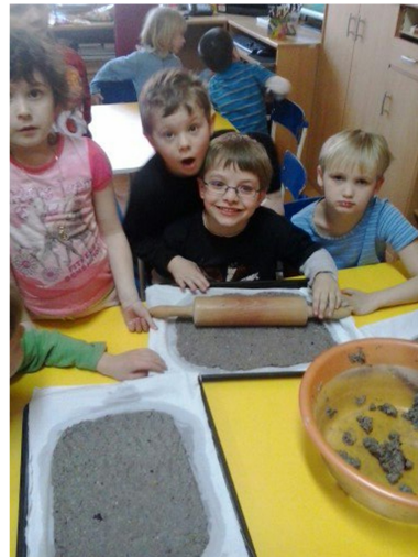
Obr. 26 - Výroba papíru