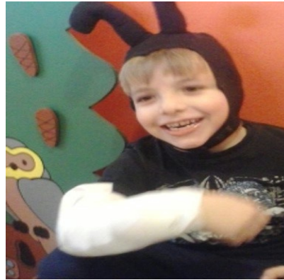
Obr. 24 - Polámal se mravenček