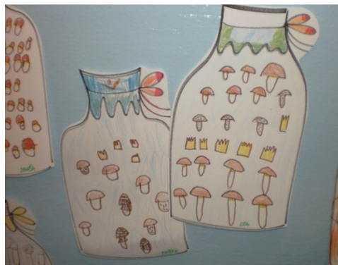
Obr. 10 - Zavařenina