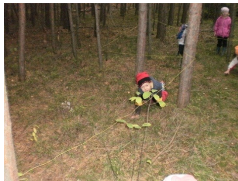
Obr. 20 - Pozorování kůry stromu