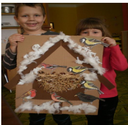
Obr. 15 - Krmítko pro ptáčky