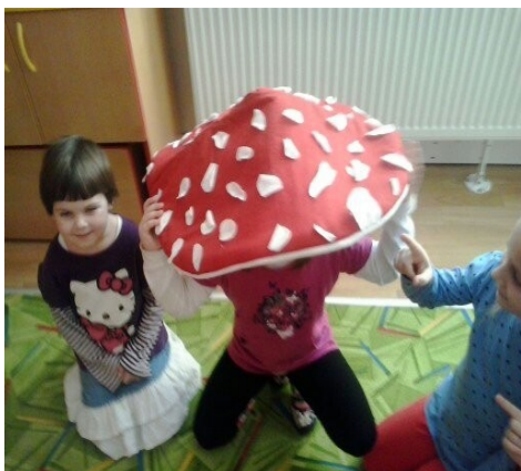
Obr. 11 - Zvířátka zachrání dědečka v lese