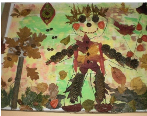
Obr. 5 – Podzimníček