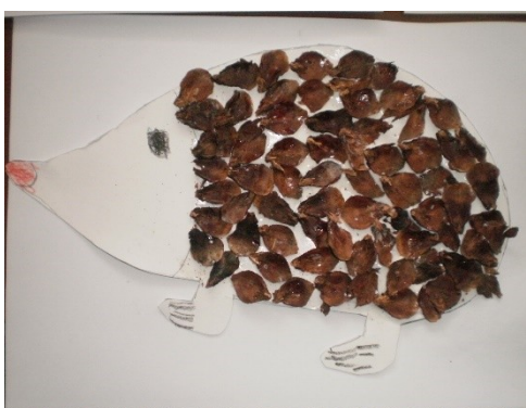
Obr. 9 – Ježek