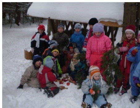
Obr. 14 - U krmelce