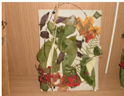
Obr. 6 - Volné kompozice