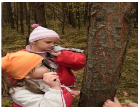
Obr. 19 - Pohybová hra Na mušky