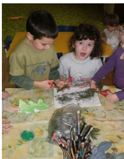
Obr. 3 - Les