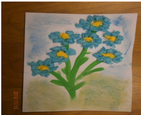
Obr. 17 – Pomněnka