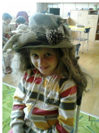
Obr. 4 - Klobouk z přírodnin