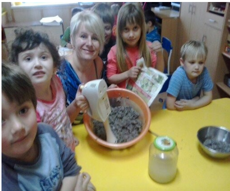
Obr. 25 - Výroba papíru