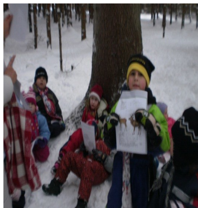
Obr. 12 - Stopy zvěře