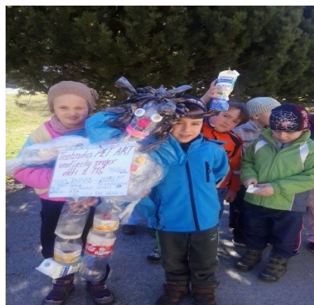
Obr. 22 - Jdeme ke kontejneru