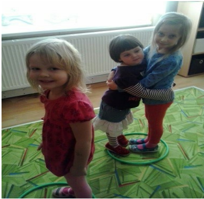
Obr. 23 - Na mravenčí komůrky