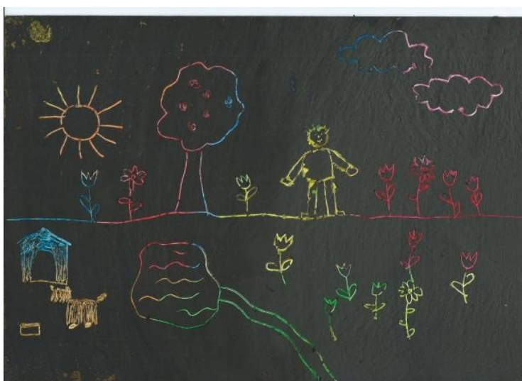
Příloha č. 6