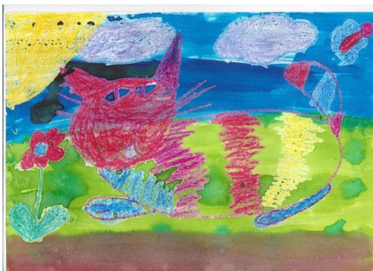
Příloha č. 4