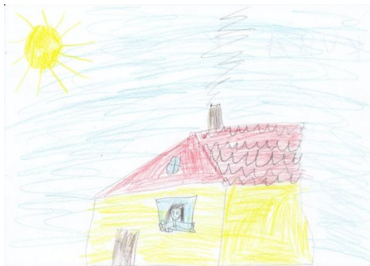
Obrázek č. 4 „Naše chalupa“

Na kresbě je dům, kam jezdí na návštěvy ke svým prarodičům. Použil pastelky na papír formátu A4, který si Michal otočil na šířku. Michal si šel kreslit, nevěděl však co. Kresba tak vznikla na můj podnět, zda by mi nakreslil, co bude dělat o víkendu. Do kresby jsem jinak nijak nezasahovala.