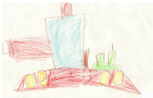
Obrázek č. 2 „Tank“

Kresba pastelkami „Tank“ vznikla v průběhu ranních spontánních činností na papír velikosti A4 – ten si opět otočil na šířku. V průběhu mi vysvětloval, co kreslí. U stolu jsem s ním seděla sama. Kresbou byl zaujatý.