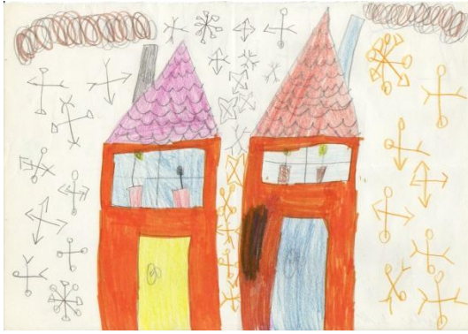
Obrázek č. 15 „Sněží“

Tento výkres nakreslila Eva během odpoledních spontánních činností, když čekala maminku. Byl to jeden z mála dnů, kdy vydatně sněžilo a to zřejmě Evu inspirovalo. Kreslila u stolu sama, většina jejích kamarádek již odešla domů. Během kresby jsem seděla vedle ní, ale nijak jsem nezasahovala. Kresba fixou a pastelkami, formát A4 otočený na šířku.