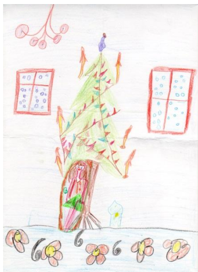
Obrázek č. 13 „Vánoční přání“