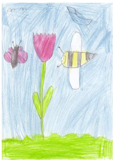
Obrázek č. 18 „Jaro“

● Posouzení kresby jako celku, subjektivní dojem z kresby: I když je lidská postava umístěna do středu plochy, moji pozornost mnohem více upoutávají výrazné objekty okolo. Kresba je propracovaná, stále se obohacuje o nové detaily. Dle mého názoru velmi zdařilý výkon dítěte předškolního věku.