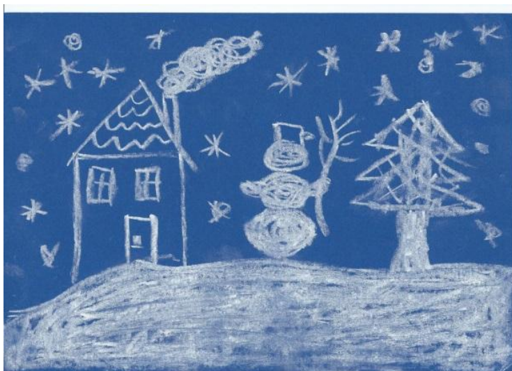
Příloha č. 1