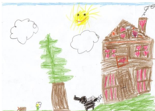
Obrázek č. 14 „Perníková chaloupka“

● Posouzení kresby jako celku, subjektivní dojem z kresby: Eva dokázala realisticky zachytit, jak to vypadá u nich doma na Vánoce. Provedení obrázku, jako pohled do pokoje, mě zaujalo. Celkově na mě obraz ale působí chladně, hlavně díky pozadí, které vykreslila nejsvětlejším odstínem modré. Kresba je ale promyšlená a detailně propracovaná.