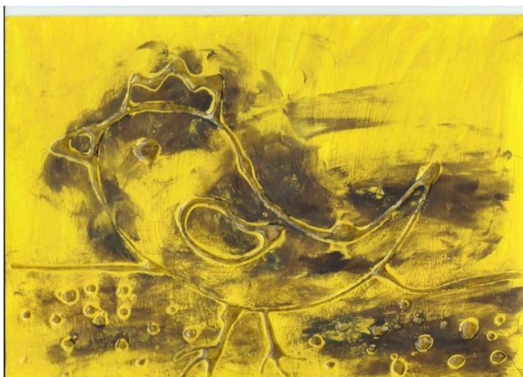
Příloha č. 5