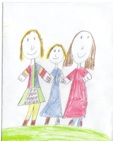
Obrázek č. 10 „S mámou a babičkou“

Kresba Evy s mámou a babičkou vznikla během spontánních ranních činností na formát A5, použity byly pastelky. Eva zobrazila sebe (uprostřed), mámu má po své pravé straně a babičku po levé. Takhle chodí spolu domů, když si Evu vyzvednou ze školy.