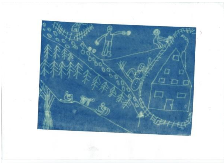
Příloha č. 8