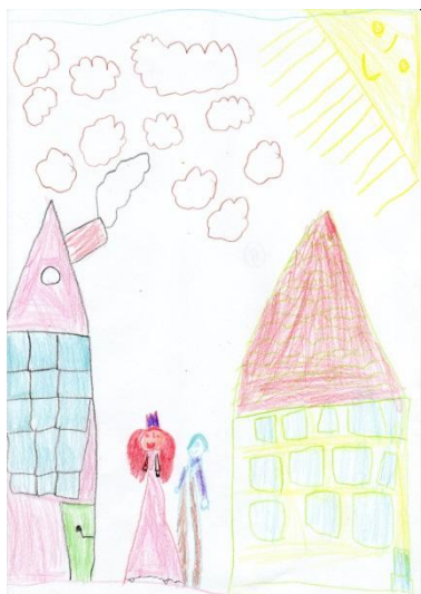
Obrázek č. 12 „Princezna“

Tento výkres Eva nakreslila odpoledne. Papír formátu A4 nechala položený na výšku. Kresba pastelkami. V závěrečném rozhovoru jsem se dozvěděla, že na obrázku maminka je princeznou a postava vedle ní je tatínek. Kreslila sama u stolu, vypadala zaujatě a soustředěně, jen občas vzhledla, aby se podívala, co dělají ostatní.