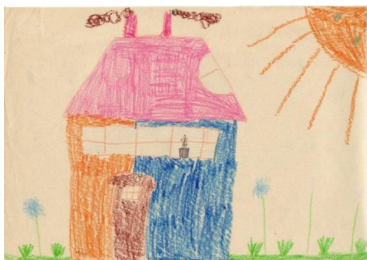
Obrázek č. 8 „Můj dům“

● Posouzení kresby jako celku, subjektivní dojem z kresby: Michal mě vyvedl z omylu, že nakreslil továrnu, ne bazén, jak jsem si původně myslela. Továrnu pojal vesele, vykreslil ji více barvami. Navzdory tomu, že pozadí odbýval a nechával je prázdná, či jen narychlo vykreslená, tady si dal záležet – vykreslil celou zbývající plochu, a to pečlivě. Čáry však vedou opět více směry.