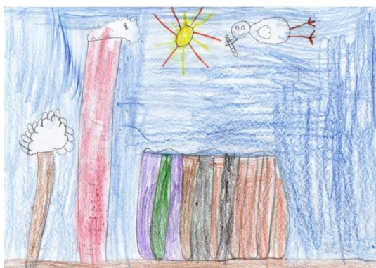
Obrázek č. 7 „Továrna“

Kresba „Továrna“ vznikla při ranních spontánních činnostech na papír formátu A4. Kresba pastelkami. Po ukončení kresby jsem se musela zeptat, co že to nakreslil, protože jsem nedokázala rozpoznat továrnu s komíny – tipovala jsem bazén.