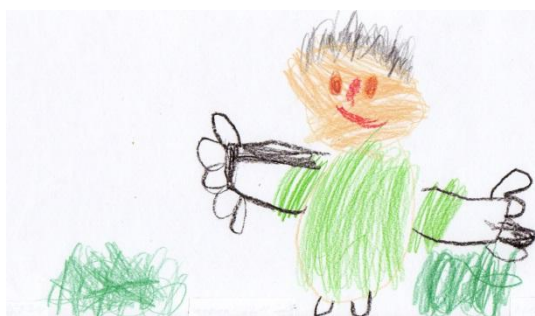
Obrázek č. 1 „Vodník“

Kresba „Vodník“ vznikla v průběhu ranních spontánních činností na formát papíru A4 otočený na šířku, kresba pastelkami. Během kresby působil Michal roztěkaně, nesoustředěně, protože v průběhu činnosti přicházeli kamarádi a bylo vidět, že za nimi chvátá (na druhou stranu chtěl obrázek dodělat). Na otázku, co nakreslil, nedokázal výkres pojmenovat. Navrhla jsem tedy, že by postava na obrázku mohla být vodníkem, s čímž Michal souhlasil.