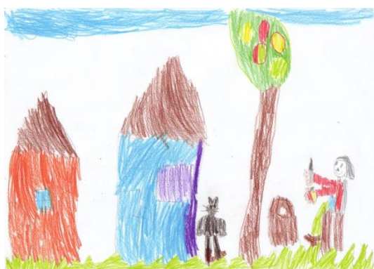
Obrázek č. 6 „Kocour v botách“