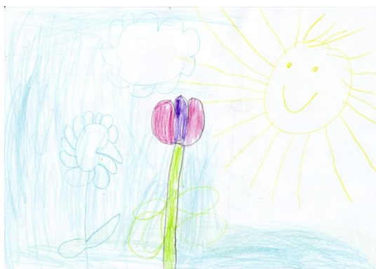
Obrázek č. 3 „Sluníčko“

Kresba „Sluníčko“ vznikla odpoledne, když Michal čekal, než si pro něj přijde maminka. Kreslit si šel sám od sebe, většina jeho kamarádů už odešla domů. Jedná se o kresbu pastelkami, na formátu A4 otočeným na šířku.