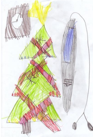
Obrázek č. 5 „Vánoční přání“

Tento výkres vznikl při spontánních činnostech, kdy děti kreslily, co by si přály dostat k Vánocům. Obrázky jsme následně dali do obálek a za okno, aby si je Ježíšek vyzvedl. Zúčastnila se většina dětí. Během kresby vypadal Michal soustředěně, s nikým nemluvil a bylo vidět, že se snaží.