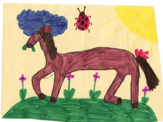
Obrázek č. 16 „Kůň na louce“

● Posouzení kresby jako celku, subjektivní dojem z kresby: I přes to, že Eva zachytila zimní náladu, nepůsobí na mě obrázek studeně. Díky tomu, že posadila domy blízko k sobě, mám pocit, že si přeje blízkost obou rodičů.