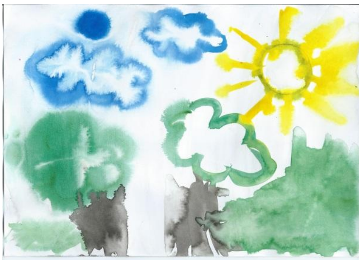
Příloha č. 3