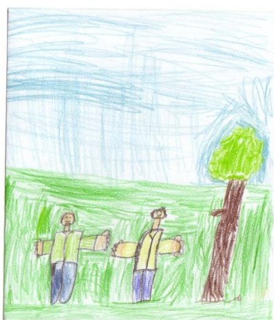
Obrázek č. 9 „S tátou“

● Posouzení kresby jako celku, subjektivní dojem z kresby: Z kresby mám smíšené dojmy – díky použití výrazných barev, krásnému okolí a slunci na mě působí pozitivně. Na druhou stranu dům je pro mě nepřístupný, zamřížované okno ve mně evokuje vězení, stejně jako dveře bez kliky.