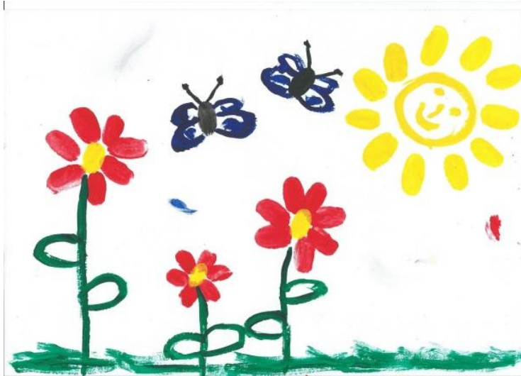
Příloha č. 7