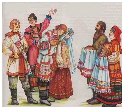
Obrázek č. 2: Tradiční červené svatební šaty

Výběru oblečení věnuje hodně času hlavně nevěsta. Na svatbě se všichni dívají především na ni, proto je téměř povinností nevěsty vypadat úchvatně. Klasické svatební šaty jsou bílé. Představují čistotu a nevinnost. Je to však trend až několika posledních století. Při starodávné ruské svatbě měla na sobě nevěsta většinou červené šaty. Bývaly bohatě vyšíváné a dlouhé (viz obr.) Poslední dobou se barevná škála opět rozšiřuje a jsou v módě, mimo jiné, i šaty v odstínech šampaň, růžové nebo světle modré. To samé platí i u délky, střihu a materiálu.