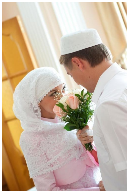
Obrázek č. 15: Tatarské svatební oblečení

Charakteristickým znakem tatarských svateb je, že hlavní část svatby se koná v domě nevěsty. Svatební ráno začíná příjezdem ženichovy rodiny do domu nevěstinych rodičů. Přiváží s sebou několik druhů jídel – chléb, husy, placky, sladkosti. Svatby se účastní i příbuzní a přátelé z nevěstiny strany. Ženská část svatebčan se odebírá do jedné místnosti, mužská do druhé. Snoubenci se svatebního obřadu neúčastní, mají na sobě však i přesto svatební oblečení. Ženy nosí bohatě zdobené šaty bílé barvy a vlasy si zakrývají šátkem. Ženich má většinou také pokrývku hlavy (viz obr.). Mezi muže přichází mulla, zapisuje všechny položky výkupného a ptá se, zda se svatbou chlapec i dívka souhlasí. Za ženicha odpovídá jeho otec, za dívku dva svědkové. Poté předčítá úryvky z Koránu a prohlašuje manželství za uzavřené. Když mulla odejde, začíná svatební hostina. Ta se od ostatních liší tím, že jako první se podává med a máslo. Hosté