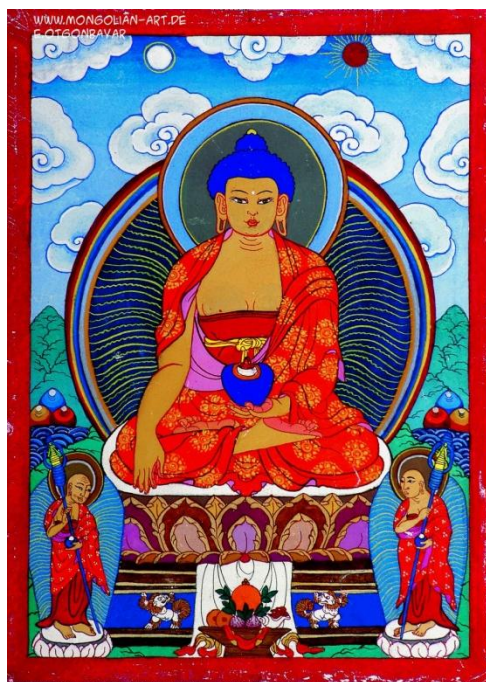
Obrázek č. 6: Burchan

Jako každý svatební obřad, i ten burjatský se dělí na několik etap. Prvním krokem k uskutečnění svatby jsou námluvy. Provádějí je příbuzní z ženichovy strany. Volí se dva nejváženější lidé z rodiny – chudyn turuu (muž) a chudagyn turuu (žena). Ve skutečnosti to žena být vůbec nemusí, zato musí být oba naprosto zdraví, mít hodně dětí a jejich děti taky musí být živé a zdravé. Na námluvy se také nesmí přijíždět na „kulhavé kobyle“ – v dnešní době tedy rozbitým autem. Dohazovače po příjezdu nikdo nevíta ani nezve dál. Vcházejí sami. Jdou tiše k burchanu 17 (viz obr.) a předkládají před něj oběti a dary. Až poté začíná rituální rozhovor mezi dohazovači a rodiči nevěsty. Ti dělají, že nevědí, proč dohazovači přišli a co po nich chtějí, i když byly námluvy předem