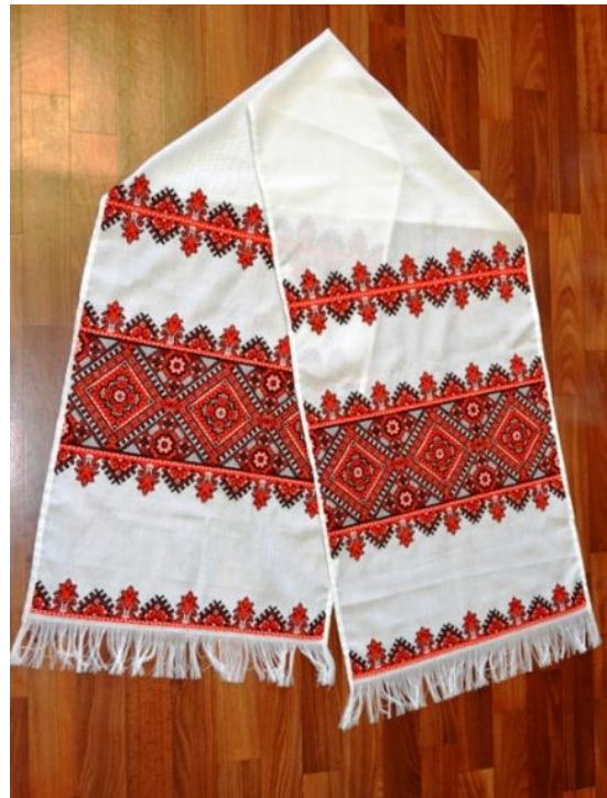
Obrázek č. 17: Vyšívaný ručník

Přibližně dva týdny po námluvách se odehrávají zaručiny (заручини). Je to rituál, který by se dal přirovnat k zasnubám. Konají se v domě nevěstinych rodičů a účastní se jich i rodiče a příbuzní ženicha a přátelé obou stran. Nejstarší dohazovač pokládá na stůl karavaj, na něj dává ruku nevěsty a ženicha a navrch ruce svědků a převazuje společně karavaj i ruce vyšívaným ručníkem (viz obr.). Poté nevěsta všechny obdarovává šátky, kapesníčky nebo košilemi. U toho se