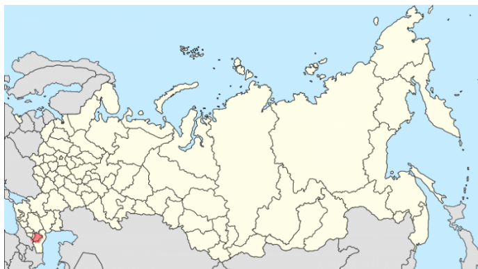
Obrázek č. 8: Oblasti obývané Čečenci

Čečenci jsou jedním z původních národů žijících na Kavkazu. Žijí převážně v Čečenské republice, část jich obývá sousední Dagestán, Ingušsko a sever Gruzie. (viz obr.) Celkový počet Čečenců je přibližně 1 500 000. Jsou to velice temperamentní a horkokrevní lidé. Hlásí se k islámu.