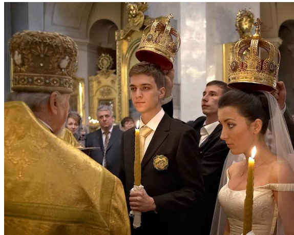
Obrázek č. 4: Držení svatebních korunek nad hlavami ženicha a nevěsty

Obřad trvá okolo dvou hodin. Skládá se ze dvou částí. V první části zvané obručení (обручение) kněz žehná ženichovi a nevěstě pomocí svíček a vybízí je, aby si vyměnili prsteny, které mezitím leží na oltáři a tím získávají požehnání od Boha a symbolizují počátek nového rodu a věčné lásky mezi mladou dvojicí. Než se prsteny navlékají na prst, musí si je nevěsta a ženich nejprve třikrát vyměnit. V druhé části, které se říká