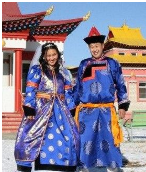
Obrázek č. 7: Svatební oblek Burjatů

Měsíc po svatbě přijížděla nevěsta na návštěvu za rodiči. Vozila jim pohoštění a dárky a zůstávala u nich celý týden. Pokud se však v průběhu měsíce po svatbě ukázala jako líná a nešikovná, mohl ji manžel poslat za rodiči už navždy.