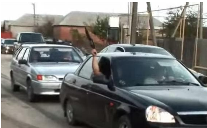
Obrázek č. 9: Střílení do vzduchu během jízdy ve svatebním průvodu

Pokud zasnoubená dívka chtěla jít ven, musela s sebou nosit dárek (většinou prsten), který dostala od budoucího manžela o zasnuby. Ty se odehrávaly těsně po námluvách. Svatba se mohla konat ve středu, v sobotu nebo v neděli a trvala tři dny. Ráno přijížděl ženich za nevěstou a platil za ni „kalym“, což je jinými slovy výkupné. Ten vybírali nejstarší muži z rodiny. Vybírá se i dnes a stejně jako kdysi se společně s ním přiváží nevěstině rodině i spousta darů. Dále musí zaplatit i nevěstině kamarádce, která ženichovu nastávající drží za ruku a bez výkupu nechce pustit. Kromě peněz to může být i nějaká hodnotná věc. Po uhrazení všech výkupů si nevěstu ženich konečně může odvézt domů na hostinu. Jede se v dlouhém svatebním průvodu tvořeným luxusními automobily a po cestě se zpívá, dělají se smyky a střílí se do vzduchu ze zbraní (viz obr). Má to odhánět zlé duchy. Občas také svatební kolona zastaví. Důvodem může být zastavení kvůli dalšímu placení výkupného nebo prostě jen kvůli chuti si zatancovat. Na budoucí manželky už u ženicha doma