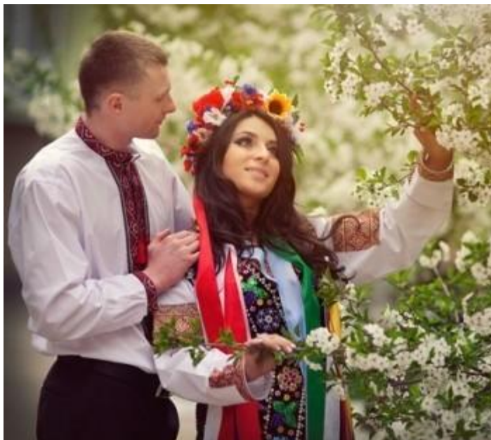
Obrázek č. 18: Ukrajinské svatební oblečení

chytí, se do roka vdá. Ženich si obléká bílou košili s výšivkou, kterou mu podle starodávných tradic má vyšít nevěsta, plátěné kalhoty a společenské boty. Přebládajícími barvami je bílá a červená (viz obr.).