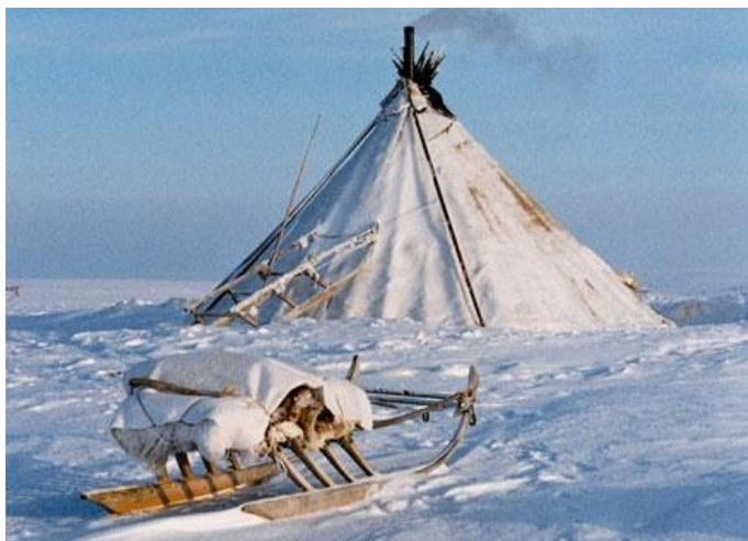
Obrázek č. 12: Čum a tradiční saně

autonomním okruhu, jsou však rozšíření i po celém pobřeží Severního ledového oceánu od poloostrova Kola po poloostrov Tajmyr (viz obr. č. 11). I v dnešní době žijí Něnci v tradičních kuželovitých stanech, kterým se říká čum (viz