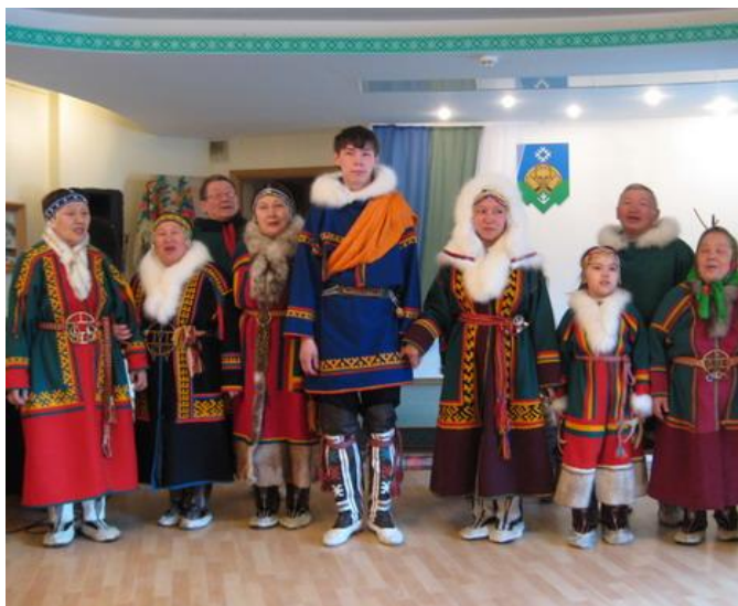
Obrázek č. 13: Něněcké sváteční oblečení

Svatba se uskutečňuje až po zaplacení věna. Může to být až rok po námluvách a většinou se koná na podzim. Něnci nemají typický svatební úbor. Oblékají si tradiční sváteční oblečení, které vypadá podobně jako to, které nosí každý den, jen je ušité z kvalitnější kůže nebo látky (viz obr.). Součástí nevěstina svátečního úboru jsou zvláštní ozdoby, kterým se říká nakosniki a které se vplétají do vlasů, staré stříbrné mince zavěšené na řetízku a jiné ozdoby, které při chůzi cinkají a tím odhánějí zlé duchy.