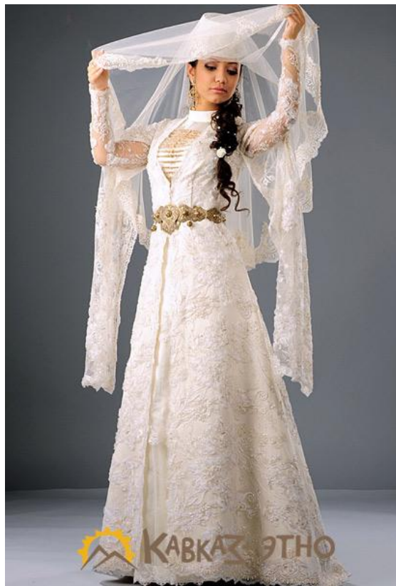
Obrázek č. 10: Čečenské svatební šaty

nádherné bohatě zdobené šaty (viz obr.) Ženy a muži sedí na hostině v. oddělených místnostech. Setkávají se až při tancování. Svatby se nevěstina rodina neúčastní. Ty jsou zváni až na třetí svatební den a to pouze muži. Hostiny se neúčastní ani ženich. Slaví v podstatě svatbu oba zvlášť. Tráví všechny tři dny se svými kamarády. I svatebního obřadu se dvojice účastní odděleně. Mladou dvojici oddává muslimský duchovní, kterému říkají „mulla“. Ten se obou snoubenců ptá na různé otázky týkající se jejich manželství. Dávat najevo city nebo o nich mluvit se u Čechenců nehodí, proto i při těchto hovorech s mullou se velice stydí. Navíc se jich vždy účastní i svědek.