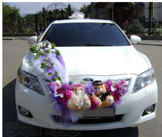
Obrázek č. 3: Tradiční ruská výzdoba svatebního automobilu

Po výkupu dostává mladý pár od rodičů nevěsty požehnání, nasedá do vozidel (většinou do automobilů) a odjíždí na matriční úřad. Po cestě od domu nevěsty k svatebním vozidlům, rodiče a přátelé hází na mladý pár okvětní lístky růží. Symbolizuje to přání hezkého a šťastného života. Svatební průvod se skládá z minimálně dvou vozidel. Nevěsta a ženich sedí při cestě na úřad odděleně a po uzavření manželství na zpáteční cestě už spolu. Na úřad jedou také hosté.