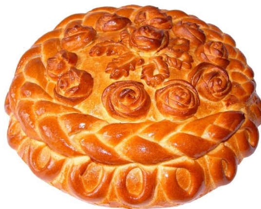
Obrázek č. 1: Karavaj

Námluvy (сватовство) již od dávných dob patří mezi jeden z nejvýznamnějších ceremoniálů spjatých se svatbou a manželským životem. Již v době Kyjevské Rusi byly námluvy nejrozšířenějším způsobem získání požehnání ke společnému životu a domluvy rodin ženicha a nevěsty na všech podrobnostech týkajících se svatby. Probíhaly vždy přísně stanoveným způsobem. V předem domluvený den a hodinu přicházeli k nevěstě domu dohazovači, kterým se v Rusku říká svaty (сваты). Byli to buď profesionální dohazovači, nebo někdo z ženichovy rodiny či přátel. Přicházeli zpravidla po západu slunce, pravděpodobně aby předešli uhranutí. Celý rituál začínal popíjením čaje a povídáním na témata, která se netýkala námluv. Až po nějaké době se dohazovači začínali vyptávat na nevěstu a na to, zda je rodina ochotna dceru provdat. V případě, že rodiče nebyli proti, zvali dohazovače ke stolu, na který kladli bochník zvaný karavaj (каравай) (viz obr.) a sůl. Všechno ostatní jídlo servírovala nevěsta a tím předváděla své kuchařské dovednosti. Dohazovači k nevěstiným rodičům chodili po několik dní. Domlouvali se na datu a místě svatby, na výdajích spojených s hostinou a na dalších důležitých detailech.