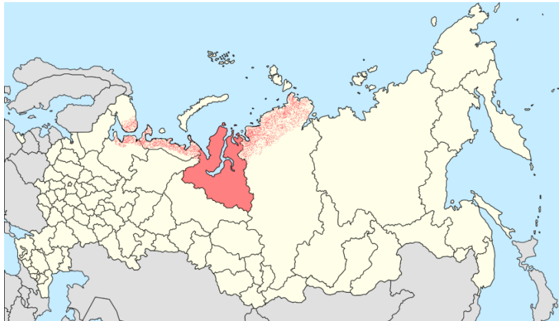
Obrázek č. 11: Oblasti obývané Něnci

vojenské službě a je jim usnadněno získání vyššího vzdělání.“ 23 Celkový počet Něnců je přibližně 41 000. Nejvíce příslušníků tohoto národa žije v Jamalskoněneckém