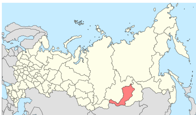
Obrázek č. 5: Burjatsko

Burjati jsou původními obyvateli Republiky Burjatsko (viz obr.). Žijí také na severu Mongolska a severovýchodě Číny. Mluví burjatským jazykem, který patří k mongolské jazykové skupině. Jejich duchovní život se řídí křesťanstvím, z části však i buddhismem a šamanismem. Celkový počet Burjatů se odhaduje na 620 000. I v dnešní době je to málo modernizovaná kultura a ve velké míře ctí své tradice.