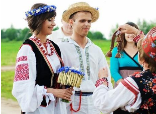
Obrázek č. 16: Běloruské svatební oblečení

Tradiční svatební oblek Bělorusů je podobný ukrajinskému. Nejshodnějším prvkem je bílá košile s výšivkou, kterou mohla doplňovat vyšivaná vesta. Další částí tradičního svatebního oblečení je plátěná sukně, přes kterou se uvazuje bohatě zdobená zástěra a taky vyšivaný opasek. Na hlavu si nevěsty zavazovaly bílý šátek, na který pokládaly věnec. Na nohou mívaly červené boty. Ženichové nosili také bílou vyšivanou košili, přes kterou si občas brali i vestu. Dále si oblékali plátěné kalhoty, zdobený opasek a černé boty (viz obr.). Dnes se již takové oblečení na svatbě moc nevidí. Stejně jako v celé západní Evropě, i v Bělorusku převzaly prvenství bílé šaty se závojem a černý společenský oblek.