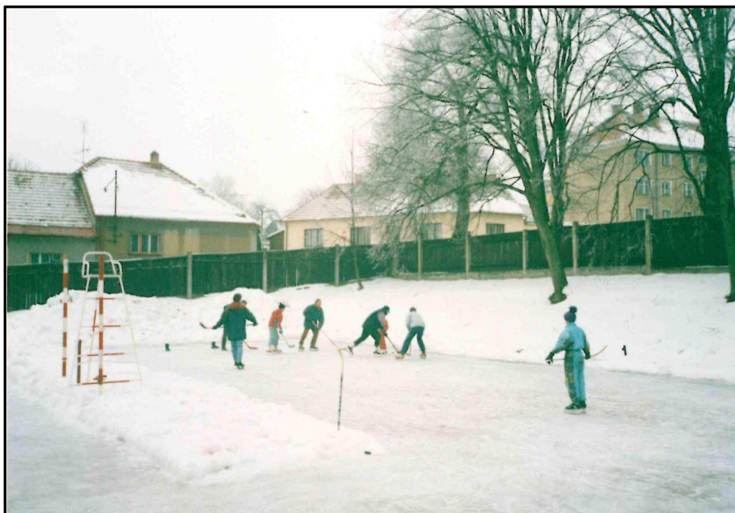
Obrázek 12. Roku 2001 se volejbalové kurty v Pacově změnili v kluziště, které využili všechny generace ke hře hokeje a bruslení.