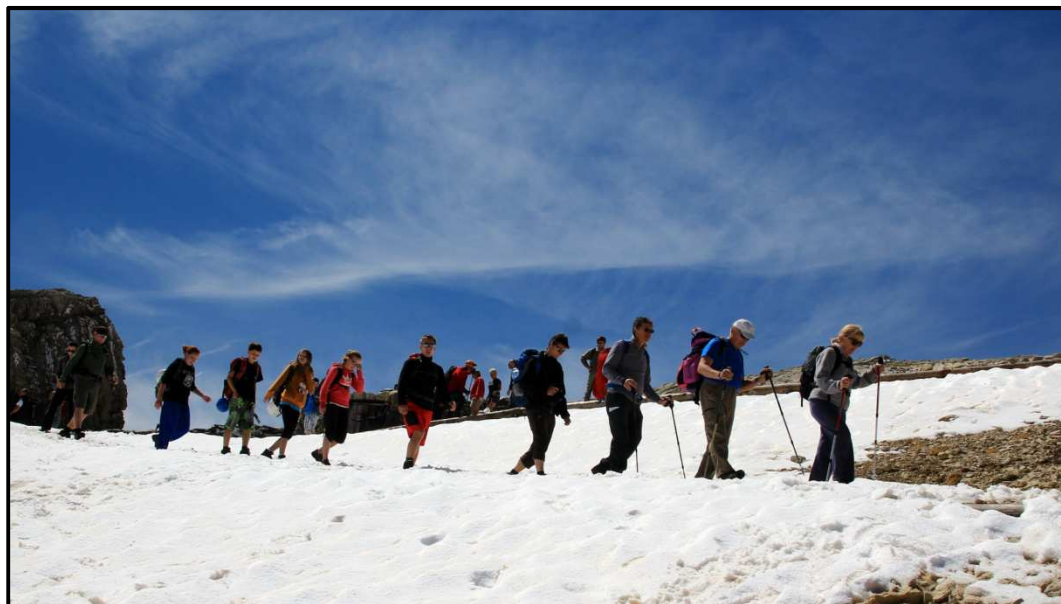
Obrázek 20. TOM Kamarádi Pacov na expedici Sardinie, 13. července 2014.