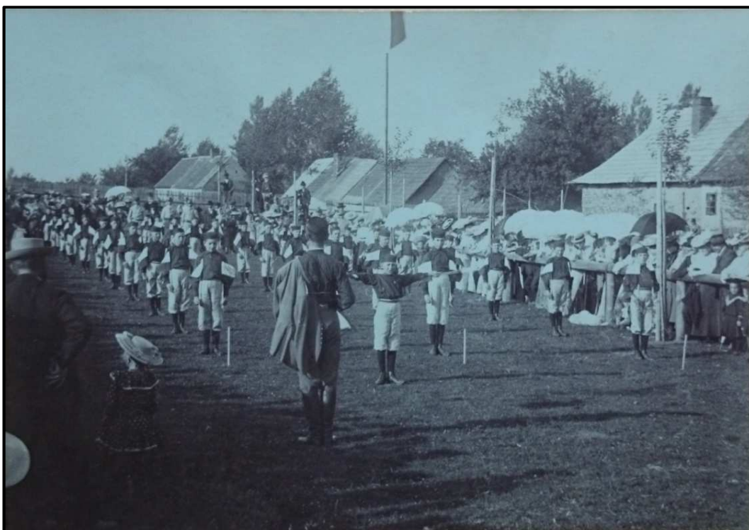
Obrázek 2. Sokolská slavnost Na tržišti v Pacově roku 1913, konaná v rámci župního sletu. Depozitář Městského muzea Antonína Sovy v Pacově.