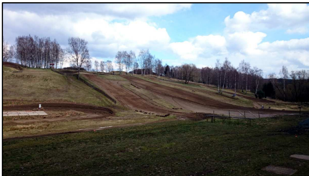
Obrázek 26. Motokrosové závodíště Propad, které leží 500 metrů jižně od Pacova. 4. dubna 2014.