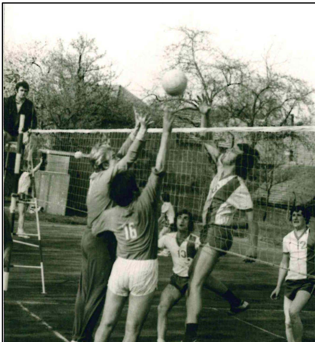
Obrázek 10. Zápas okresního přeboru ve Stojčíně proti domácímu družstvu, odehraný v sezoně 1974–1975. Archiv klubu TJ Slavoj Pacov – oddíl volejbalu.