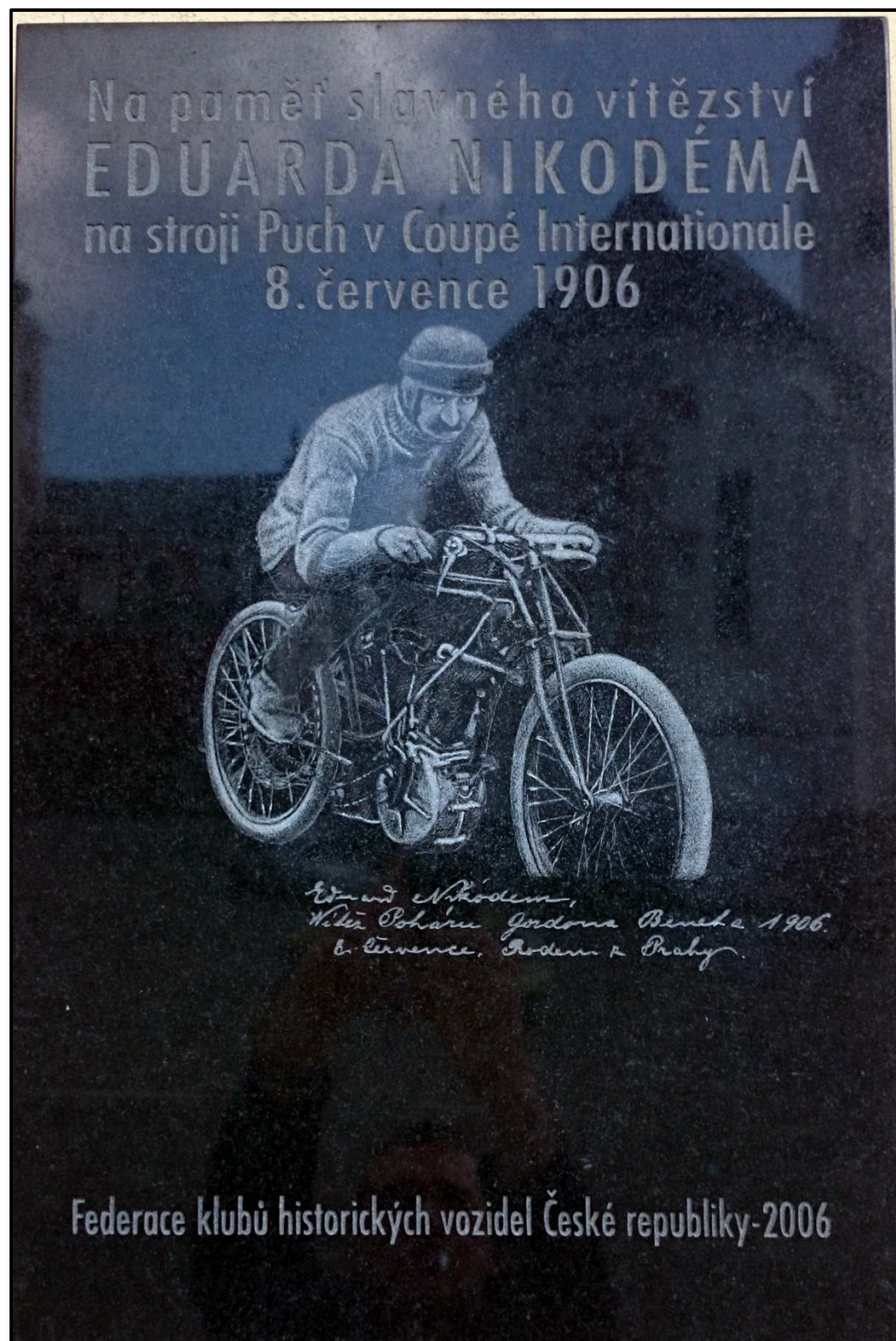
Obrázek 28. Pamětní deska vzpomínající vítězství Eduarda Nikodéma v závodě Coupe Internationale, které se konalo v roce 1906 právě na Pacovském okruhu. Deska je umístěna na zdi restaurace Na Panské, kde probíhala jednání funkcionářů o založení FIM.