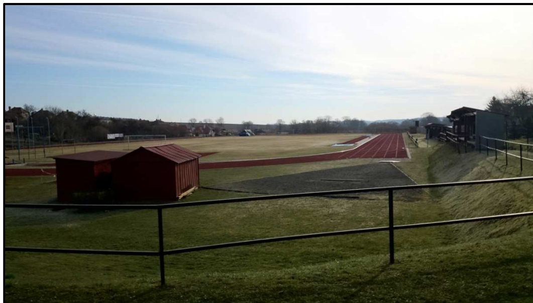
Obrázek 27. Atletický stadion v Pacově. Domovský oddíl je TJ Slavoj BANES Pacov. 4. dubna 2014.