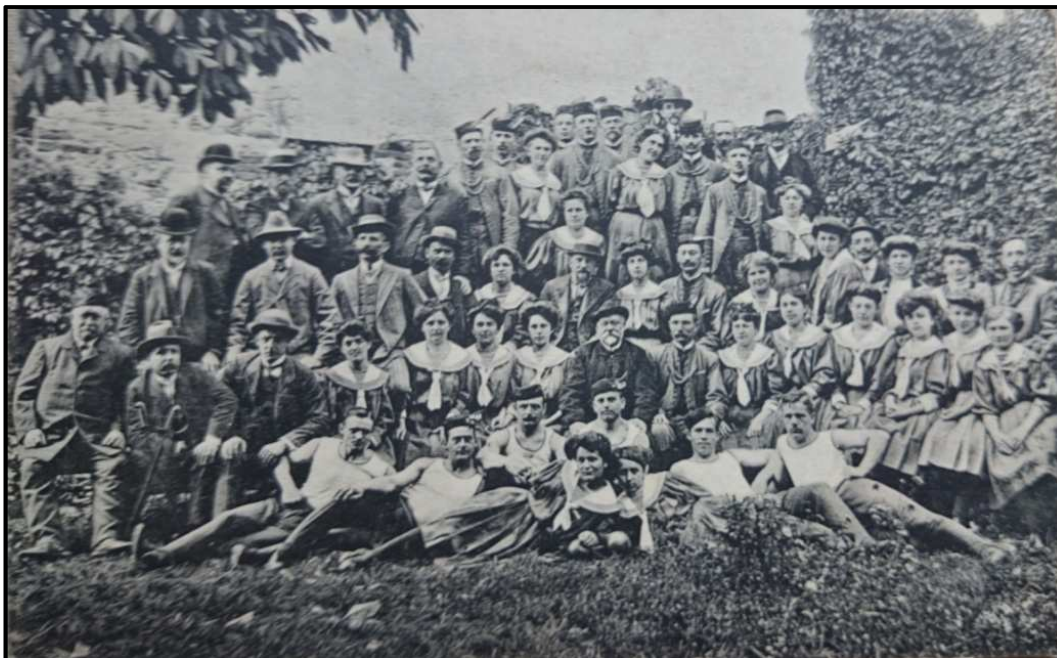
Obrázek 1. Společná fotka všech členů sokolské obce v Pacově v roce 1910. Depozitář Městského muzea Antonína Sovy v Pacově.