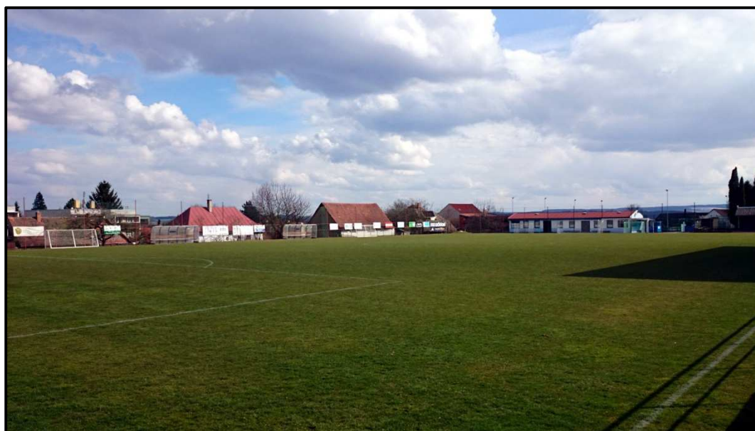
Obrázek 25. Fotbalový stadion TJ Slavo Pacov. Foto od tenisových kurtů. 4. dubna 2014.