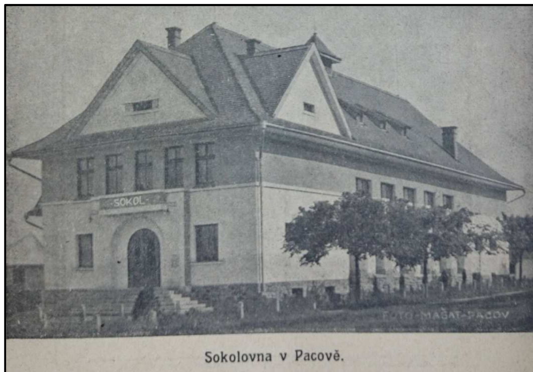
Obrázek 5. Budova sokolovny na obálce Zpravodaje župního sletu v Pacově z roku 1930. Zpravodaj župního sletu v Pacově.