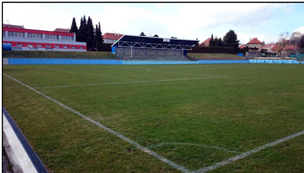
Obrázek 24. Fotbalový stadion TJ Slavoj Pacov. Foto od kabin. 4. dubna 2014.