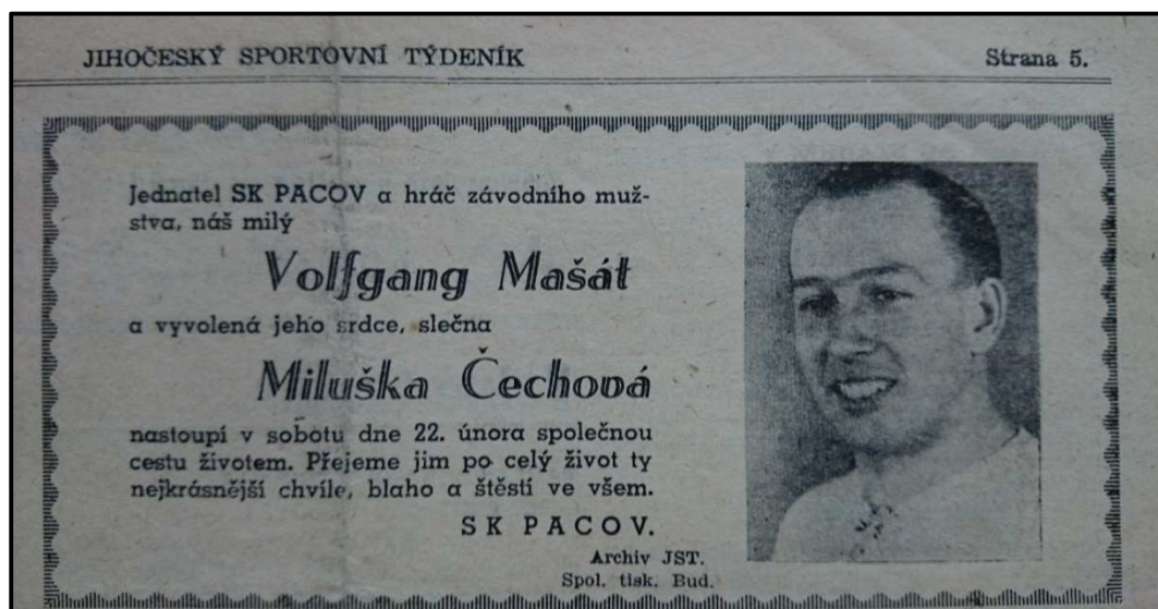
Obrázek 6. Svatební oznámení Wolfganga Mašáta, které otiskl i Jihočeský sportovní týdeník v roce 1941. Svědčí to o věhlasu osoby W. Mašáta a o tom, jak byl oblíbený po celém státě. Jihočeský sportovní týdeník.