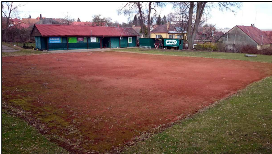
Obrázek 22. Zázemí volejbalového klubu TJ Slavoj Pacov. Zelený objekt je předělaný železniční vagón, který slouží jako šatny a sprchy. 4. dubna 2014.