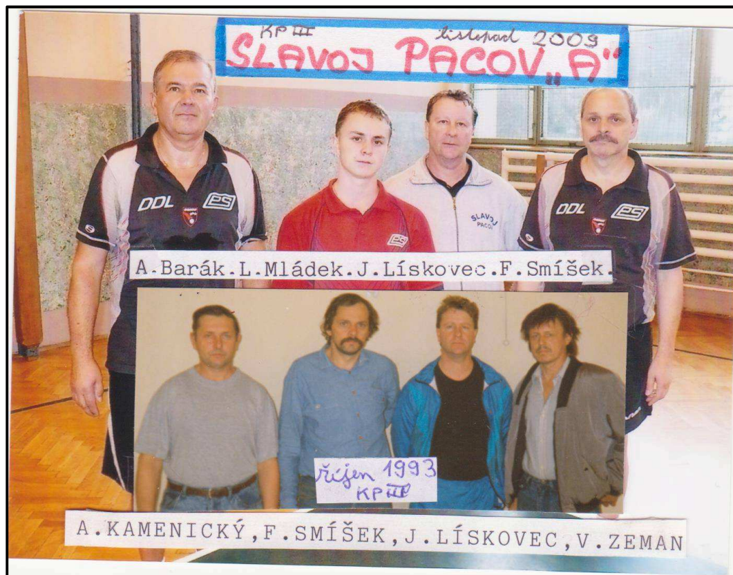
Obrázek 16. Mužstvo A oddílu stolního tenisu. Malá fotografie sestavy z roku 1993 a na velké fotografii sestava o 16 let později.