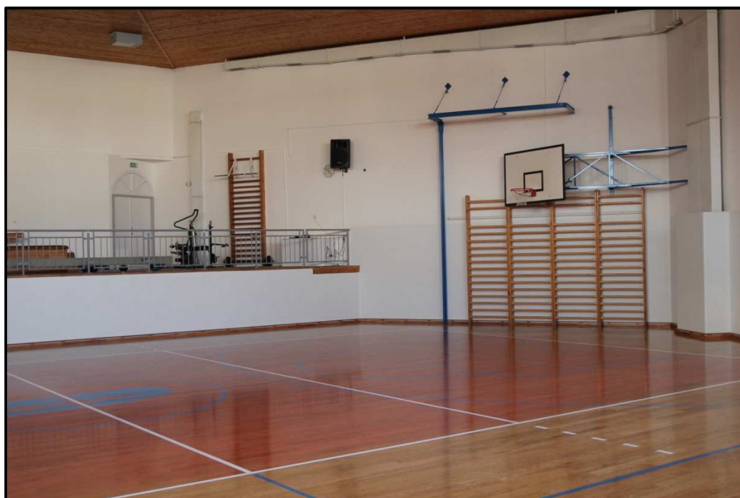
Obrázek 21. Tělocvična na Gymnáziu Pacov, na které odehrávají svá utkání v zimní části sezony pacovští volejbalisté.