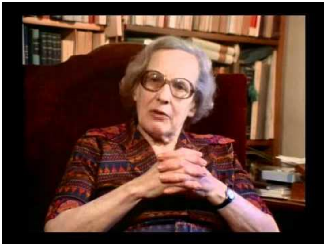
Marie Louise von Franz