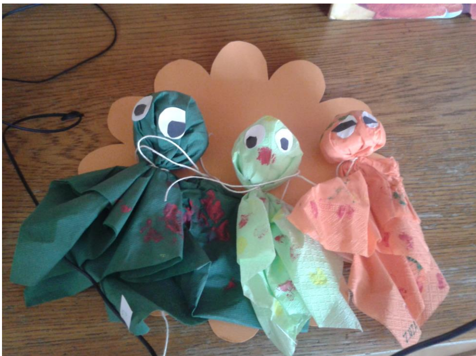
Výsledek výtvarné činnosti – „podzimní strašidýlka“.

Jak je již uvedeno v teoretické části ( vývoj ), děti si hrály samostatně, frontálně, zpočátku se vůbec neslučovaly do skupinek. Vypadalo to tak, že jsme často měly ráno koberec plný individualistů – i když si většina vždy hrála např. s kostkami, pokukovali po sobě, ale nepřiblížili se.