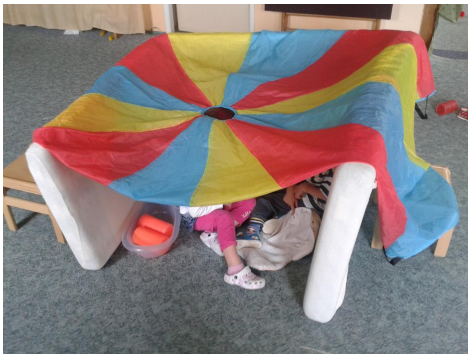
Jedna z „vedlejších“ činností - k dispozici děti měly plastové kostky, padák apod. Postavily dům pro kamarády.

Zvolit například jednu větší či náročnější činnost, u které je potřeba neustálá přítomnost učitelky a další doplňující, jednodušší, pro ty děti, které se v daný den nebudou chtít zapojit, i zde je třeba dohlížet, příp. se domluvit na pomoci personálu školky. Dle zkušeností – molitanové kostky, autodráha, hra v kuchyňce, lepopela.