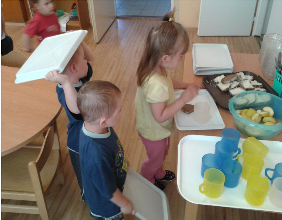
Děti při přípravě na ranní svačinu, březen 2014.

Pokud se jedná o hygienu a její udržování, zpočátku docházelo k nehodám velmi často i několikrát denně, jinak děti využívaly především nočníky, které jsme měli k dispozici. Zhruba třetina dětí si na polední spánek přinášela plenu, tak tomu bylo asi do konce pololetí. V utírání a mytí vyžadovaly pomoc téměř všichni.