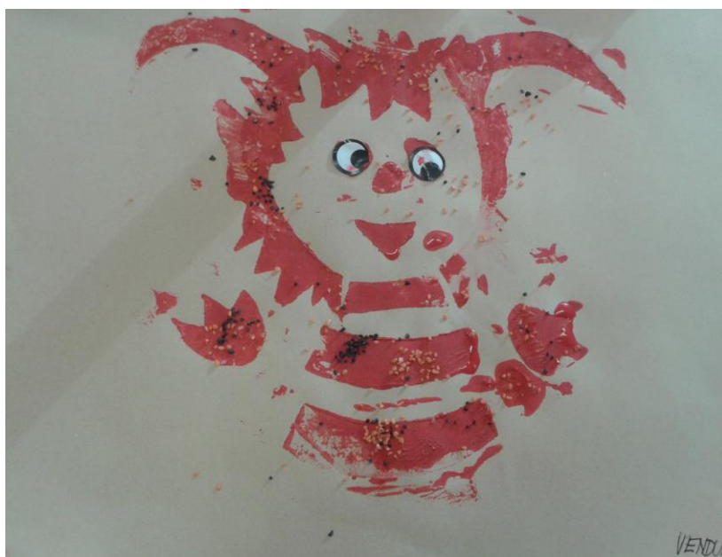
Děti měly volbu barvy tisku i papíru, dekorace čertů.