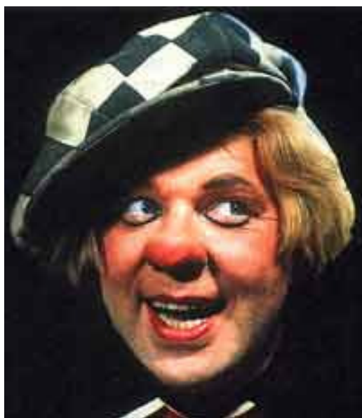
Obr. č. 8: Oleg Popov