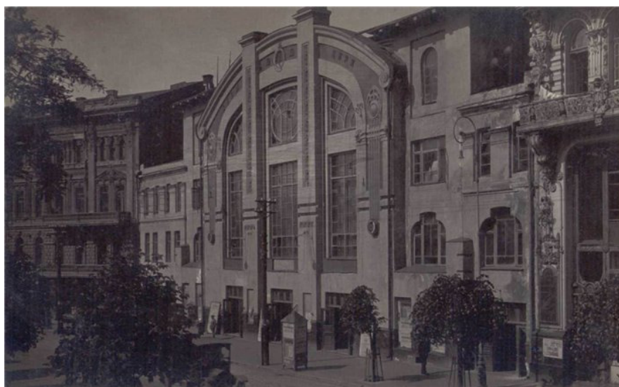
Obr. č. 6: Amatérský cirkus Petra Krutikovova