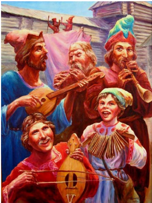
Obr. č. 1: Skomorocové a cirkusová zábava. Malba M. Ščrileva