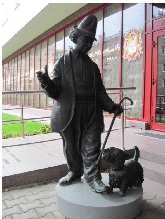
Obr. č. 7: Socha z bronzu „Karandaš a jeho pes Kaňka“