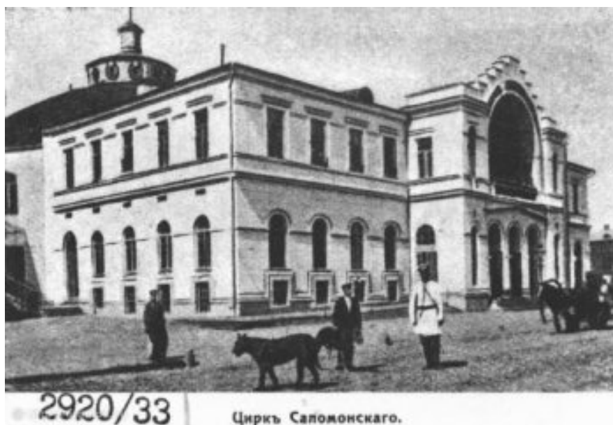
Obr.č. 5: Cirkus Alberta Salamonského