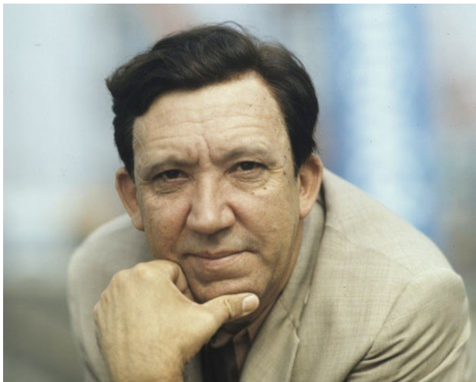
Obr. č. 9: Jurij Nikulin