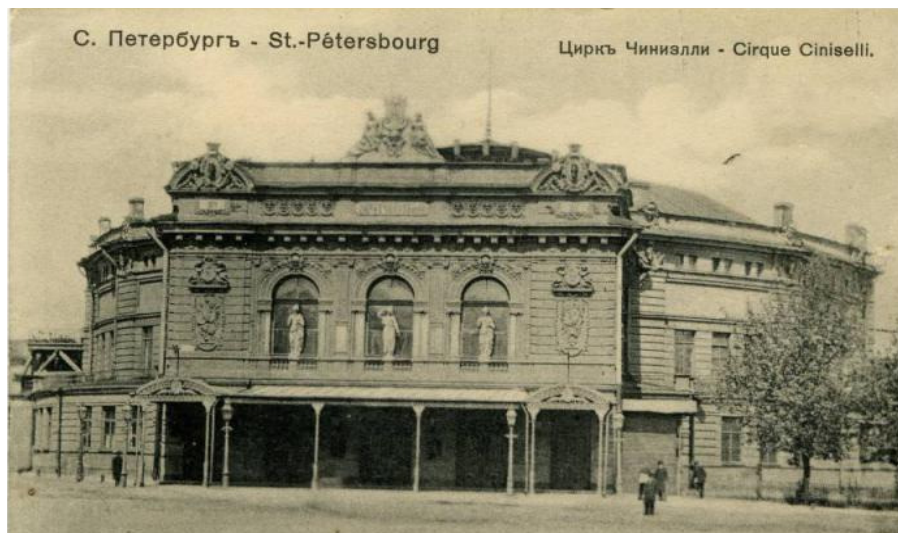
Obr. č. 4: Cirkus Gaetano Ciniselli