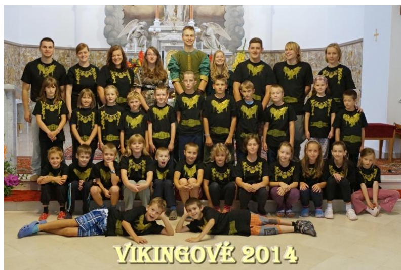
Příloha 5 – fotografie z farního tábora 2014 „Vikingové“