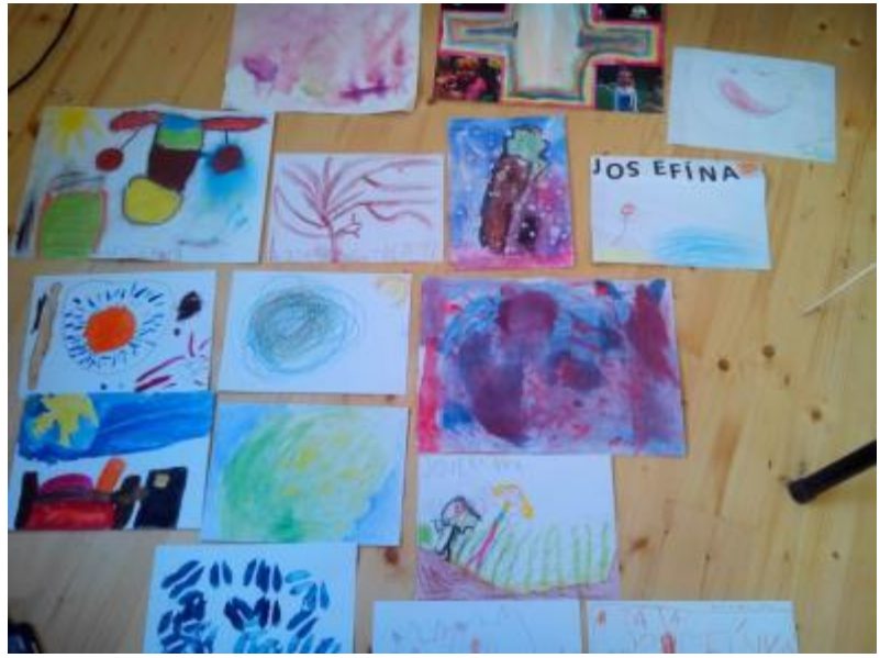
Obr. 5 Josefína