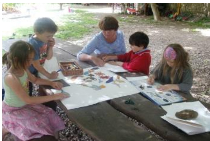
Obr. 17 Podmořský svět