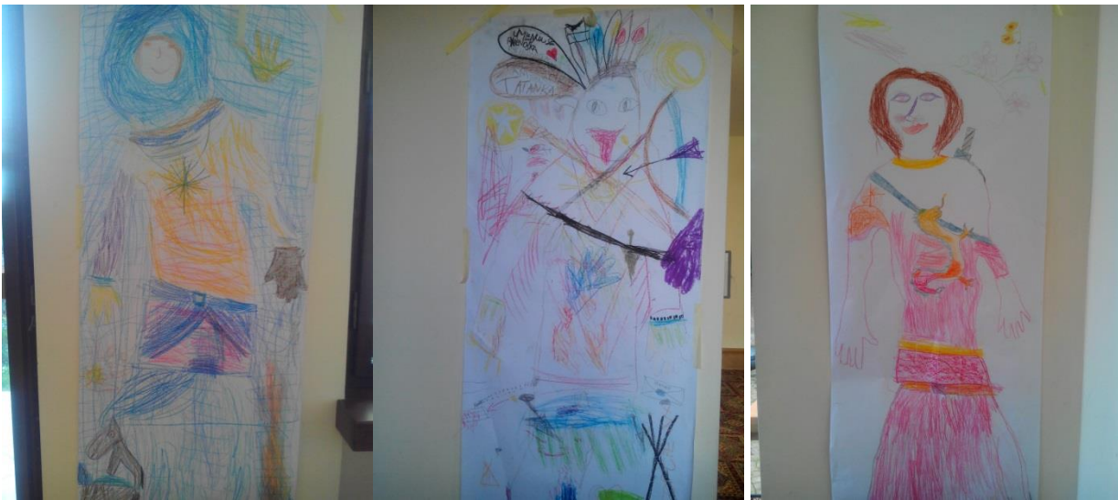
Obr.3: Téma Lidé jsou různí

K tomuto tématu souvisela práce na téma portrét. Malba akrylem na dřevěné destičky. Identifikace a sledování jak se vidí kamarád, vizuální metafora povahových rysů. Co máme společného a v čem jsme jiní? Můžeme spolu kamarádit? Související další práce byla ve formě malování ve dvou na čtvrtku akvarelovými barvami, potkávání barev. Modré a červené. Sledování jak děti umějí komunikovat a společně dotvořit jeden obrázek.