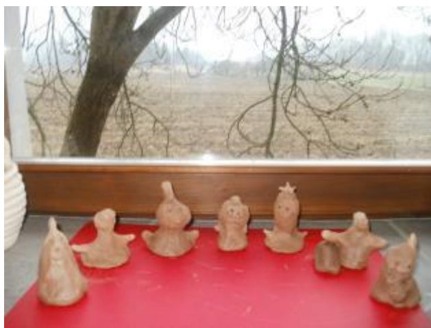
Obr. 13 Modelování z hlíny