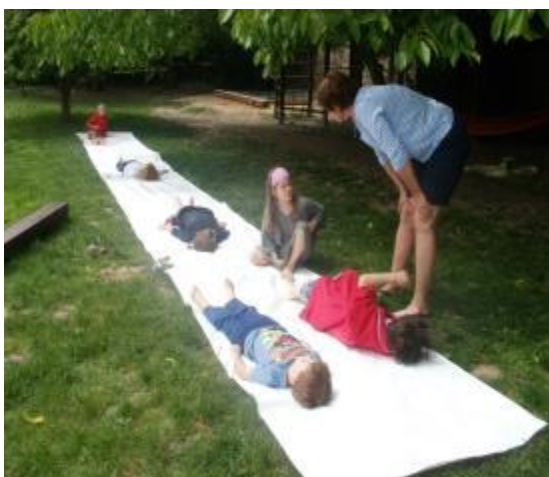
Obr. 16 Podmořský svět

Toto téma uzavírá výtvarný artefietický cyklus . Je možné sledovat určitou korespondenci s prvním tématem Vesmír. Děti se již nebojí použít barvy najít své místo, je možné, že se objekty budou již překrývat.