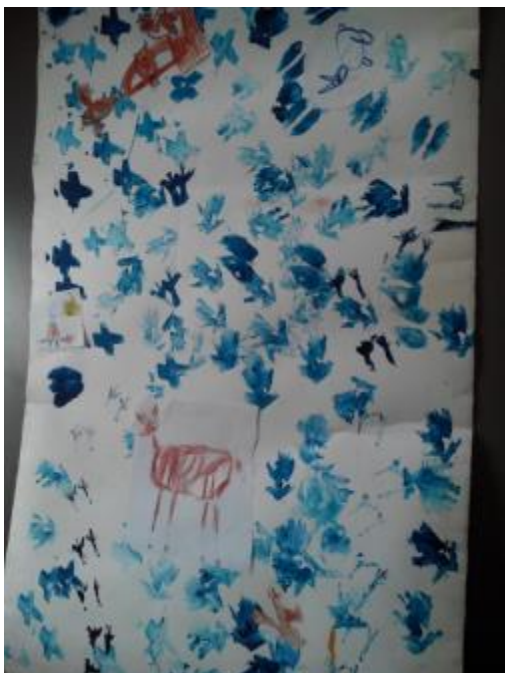
Obr. 8 Stopy ve sněhu

Video-záznam reflexe je k vidění v obrazové příloze