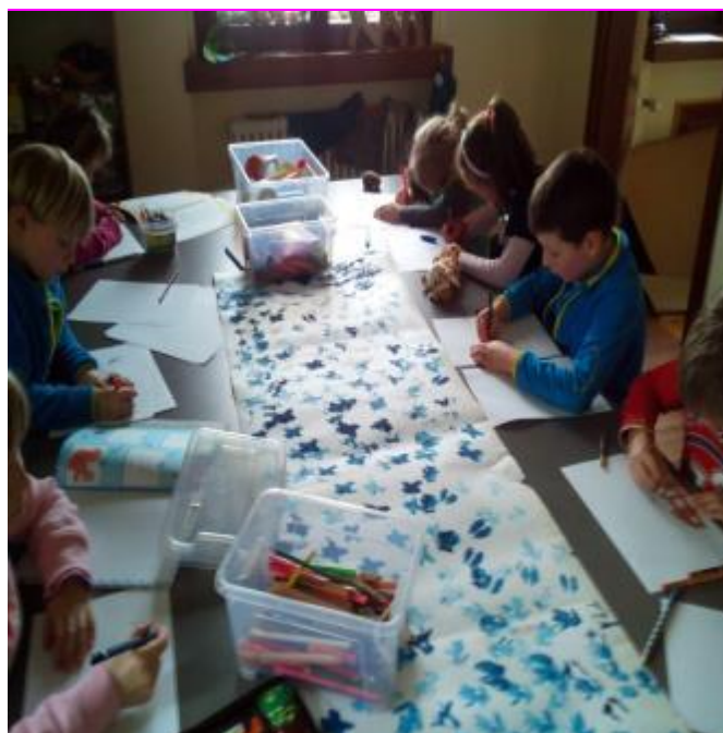
Obr. 9 Stopy ve sněhu