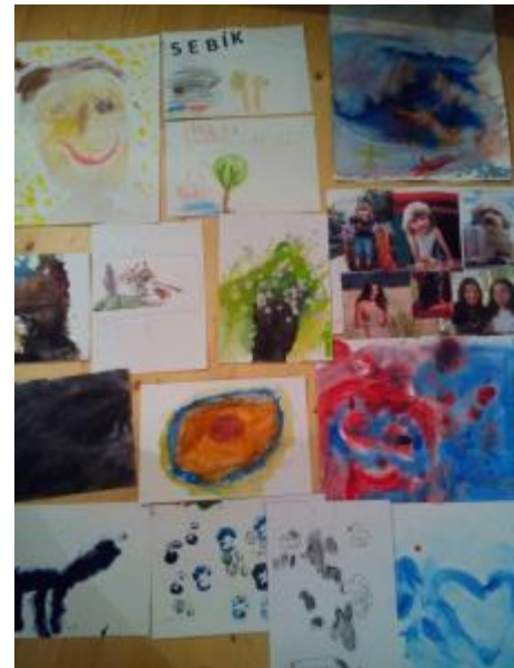
Obr. 7 Sebastian