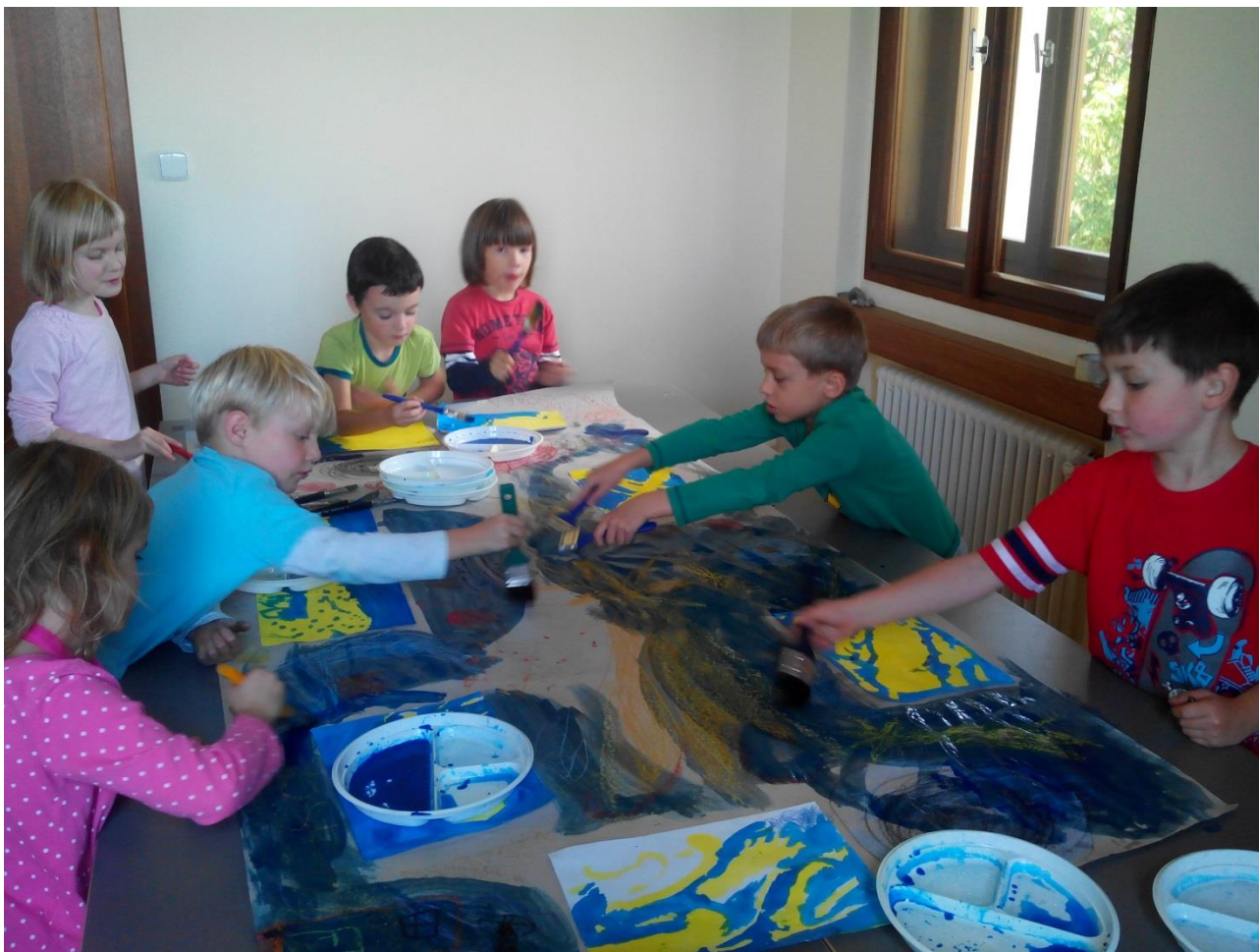
Obr.1: Téma Vesmír