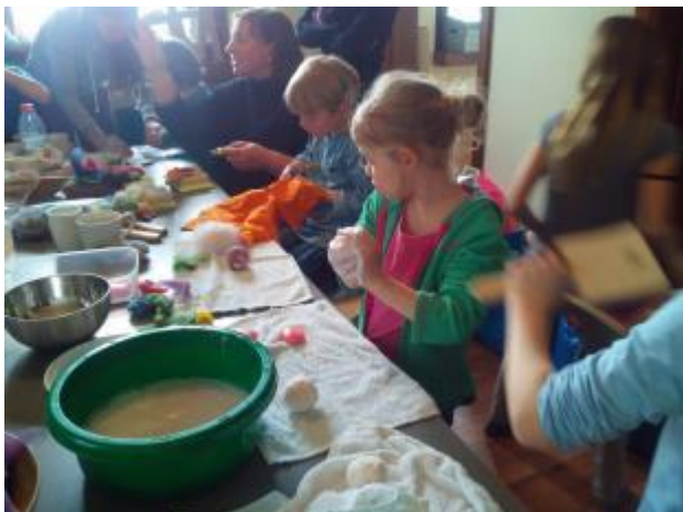
Obr. 10 Práce s vlnou