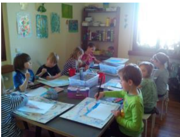
Obr. 14 Jarní květy

Jak se nám tvořilo? Jak to, že nám vznikla zelená? Jak klíčí semínko, nebo jarní cibulka? Akvarel do mokrého se hodí pro práci s barvou, aby se rozpíjela a děti mohly volně barvy propojovat bez kontur. Barevné míchání je dobré pro nauku jak barvy vznikají. Hra s barvou nese uvolnění emocí. Poznávací rozsah je v pojmenovávání jarních druhů květeny a nauka o systému klíčení.