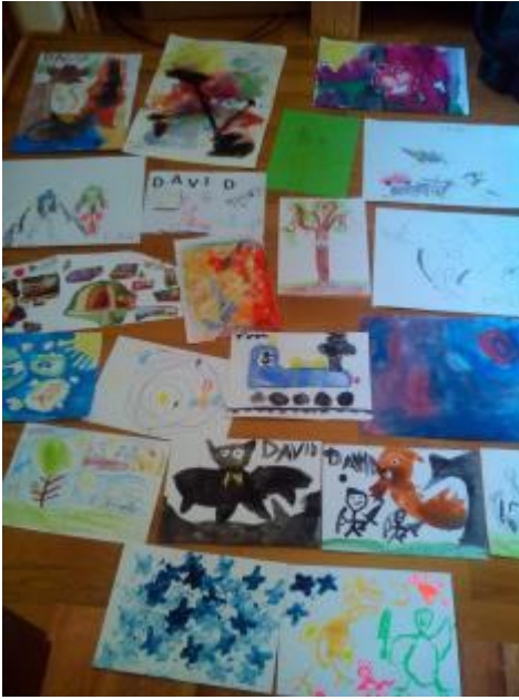
Obr. 4 David