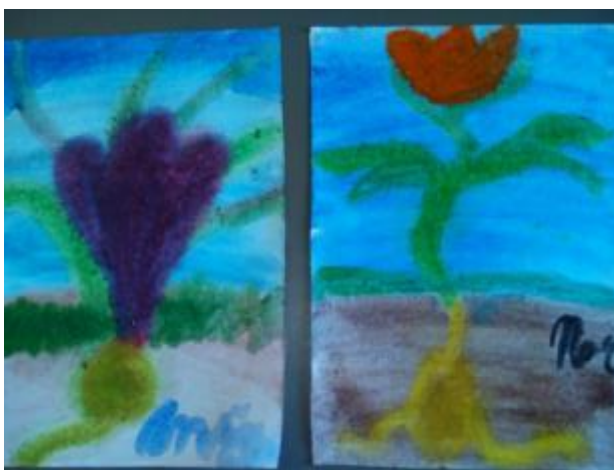
Obr. 15 Jarní květy