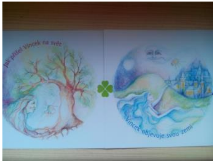
Obr. 18 Asociativní test (Krátka, P., S. : Pohrádky. Elmavia, 2015.str.1,2.)