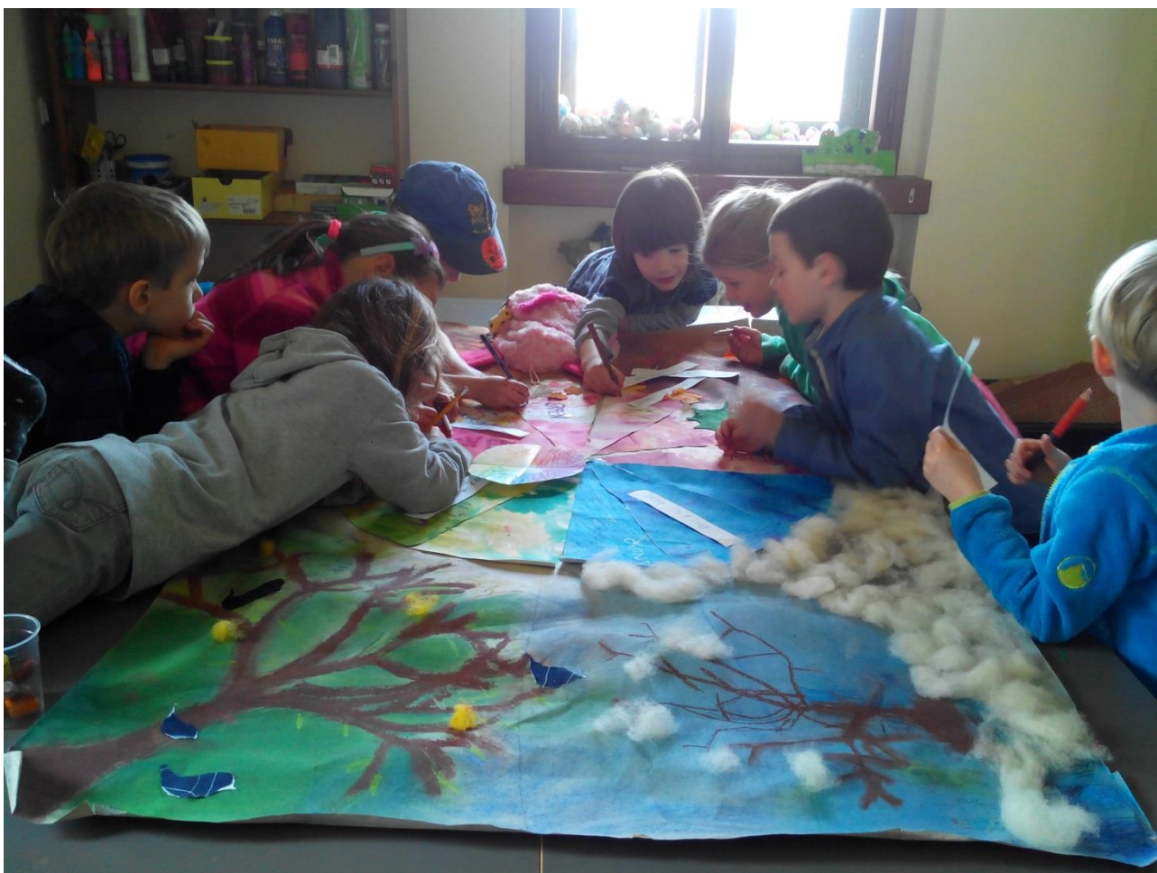
Obr.2: Téma Roční období

Děti dobře spolupracovaly a kdo byl ukvapený trénoval svou trpělivost. Velmi mě překvapilo jak se děti dokáží již vzájemně korigovat, upřesňovat a hlavně si pomáhat.