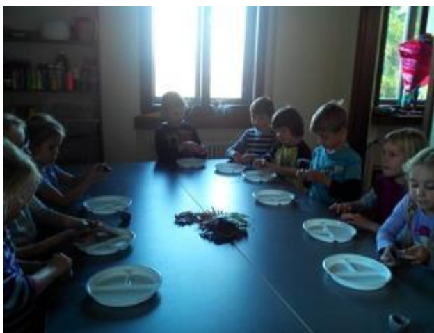
Obr. 12 Modelování z hlíny

popovídáme o tom jak se nám tvořilo a co vzniklo.