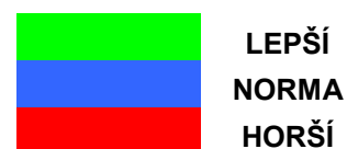
Tab. 12: Výsledky z dotazníku Naše třída, první šetření