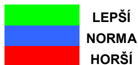
Tab. 13: Výsledky z dotazníku Naše třída, druhé šetření