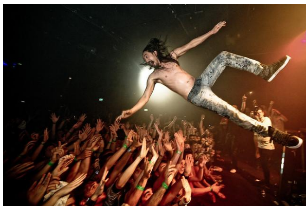
Obr. 6: Davové tance - Stage-diving