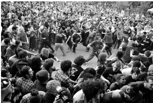
Obr. 4: Davové tance - Mosh-pit