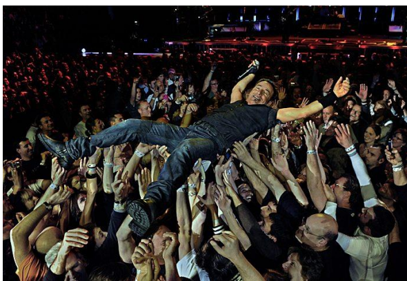
Obr. 5: Davové tance - Crowd-surfing