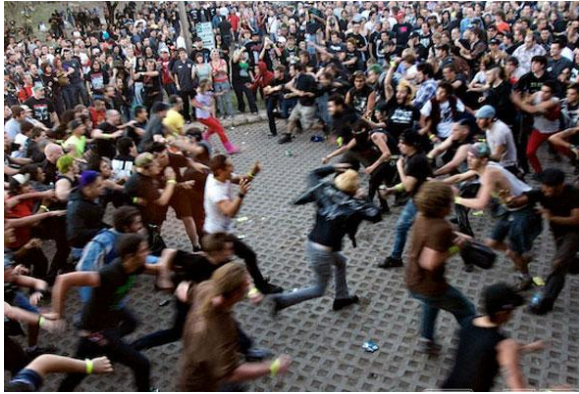
Obr. 3: Davové tance - Wall of death