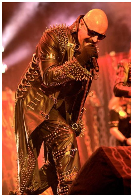
Obr. 1: Rob Halford a jeho typická image