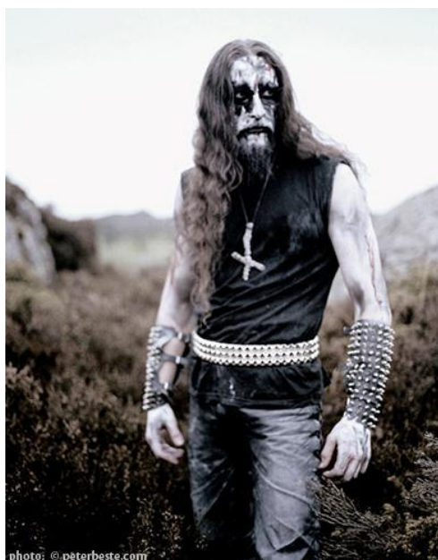
Obr. 2: Typický vzhled hudebníků a fanoušků black metalu