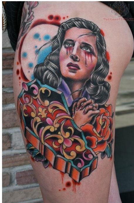
Obr. č 5

Rakev je jasná symbolika smrti, která má v kultuře obrovský význam. Je potřeba ale nebrat smrt jako konec, jako něco tragického, ale jako součást života, či dokonce další začátek. Každý totiž jednou skončíme právě na stejném místě - v rakvi. (HELIOS, 2015).