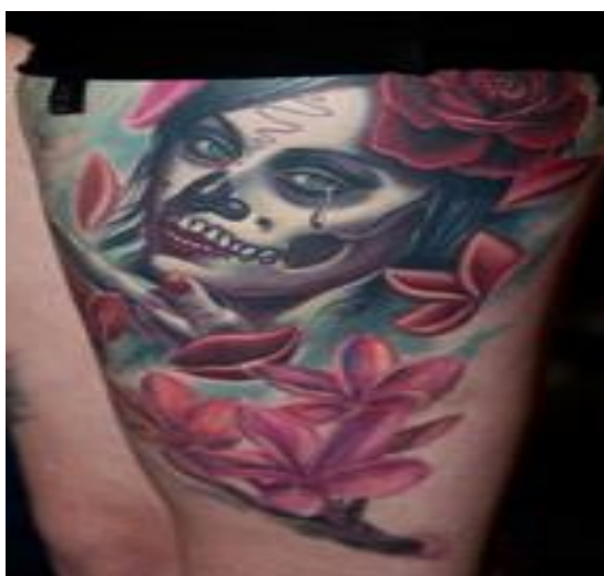
Obr. č. 3

V překladu název znamená slávu smrti, tedy oslavujme smrt, veselme se a opěvujme naše předky, kteří již nežijí (KŘÍŽ, 2012).