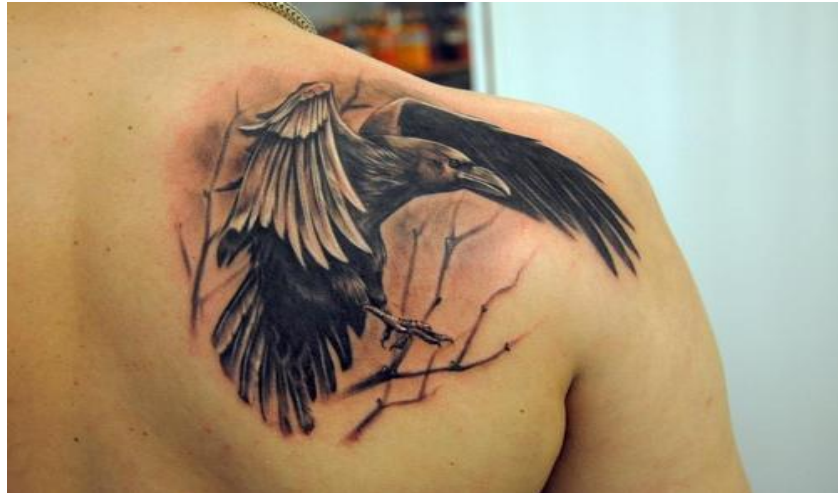
Obr. č 6

Ve starověku byl havran symbolem světla a světelných bohů. Jeho smysly, dokonalý instinkt, dlouhověkost a také jednoduchost, s jakou se dá havran osvojit, z něj udělaly posla bohů. Havran představuje posla mezi světem živých a světem mrtvých (HELIOS, 2015).