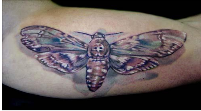
Obr. č 4

zdroj: http://marsyhorakova.blogspot.cz/search/label/Tattoo