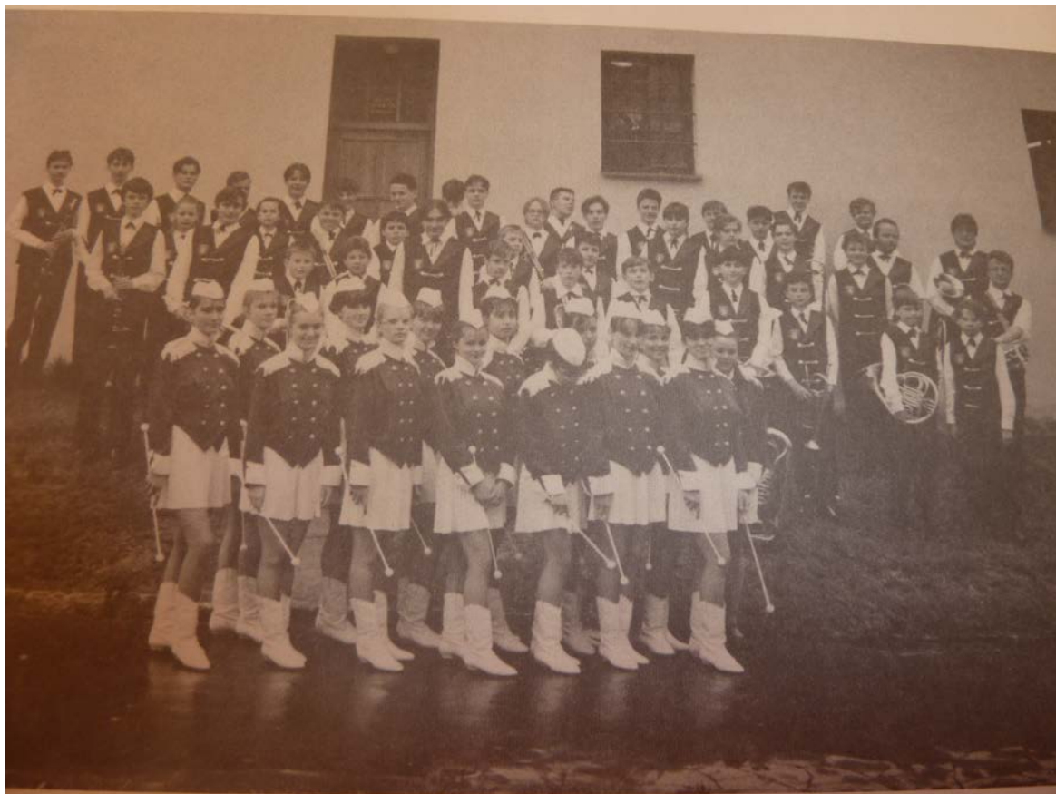
Dechový soubor a mažoretky. 1994

KLÍMOVÁ L., 70 let české hudební školy v Prachaticích. 1996. Základní umělecká škola Prachatic. Foto. Dechový soubor a mažoretky. 1994.