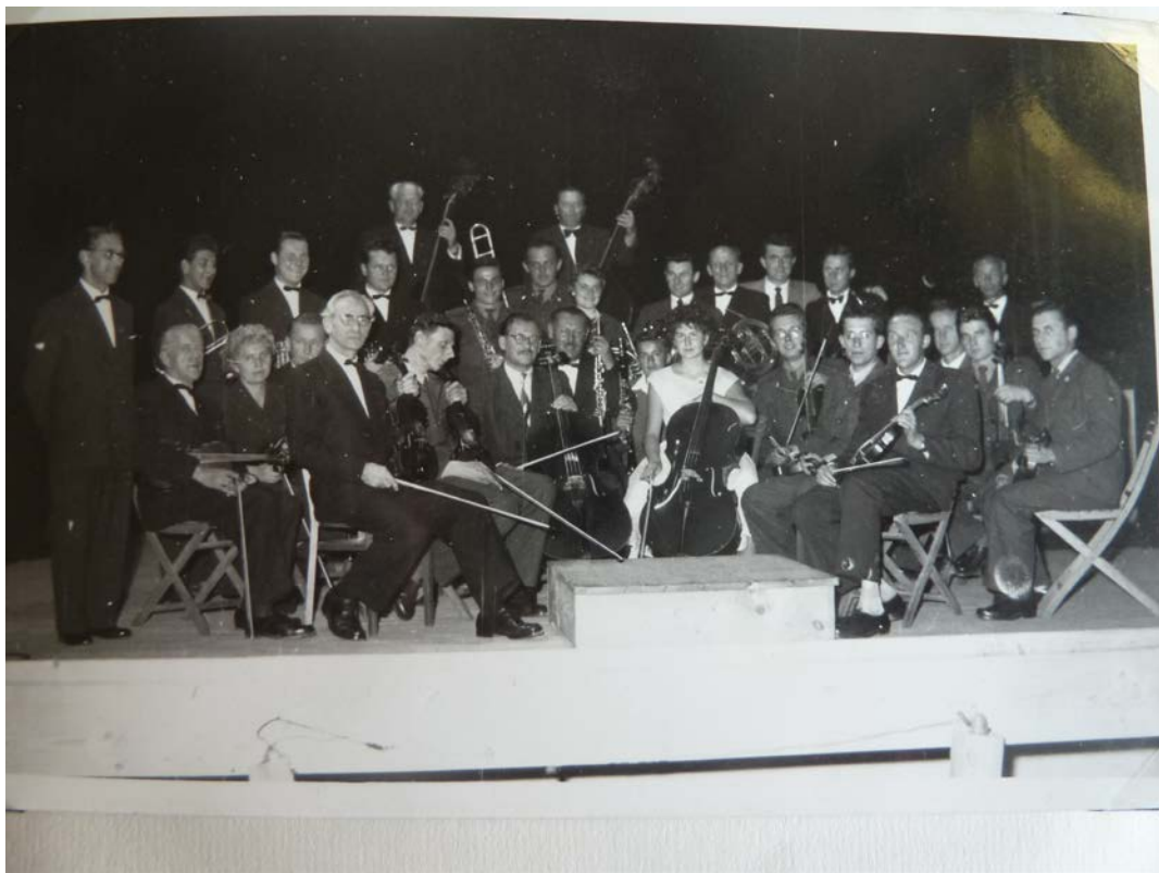
Orchestrální sdružení města (OSMP), 1959.

ZUŠ Prachatice. Kronika 1958-2005. Inv. č. DKP A/213. Prachatice. Foto Orchestrální sdružení města 1959.