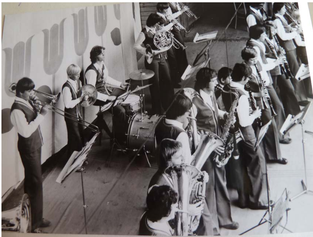
Dechový soubor Podstrážanka -vystoupení na výstavě „Země živitelka“. 1973-1979.

ZUŠ Prachatice. Kronika 1958-2005. Inv. č. DKP A/213. Prachatice. Foto. Dechový soubor Podstrážanka-vystoupení na výstavě „Země živitelka“.1973-1979.