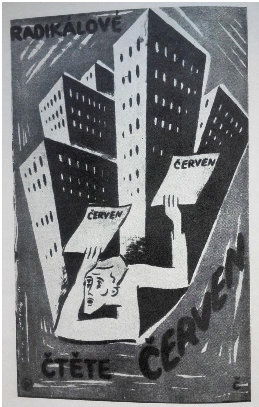
(Zdroj: LANG, Jaromír. Neumannův Červen . Praha: Orbis, 1957, s. 2)