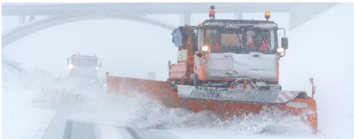
Příloha č. 4: Odklizení sněhu vozidly silniční služby v Bavorsku

Zdroj: https://www.stmi.bayern.de/vum/strasse/betriebsundwinterdienst/index.php .