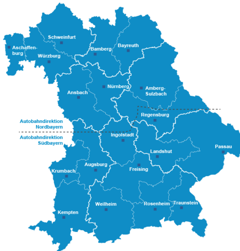
Obrázek č. 3: Zemské stavební úřady