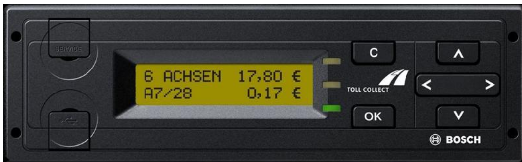
Obrázek č. 6: Toll Collect box na kontrolu o zaplacení mýtného poplatku