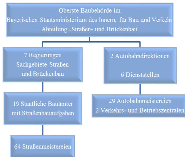
Schéma č. 1: Organizace a struktura bavorské správy silnic

V následující kapitole se budeme věnovat jednotlivým organizačním úrovním veřejné správy ve Svobodném státu Bavorsku v intencích pravomocí a působnosti v oblasti dopravní infrastruktury a dopravní problematiky jako takové. Představíme jednotlivé instituce, které figurují ve správní struktuře. Definujeme jejich oblasti působnosti a organizační strukturu.