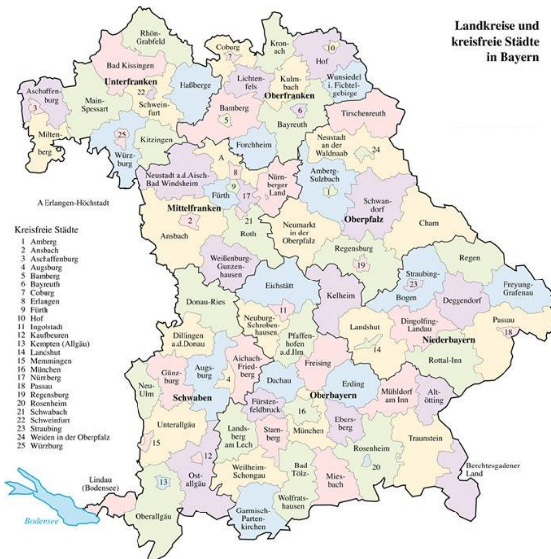
Obrázek č. 7: Okresy a města se statutem okresu po územní reformě