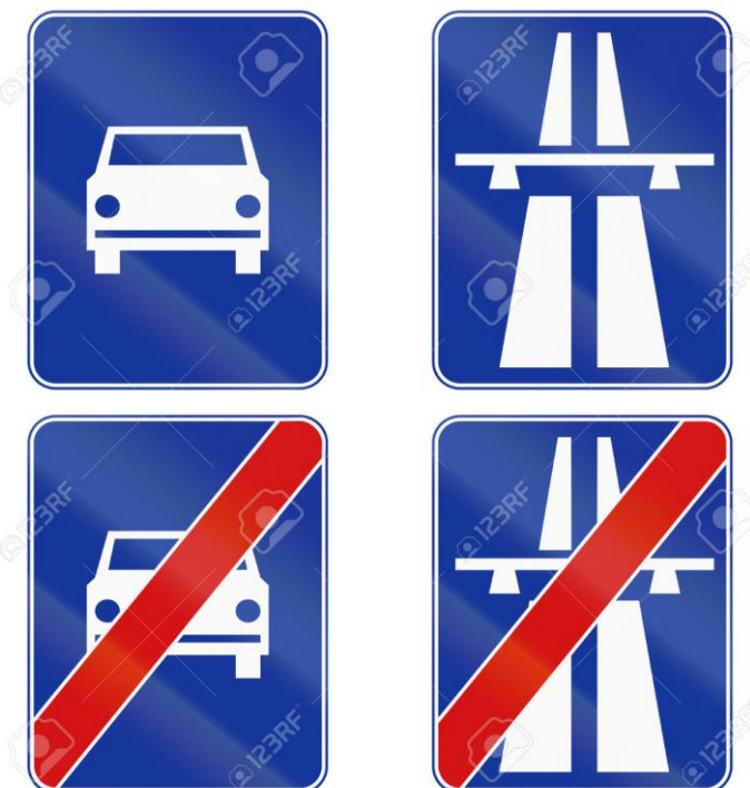
Obrázek č. 5: Dopravní značení začátku rychlostní komunikace a spolkové dálnice a jejich konec