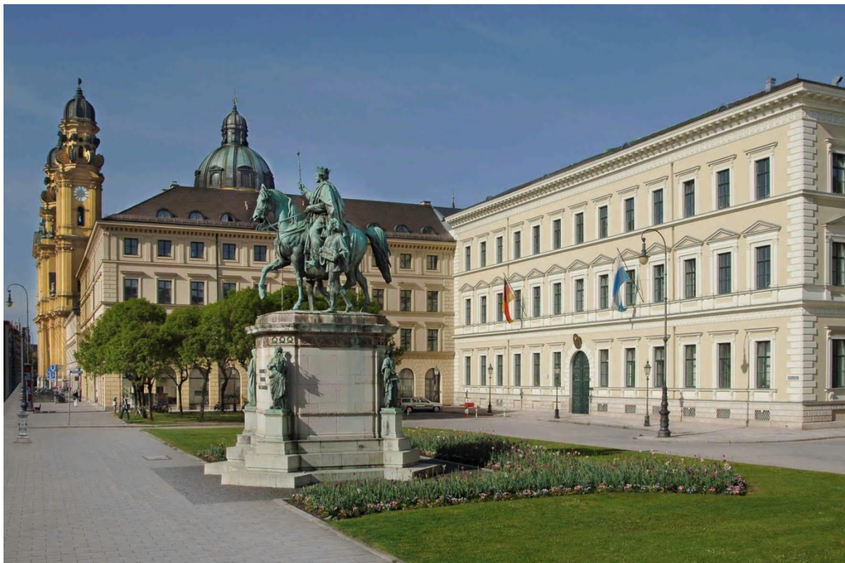
Příloha č. 3: Budova Bavorského státního ministerstva vnitra pro výstavbu a dopravu