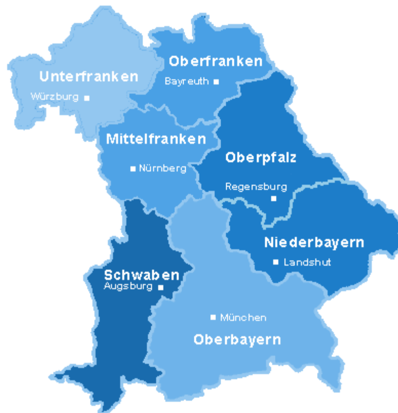
Obrázek č. 2: Vládní oblasti Bavorska