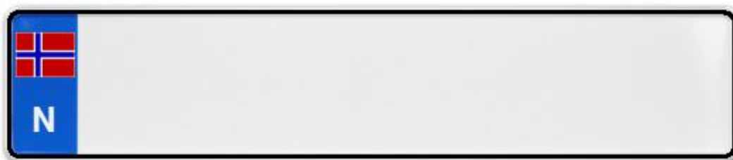
Obrázek č. 8: Evropská registrační značka tureckého vozidla