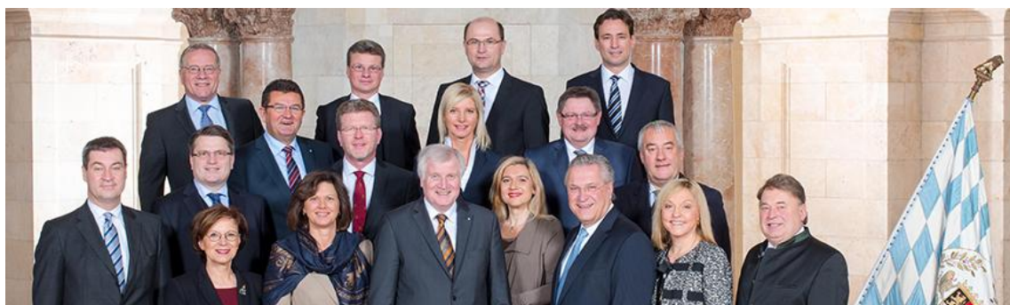
Obrázek č. 1: Bavorská vláda