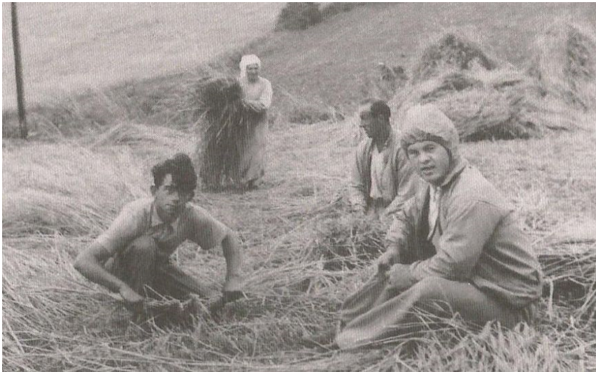
Sestřičky s klienty při sklizni obilí