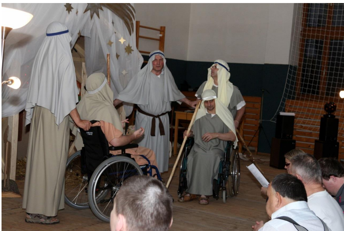
Vánoční představení v tělocvičně Domova