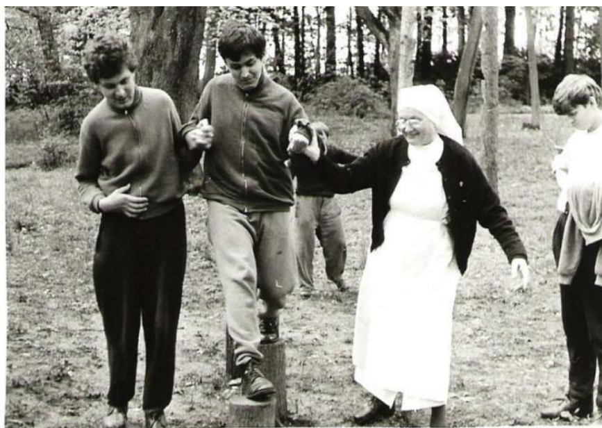
Klienti při hrách v parku