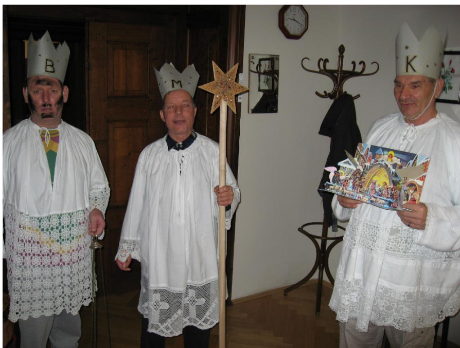
Klienti při tříkrálové koledě