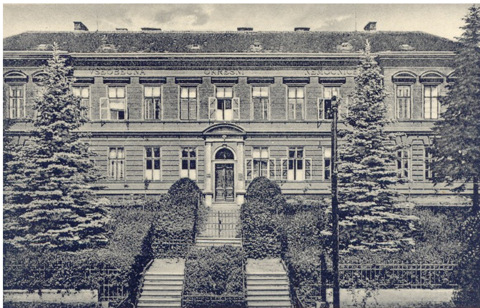
STRAKONICE. Všeobecná veřejná nemocnice.