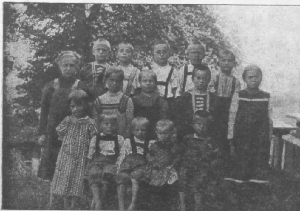
Přírůstek našeho útulku v Červených Dvorcích v roce 1914.

Zvědavě se zástup četný nad robátkem ihned kloni — dechem svým je zahřívají, ba i slzy mnohý roní . . .