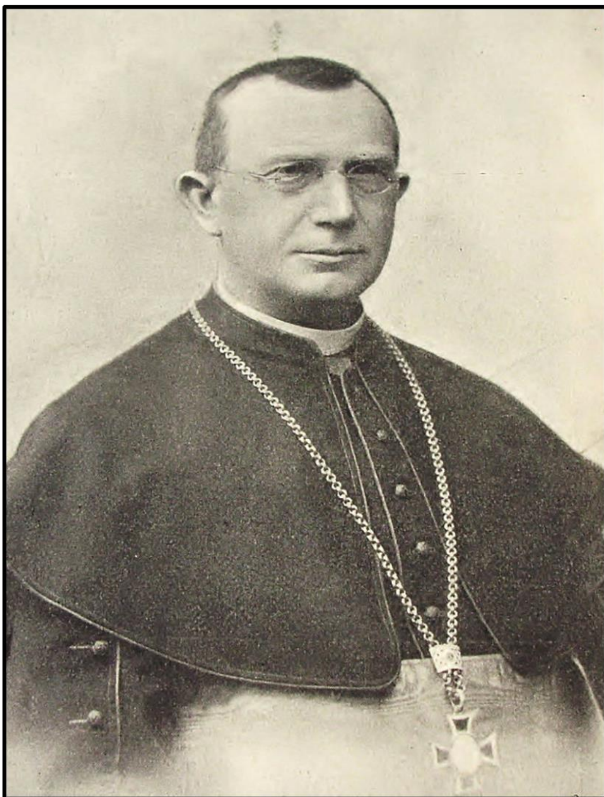
Příloha č. 4: Josef Antonín Hůlka, českobudějovický biskup 305