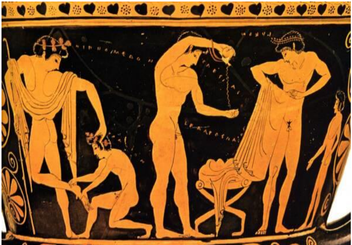
Příloha V. – Mladíci v palaistře po cvičení. Jednomu ošetřuje chlapec poraněné chodidlo, druhý si nalévá z nádoby olej na dlaň, aby si ho rozetřel po celém těle, třetí se chystá obléknout si oděv, který mu podal vedle stojící chlapec. Malba na červenofigurovém kráteru od malíře Eufronia, Athény, kolem roku 510 př. n. l. (Srov. OLIVOVÁ, Věra. Sport a hry ve starověkém světě ; s. 104.)