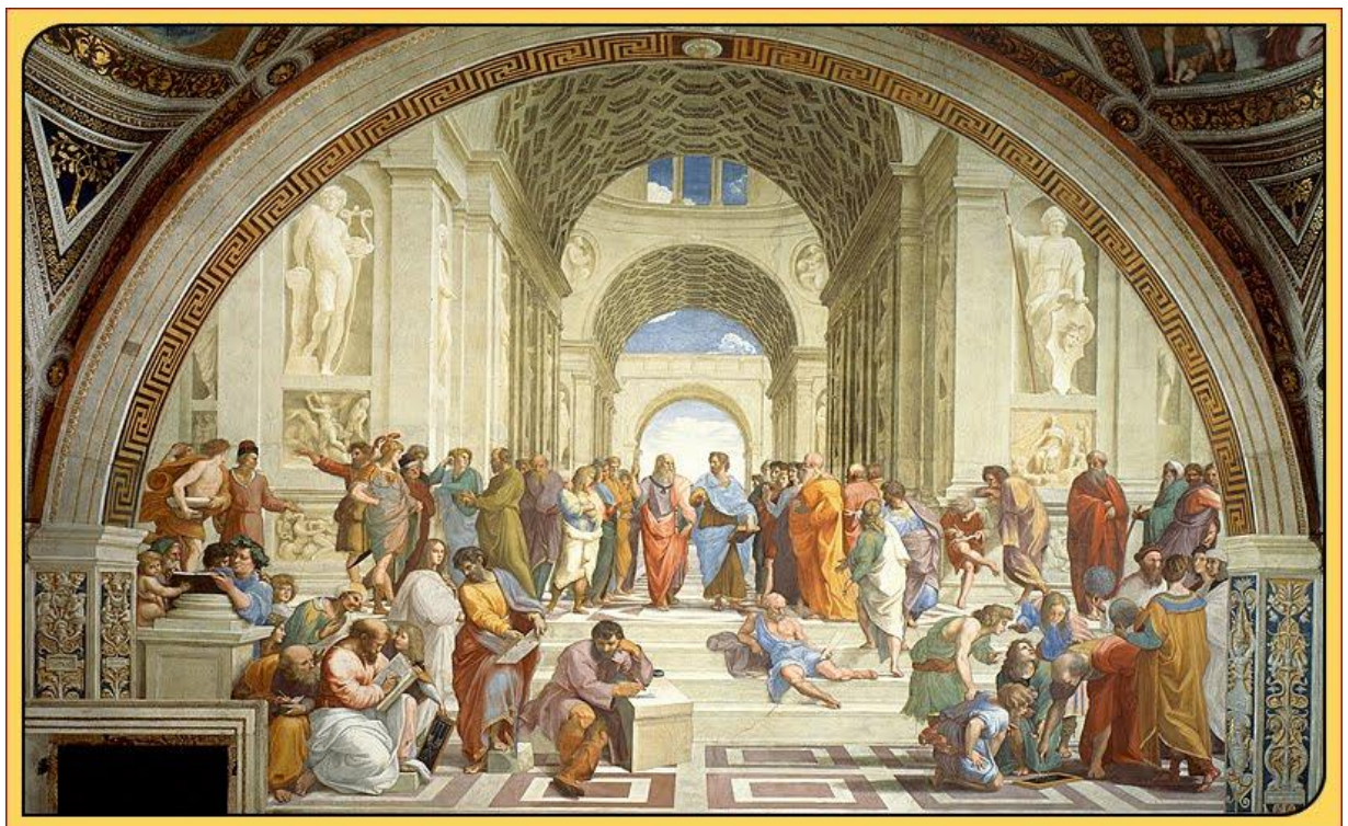
Příloha IV. - Dílo Athénská škola od italského umělce období vrcholné renesance Rafaela Santiho. Uprostřed po levé straně je vyobrazen filosof Platón, vedle něho po pravé straně se pak nachází jeho žák Aristotelés. Nalevo od Platóna je pak v zelenohnědoběžovém hábitu filosof Sókratés.