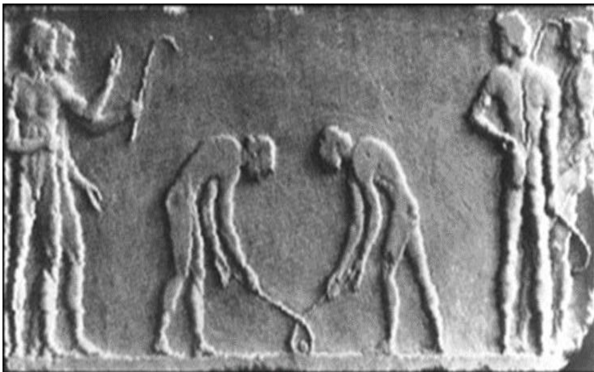
Příloha I. - Dvě skupiny mladíků hrají míčovou hru se zahnutými holemi. Reliéf na Themistokleově zdi, Athény, kolem 510 př. n. l. Jedná se o patrně nejznámější doklad dávného původu pozemního hokeje, z něhož pravděpodobně vznikl i hokej lední. Tento reliéf byl objeven roku 1922. (Srov. OLIVOVÁ, Věra. Sport a hry ve starověkém světě ; s. 109.; http://www.rscpraha.cz/?page_id=652 )