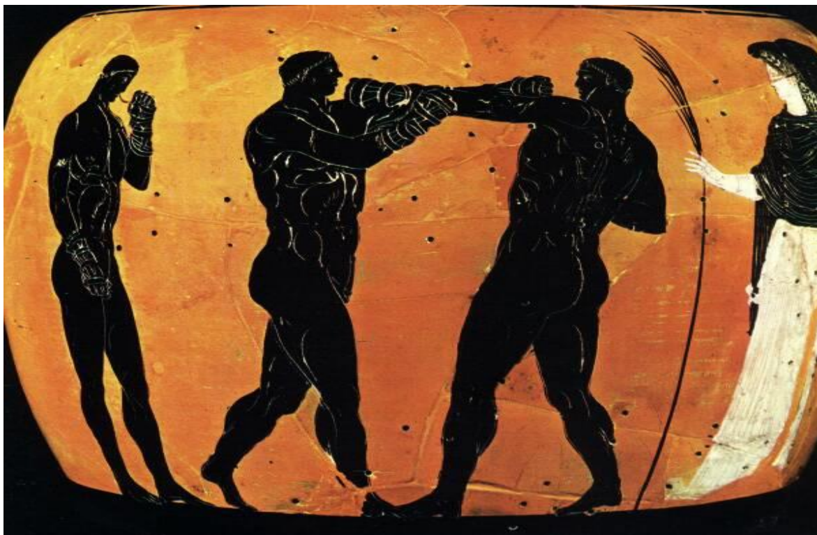
Příloha VIII. – Malba na panathénajské amfoře přibližně z roku 366 př. n. l., na které je zachycen zápas boxerů. Oba atleti mají ruce až k předloktí ovázané řemínky s výztužemi kolem prstů. (Srov. OLIVOVÁ, Věra. Sport a hry ve starověkém světě ; s. 139.)