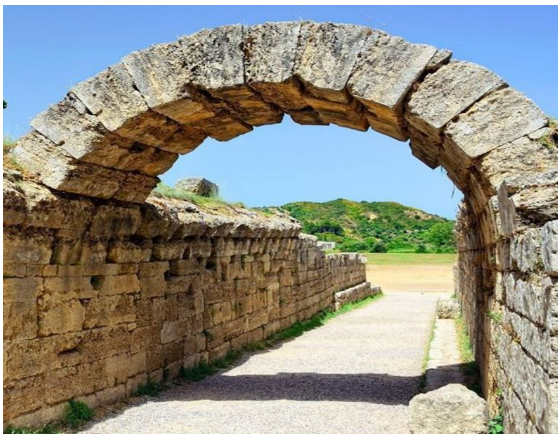
Příloha II. - Vstupní brána v Olympii, již vcházeli olympijští závodníci na stadión. (Srov. OLIVOVÁ, Věra. Sport a hry ve starověkém světě ; s. 111.)