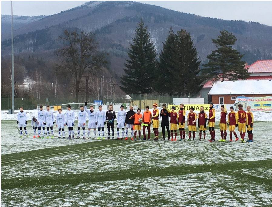
Obr. 1 Hráči s rozhodčími