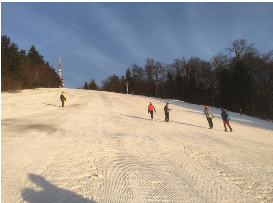
Obr. 2 Výšlap na horu Radhošť