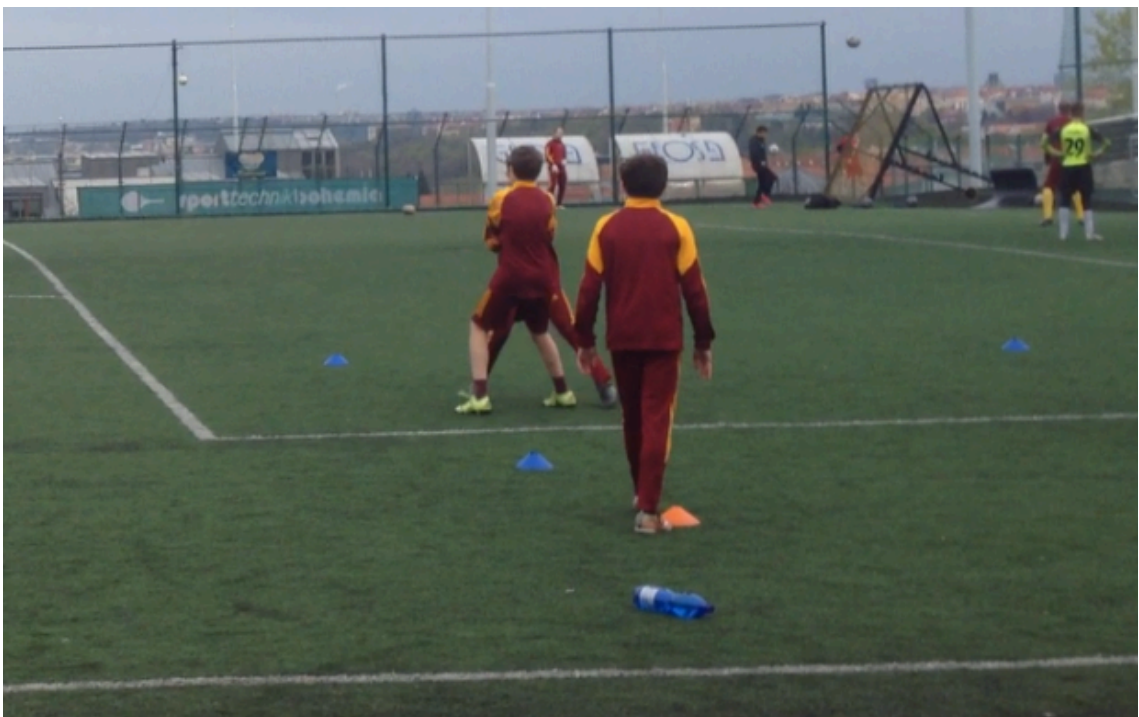
Obr. 4 Zápasnický souboj