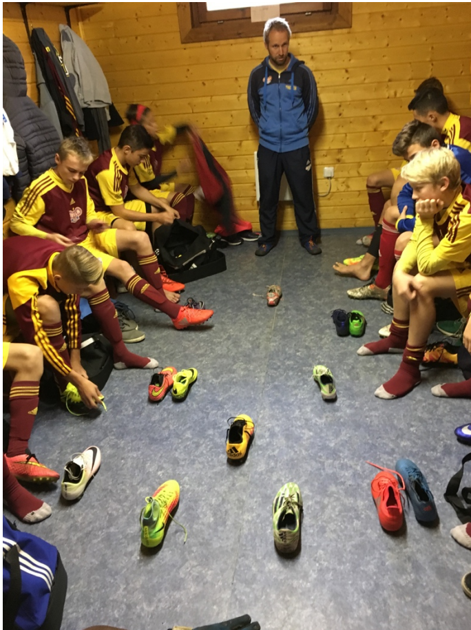
Obr. 3 Předzápasová porada – zaměření pozornosti na pressing