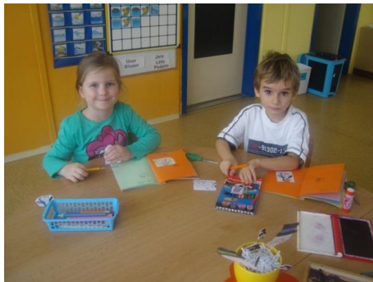
Příloha II. Lepení odměn