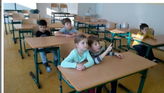
Příloha IV. Návštěva základní školy