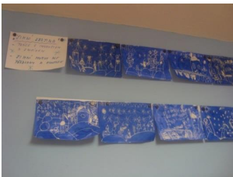
Příloha XVII. Zimní krajina