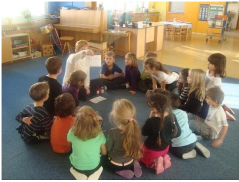
Příloha XIII. Najdi pět rozdílů 1