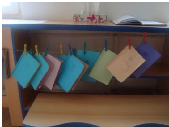
Příloha I. Notýsky v šatně MŠ