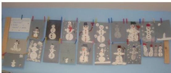
Příloha XI. Rodinný sněhulák