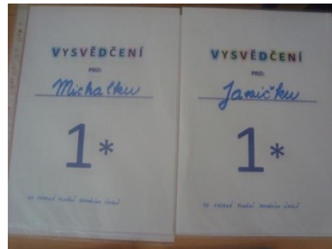
Příloha XVIII. Vysvědčení