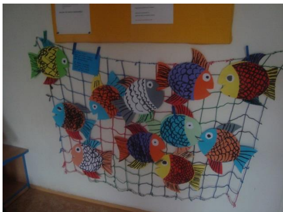
Příloha III. Výroba rybiček z papíru