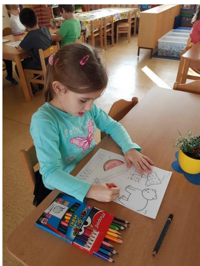
Příloha IX. Geometrické tvary- Zima