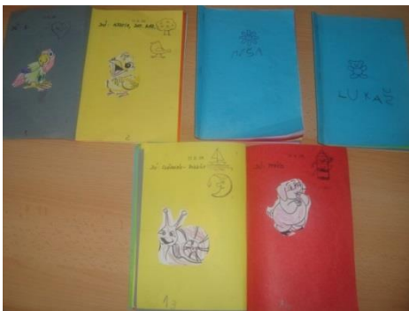
Příloha XIX. Notýsky