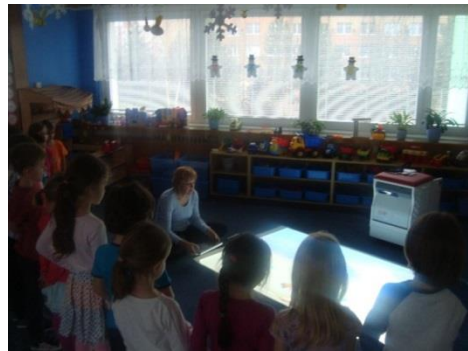
Příloha XVI. Hra s „Magic box“