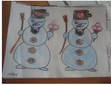
Příloha XIV. Najdi pět rozdílů 2