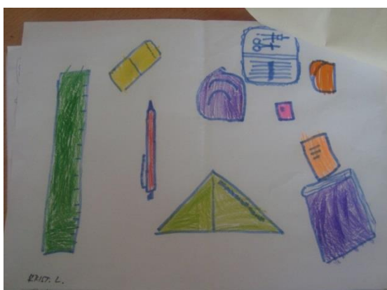
Příloha V. Školák a jeho pomůcky