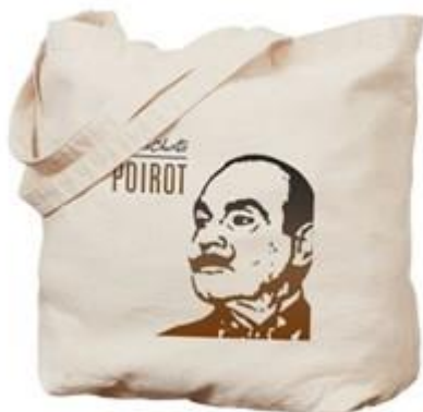
Příloha 1 – plátěná taška s motivem Hercula Poirota