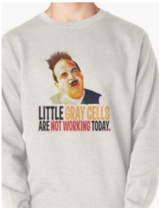
Příloha 2 – mikina s motivem Hercula Poirota a s nápisem Mé malé šedé buňky dnes nepracují

Dostupné z http://www.cafepress.co.uk/+hercule_poirot_tote_bag,1585446441