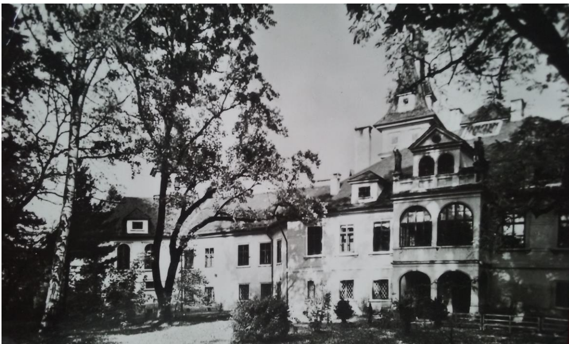
Obr. 12 Zámek Lužany