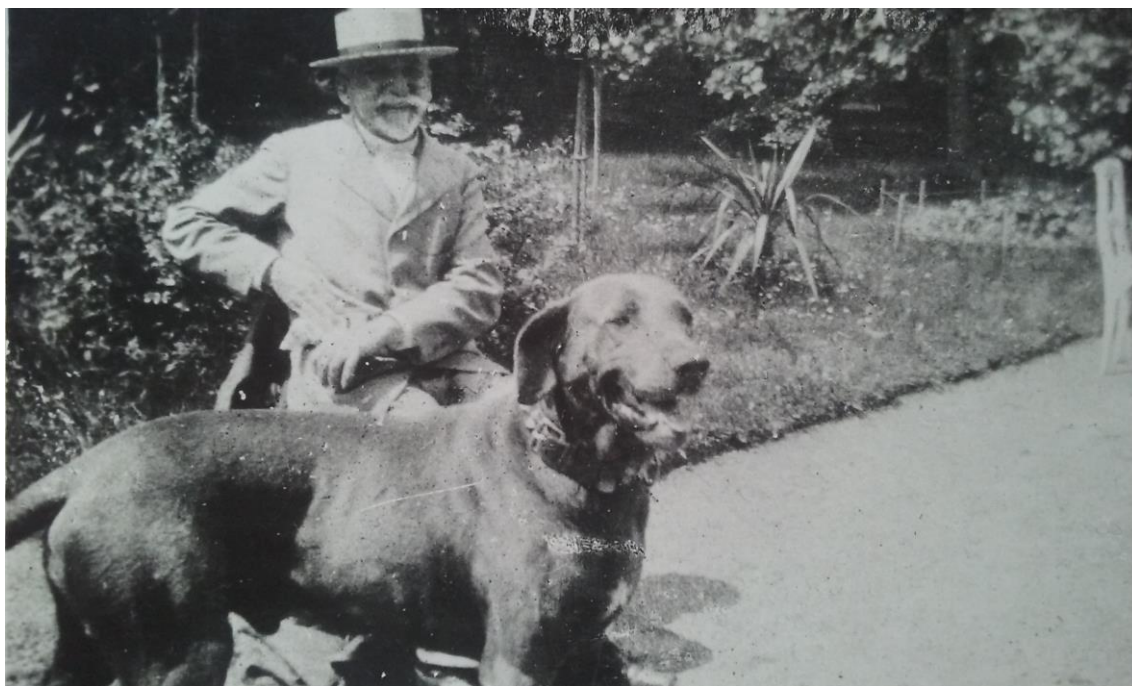
Obr. 8 Julius Zeyer