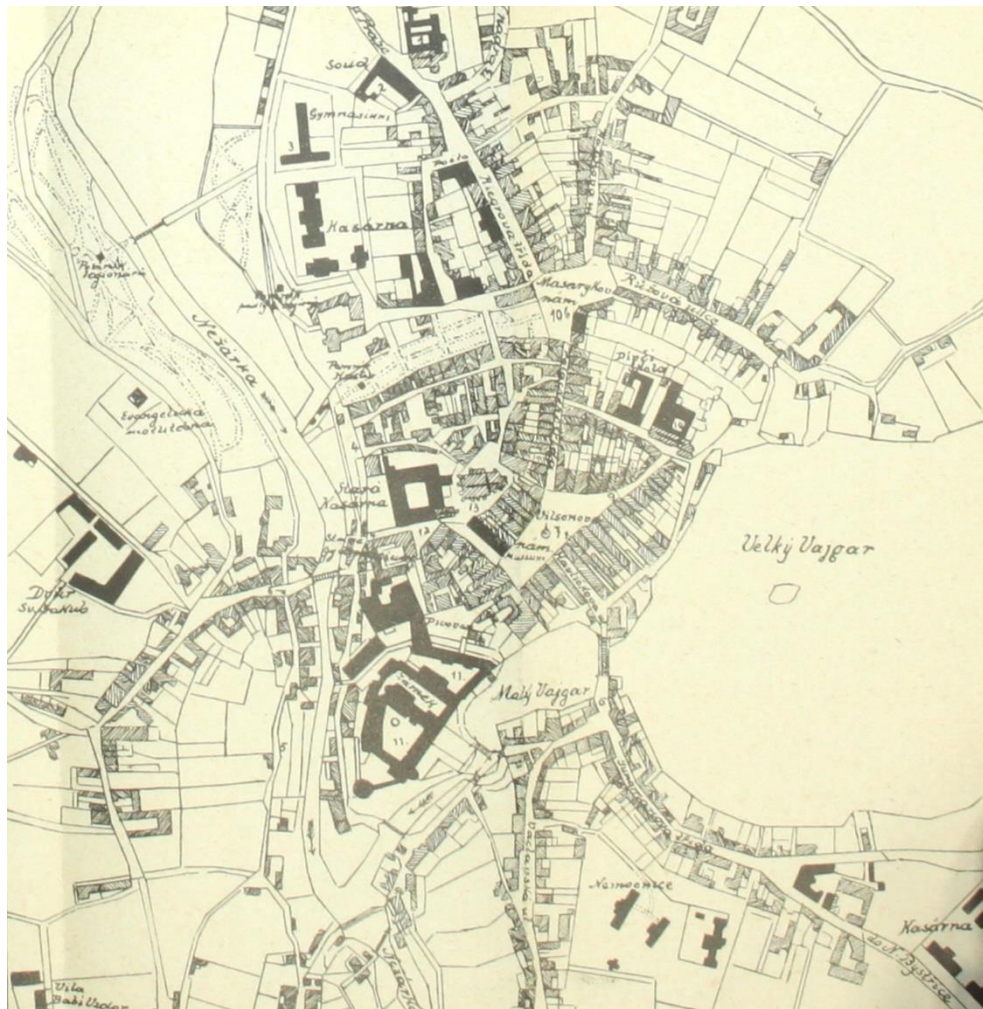
Příloha č. 1: Mapa města otištěná v průvodci Jindřichův Hradec a jeho okolí .