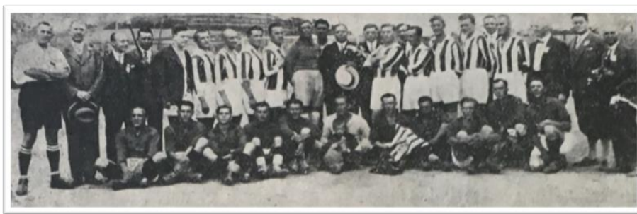
Obrázek 35. Mužstvo Viktorie a Modřan před přátelským utkáním. Fotografie převzata z periodika Sportovec 8.8. 1929, č. 32.