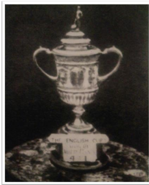
Obrázek 4. Původní trofej Anglického poháru, o níž se hrálo od ročníku 1871–1872.

28. února 1870 byl sehrán první mezinárodní zápas, kdy se utkala Anglie se Skotskem. Ani jedno mužstvo nedokázalo vstřelit branku a zápas tedy skončil 0:0. V roce 1871 vznikla nejstarší pohárová soutěž – Anglický pohár (F.A. Cup) za účasti 50 klubů. Vítězem se stal tým Wanderers.