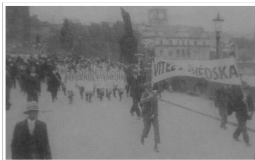
Obrázek 31. Uvítání Viktorie v roce 1928 po návratu ze Švédska (Žižkováci museli uspořádat průvod Prahou).

Také v roce 1928 opakovala Viktoria svůj zájezd do severských států. Vzdálenosti měst, ve kterých se předvedla, byly ohromné. Cesta z jednoho místa trvala celý den a každý druhý den byl sehrán zápas. Nejprve hrála v Norsku a porazila FC Sarpsborg 4:1, FC Rjukan 7:0, tehdejšího mistra Norska Odd Skien 5:1. Pak nastoupila proti mistru skotské II. ligy Ayr United a remízovala 2:2. Dále porazila norské týmy FC Aalesund 2:1, Viking Stavanger 2:1 a remízovala s FC Aalesund 1:1. 151