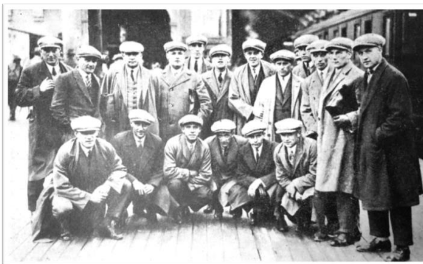
Obrázek 30. Mužstvo Viktorie poprvé na půdě Norska.

V letním období Viktoria uspořádala velký zájezd do Skandinávie. Turné začalo v Norsku, kde se hrály tři zápasy. V prvním Viktoria porazila kombinované mužstvo města Oslo 5:2, poté remízovala s Drammenem 2:2. Nakonec zvítězila s reprezentačním mužstvem Norska 3:2.