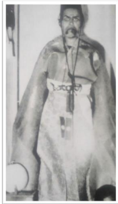
Obrázek 1. Socha čínského fotbalisty z roku asi 600 př. n. l. Fotografie převzata z knihy Procházka, K. (1984). Fotbal to je hra . Praha: Olympia, s. 46.

První zprávy o míčových hrách pocházejí ze 3. tisíciletí před naším letopočtem z Číny. Za vlády císaře Huang Ti vznikla hra císařských vojáků, kterou pojmenovali Tsuh-küh. Přesná pravidla se nedochovala, ale soudobé kresby napovídají, že už tenkrát se hrálo na čtvercovém neohraničeném prostoru, kde byly do země zapíchnuty čtyři silné bambusové tyče a jako míč se používala kožená koule vyztužená vlasy a ptačími pery. Hráči mohli hrát rukama i nohama. 13