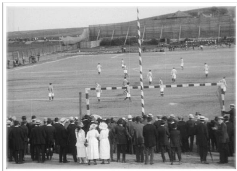
Obrázek 10. Pohled na původní hřiště Viktorie Žižkov na Ohradě.

Sezona 1909 byla sice poznamenána výstavbou nového hřiště, i tak se ale Viktoria zúčastnila turnaje o Stříbrný věnec Slávie. V prvním utkání hráli Žižkovští bez branek s ČAFC Vinohrady. Achillovou patou mužstva byla střelba. Viktoria byla lepším mužstvem a losem nakonec postoupila do dalšího kola. 70 V něm porazila Spartu 2:0 a dostala se tak do finále, ve kterém však podlehla Slávii 1:8. 71 Účastníci turnaje byli rozděleni do tří výkonnostních tříd. Toto rozdělení bylo neoficiální, přesto naznačovalo obraz o výkonnosti pražských mužstev. Viktoria byla zařazena do první třídy. 72