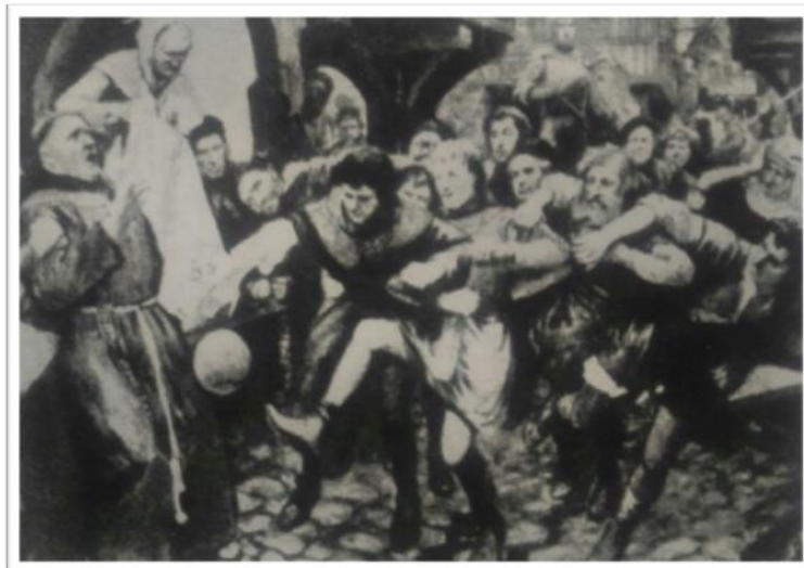
Obrázek 2. Dobová kresba anglického venkova za vlády Edwarda II.

starosty Farndona se v roce 1314 objevuje poprvé slovo „football“. 15 K tomuto zákazu se, kvůli hluku způsobenému velikými shluky lidí, v roce 1349 připojuje král Edward II. a král Edward III. v roce 1365 zakazuje provozování her s pálkami a míči, protože hráči křičí, hulákají, strkají do sebe a uráží i samotného krále. Zákazy přicházely i s následujícími králi. 16