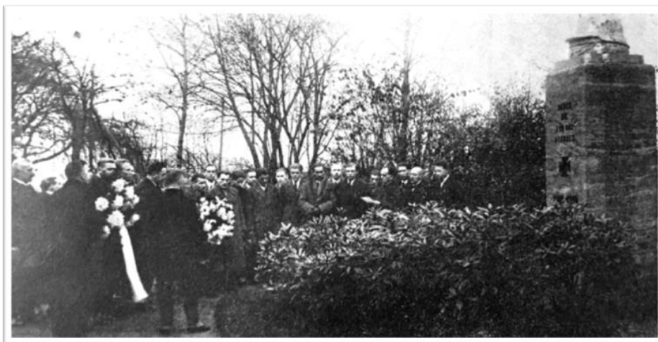
Obrázek 26. Mužstvo Viktorie před pomníkem padlých vojnů v Hamburku. Fotografie převzata z knihy 25 let Viktorie Žižkov. (1928). Praha, s. 51.