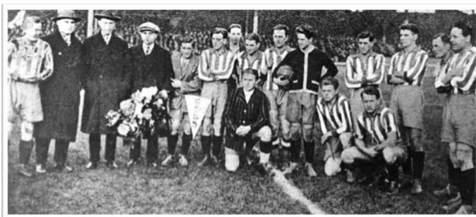
Obrázek 28. Mužstvo Viktorie před zápasem s kombinovaným týmem Paříže v roce 1925. Fotografie převzata z knihy 25 let Viktorie Žižkov . (1928). Praha, s. 57.