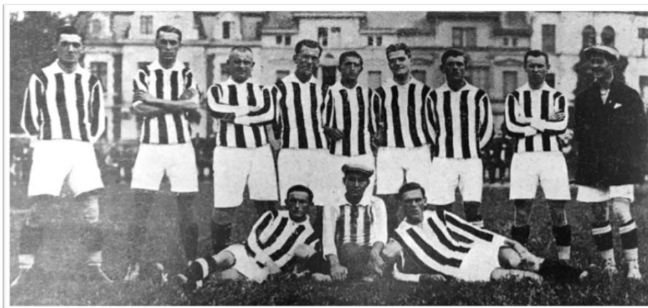
Obrázek 21. Mužstvo Viktorie na zájezdu do Švýcarska a Francie v roce 1921, před zápasem s Old Boys Basilej 1:0. Fotografie převzata z knihy 25 let Viktorie Žižkov . (1928). Praha, s. 44.

Viktoria na svém hřišti hostila Němce, Holanďany, Švýcary, Belgičany a Dány. V těchto zápasech porazila Viktoria DFC 3:2, holandský klub Maastrichsche V. V. 5:0, Old Boys Basilej ze Švýcarska 3:2, s Dány hrála 2:4, porazila německé týmy Dresdner SV 3:1, Karlsbader FC 3:0 a s Rudolfshügelem remízovala 0:0. Na konci jarní sezony odjela Viktoria na zájezd do Švýcarska a Francie, kde porazila Old Boys Basilej 1:0 a Association Sportive Štrassburk 4:2. 126