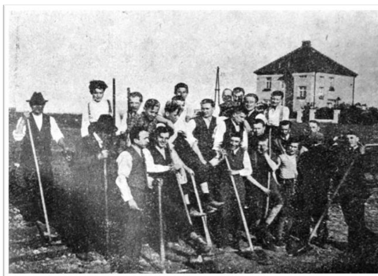
Obrázek 33. Členové Viktorie při pracích na novém hřišti ve Strašnicích. Fotografie převzata z knihy 25 let Viktorie Žižkov . (1928). Praha, s. 81.

Po všech velkých jednáních přišel v potaz obecní pozemek, který se nacházel za rádiovou stanicí ve Starých Strašnicích. Na tento pozemek by se vešlo nejen hřiště s atletickým oválem, tribuna, nezbytné kabiny, ale i několik tenisových kurtů. Po dlouhých jednáních bylo Viktorii přislíbeno i komunikační spojení, proto se klub rozhodl uzavřít s městem nájemní smlouvu. Ta byla podepsána na 10 let s tím, že pokud město nebude potřebovat pozemek ke svým účelům, bude smlouva automaticky prodloužena na dalších 10 let. Hřiště se nacházelo také v kopcovitém terénu, ale tentokrát bylo za finanční pomoci města srovnáno. Výbor klubu rozhodl, že i každý z členů musí odpracovat 50 hodin do konce roku 1928, nebo že musí složit 5 Kč za každou neodpracovanou hodinu. 160 Budování hřiště pro 35 000 diváků postupovalo velmi rychle. Stadión byl slavnostně otevřen v červenci roku 1929. 161