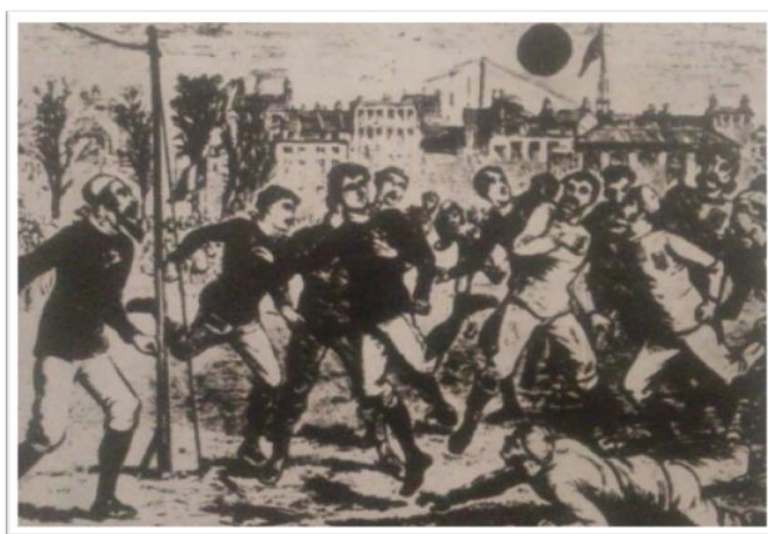
Obrázek 3. Fotbalové utkání studentů v hrabství Lancashire v roce 1863. Fotografie převzata z knihy Procházka, K. (1984). Fotbal to je hra . Praha: Olympia, s. 54.

Za velký přelom ve fotbale lze považovat vývoj v 19. století v Anglii. To už byl fotbal součástí výchovy a studia na anglických školách. Právě mladí studenti se zasloužili o rozvoj fotbalu, avšak hra stále připomínala jakousi směsici kopané a rugby. Do míče se kopalo, ale stále bylo povoleno hrát i rukama. Pravidla se vyvíjela podle místních podmínek, takže si každá škola určovala svá. Počet hráčů se řídil velikostí prostranství, na kterém se hrálo, a ani velikosti branek nebyly stanoveny. 21 Ve školách s travnatými povrchy hřišť jako např. v Rugby byla povolena tvrdší hra, na školních dlážděných dvorech byla pravidla přísnější.