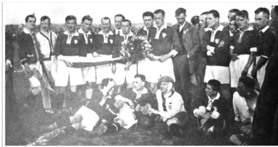
Obrázek 24. Uvítání Viktorie před zápasem s Wartou v Poznani 4:0.