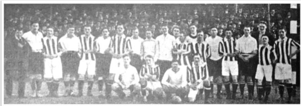
Obrázek 15. Viktoria (pruhovaní) – Civil Service (bílí) 4:1.