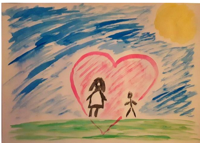
obr. č. 9

Filip, muž, 29 let, nestudoval v AA, vyučen