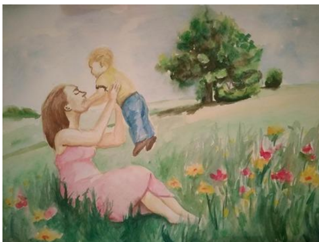
obr. č. 6