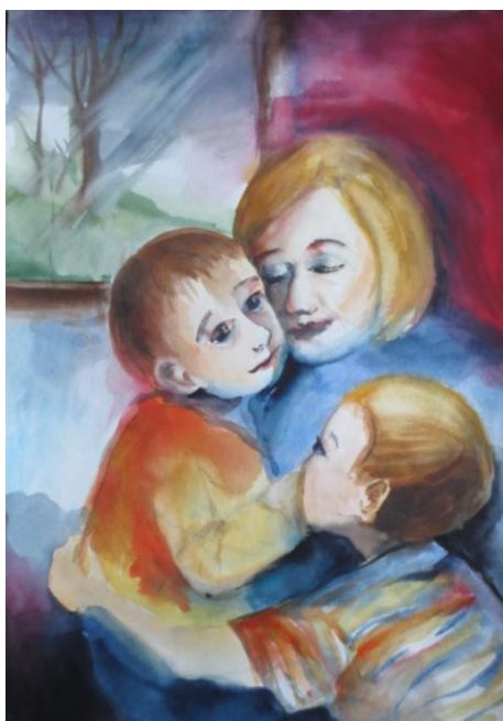
obr. č. 2