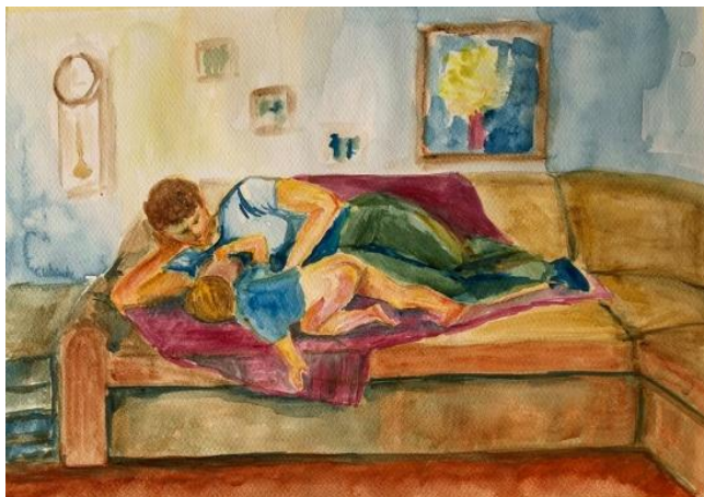
obr. č. 7

Lucie, 25 let, nestudovala v AA, VŠ vzdělání