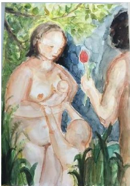
obr. č. 1

Lenka, 27 let ( malovala v 25 letech), studentka 3. ročníku AA