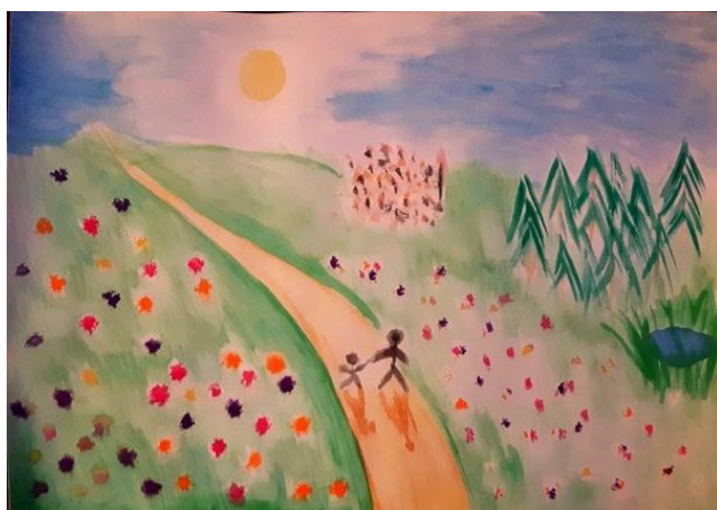
obr. č.. 8

Iveta, 28 let, nestudovala v AA, VŠ vzdělání