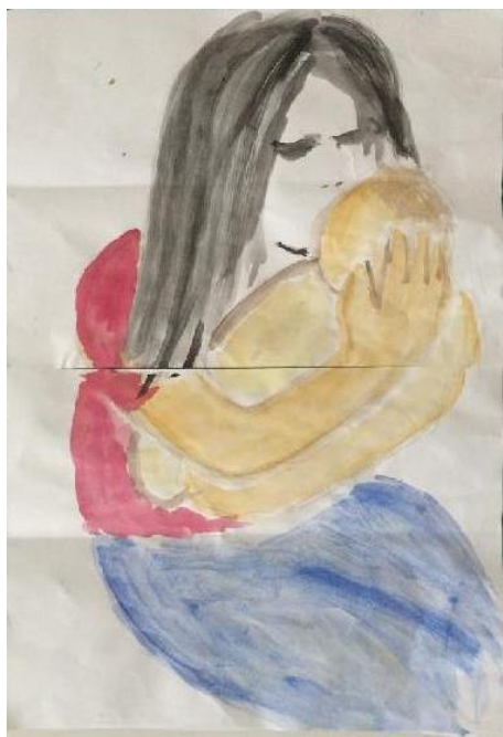
obr. č. 10

Adam, 40 let, nestudoval v AA, SŠ vzdělání