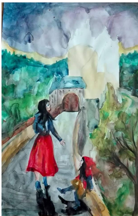
obr. č. 5