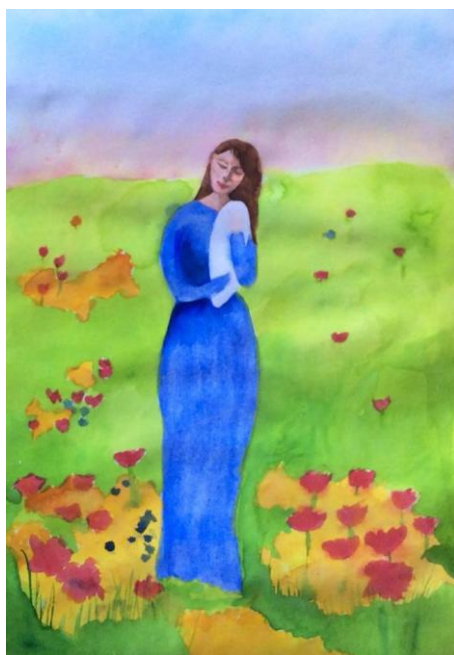
obr. č. 12

Katka, 35 let, nestudovala v AA, VŠ vzdělání