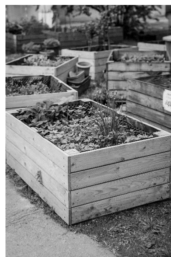
Obr 1 V komunitní zahradě Vidimova se pěstují plodiny v pojízdných truhlících.

Na stránkách sdružení se píše o současném způsobu fungování zahrady: