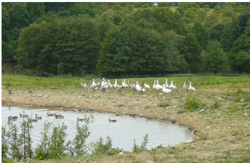
Drůbež na velkostatku Polánka