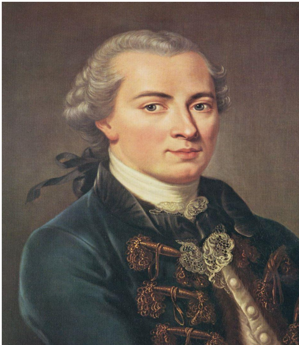
Obrázek 1 Immanuel Kant

šťastným a spokojeným může být pouze člověk žijící mravně. Zřejmě by se našel člověk, který by tento závěr označil za přinejmenším bláhový. Někdo, kdo by řekl, že lidé žijící nemravně mohou být, a dokonce jsou šťastní. Takového skeptika musím zvláště naléhavě poprosit, aby vytrval v četbě této práce a dal mi šanci jej přesvědčit. ( Aleš Havíř, Život podle Kategorického imperativu)