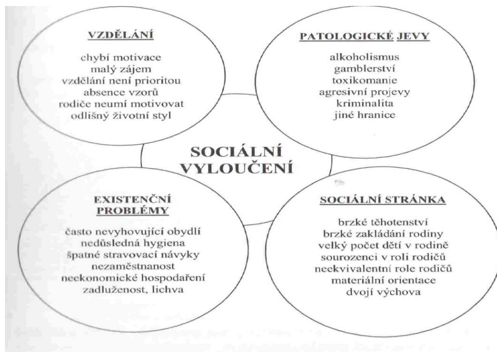
Obr. 1. Grafické znázornění důvodů a následků sociálního vyloučení

Kaleja (2014) graficky znázornil důvody a následky sociálního vyloučení (obr. 1).