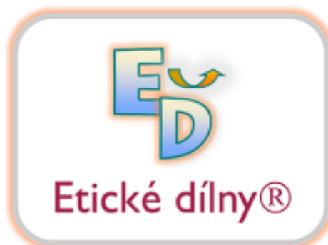
Obrázek 3 - Logo Etické dílny®

Etické dílny® jsou divizí v organizaci Hope4kids, z. s. Etické dílny® zajišťující preventivní programy na školách (v rámci regionů po celé České republice), vzdělávání lektorů a webové poradny. Mají certifikát MŠMT o odbornou způsobilost pro poskytování programů všeobecné primární prevence. Nabízí pro-