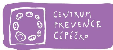
Obrázek 7 - Logo Centra prevence CéPěčko

Centrum prevence CéPěčko je zaštiťováno neziskovou organizací Portimo o. p. s. působící v okrese Žďár nad Sázavou a v okolí Nového Města na Moravě. Nabízí certifikované programy všeobecné primární prevence a programy selektivní prevence pro