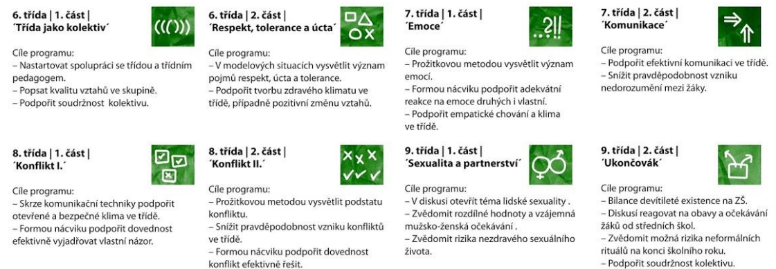
Obrázek 6 – Komponovaný blok primární prevence

Držte v ruce nabídku dlouhodobého, komponovaného programu, který cíleně směřuje k osobnostnímu rozvoji žáků a zároveň pracuje s vývojem třídního kolektivu na druhém stupni základní školy. Tento program je nastaven tak, aby reagoval na specifické situace ve skupině a v aktivní spolupráci s třídním učitelem pomáhal pozitivně podpořit klima ve třídě. Každá třída žije vlastním životem a touto cestou můžeme ovlivnit, jak (ne)náročný život to bude.