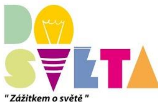
Obrázek 4 - Logo DO SVĚTA z. s.

DO SVĚTA je profesionální organizace, která nabízí vzdělávání pedagogů v oblasti prevence, specializační studium pro školní metodiky prevence, vzdělávací kurzy zážitkové pedagogiky, individuální poradenství a terapii, adaptační kurzy a programy primární prevence. DO SVĚTA působí převážně v Jihočeském kraji, ale příležitostně dojíždí i do jiných částí České republiky. Provádí programy na základních a středních školách, pro 2. stupeň ZŠ mají programy certifikaci MŠMT.