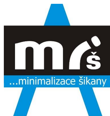
Obrázek 2 - Logo Minimalizace šikany