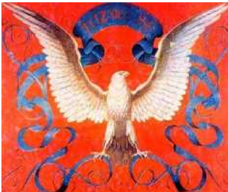
Obr. 2 Sokolský prapor