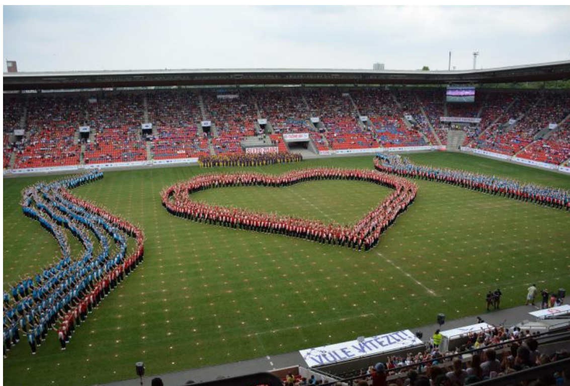
Obr. 10 Vsesokolský slet ke stému výročí republiky v roce 2018

Zdroj: https://www.i60.cz/clanek/detail/19745/bili-je-a-zatykali-tak-skoncil-sokolsky-slet , vyhledáno 9. 7. 2019