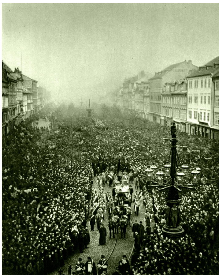
Obr. 14 Pohřeb Miroslava Tyrše, Václavské náměstí