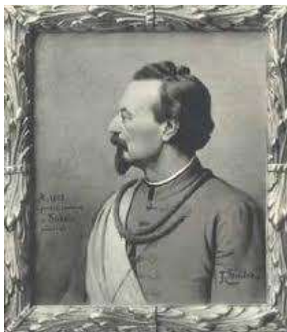
Obr. 1 Miroslav Tyrš – portrét