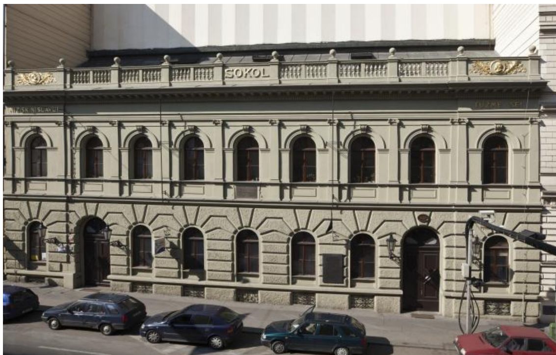
Obr. 7 Budova pražské Sokolovny