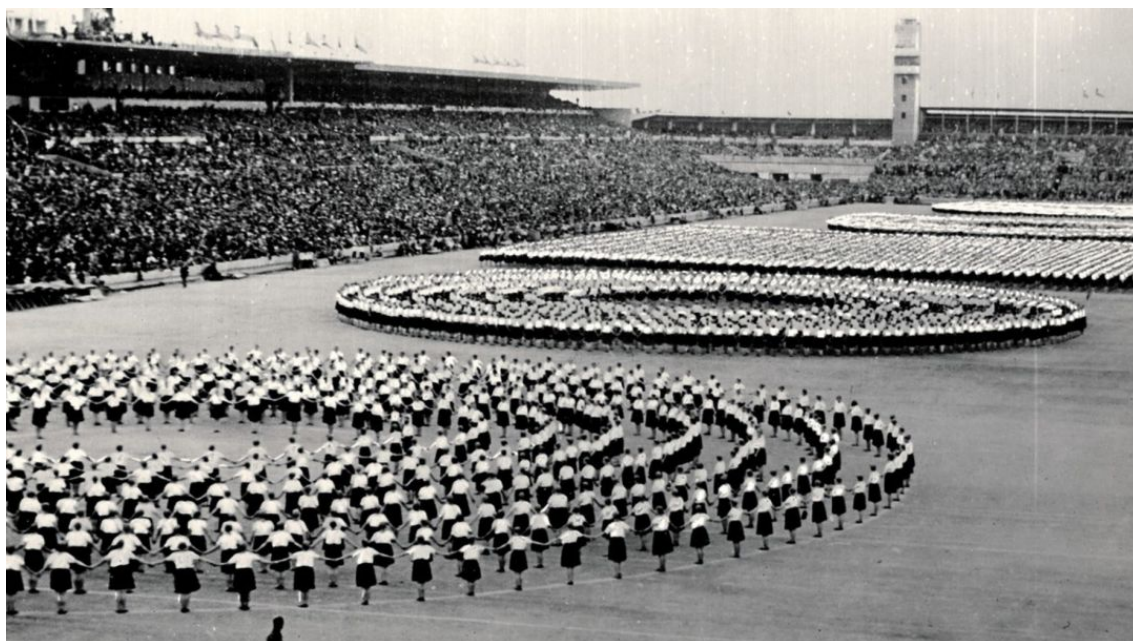
Obr. 9 Vsesokolský slet