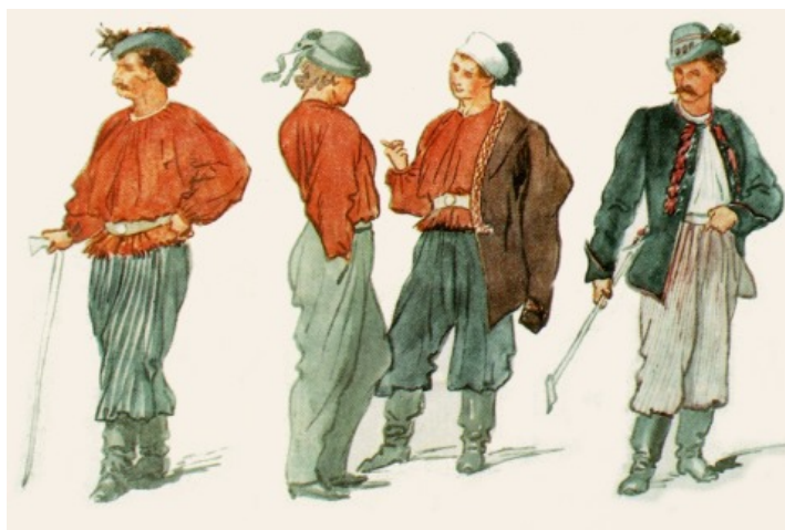
Obr. 5 Josef Mánes, návrhy sokolského kroje 1862