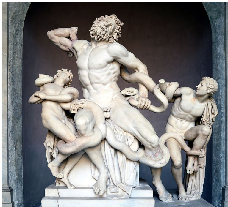
Obr. 13 Sousoší Láokoóna a jeho synů