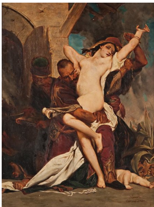
Obr. 12 Únos Černohorky od J. Čermáka