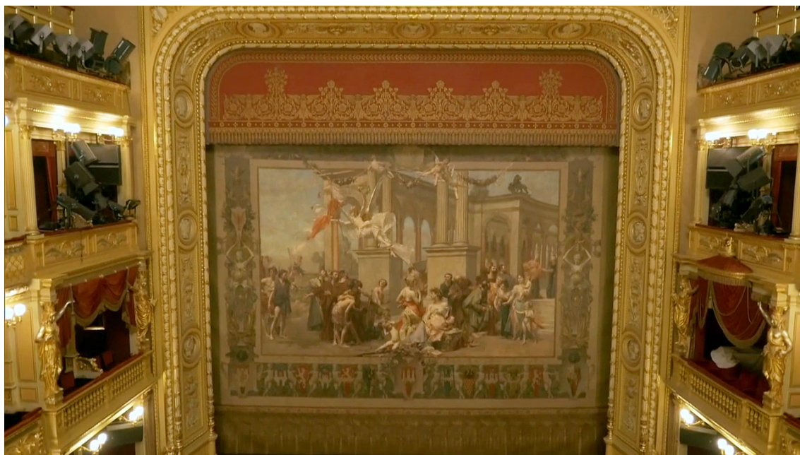
Obr. 11 Opona Národního divadla od Vojtěcha Hynaise