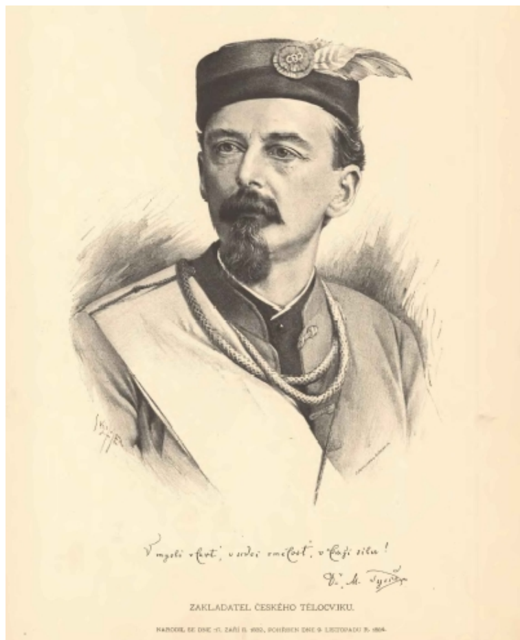
Obr. 6 Portrét Miroslava Tyrše od Jana Vilímka