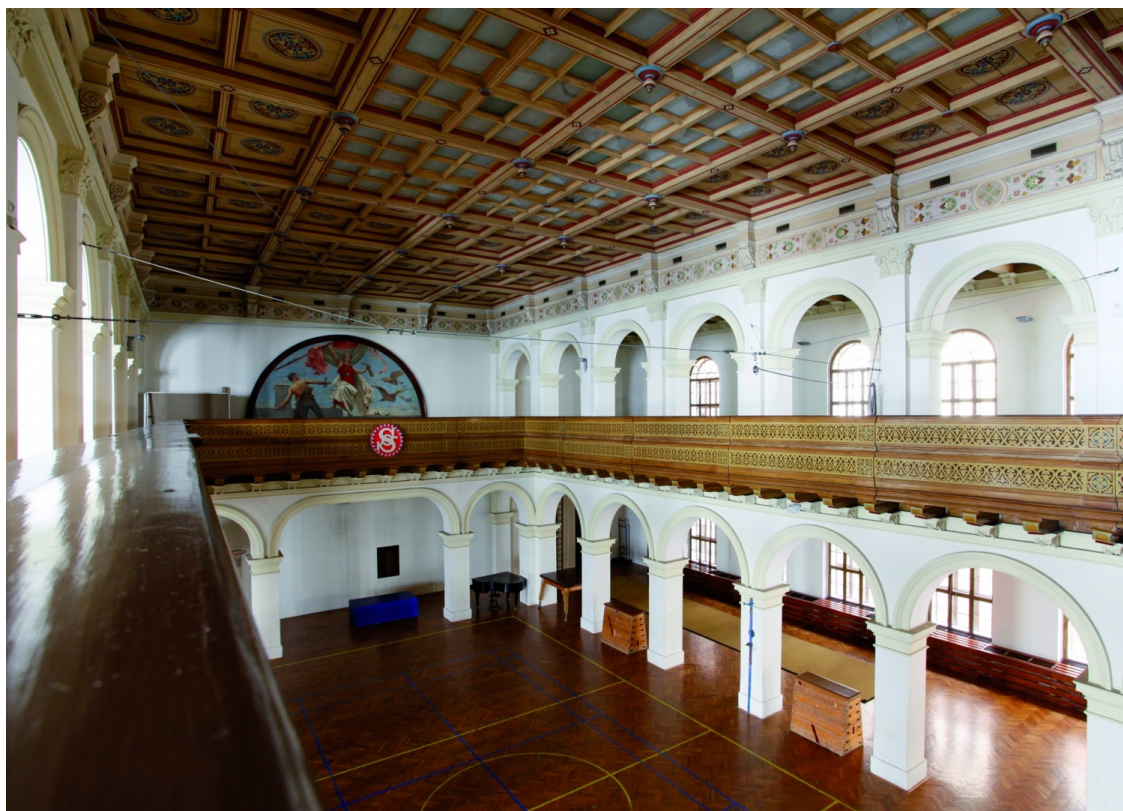
Obr. 8 Sál pražské Sokolovny