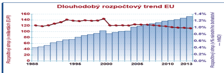
Obrázek 1: Dlouhodobý rozpočtový trend EU