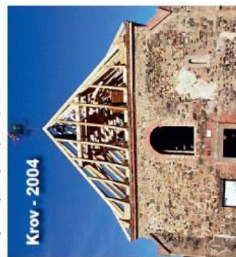
Krov - 2004

V letech 1960 – 70 se zboril krov a střecha s věžičkou. Dochází k destrukci obvodového zdiva, kostel je zavážen a obypávan kamením a odpadní zeminou z okolních polí. Z omeitek zbyly jen fragmenty, došlo k rozpadu téměř celé korunní římsy a rozpadaly se opěrné pilíře.