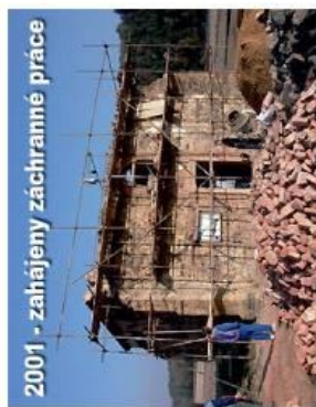
2001 - zahájeny záchranné práce

V roce 2001 byly započaty z iniciativy obce Hlince a s pomocí grantu Nadace Open Society Fund Praha na objektu kostela záchranné práce s cílem zachovat toto kulturní dědictví našeho národa pro příští generace. V roce 2002 byl uskutečněn převod zříceniny kostela včetně přílehlého pozemku do vlastnictví obce Hlince.