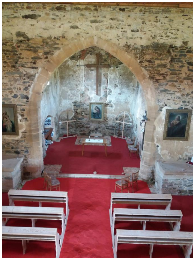
Příloha č. 6 – Medializace přispěla k záchraně kostela.