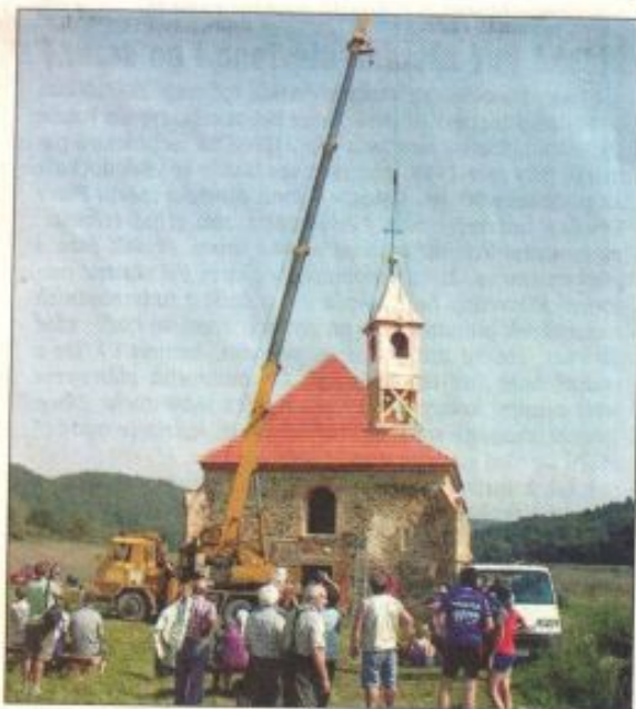
Věž byla na kostel sv. Petra a Pavla slavnostně osazena. Akce se zúčastnily desítky obyvatel Hlinců i okolních obcí.