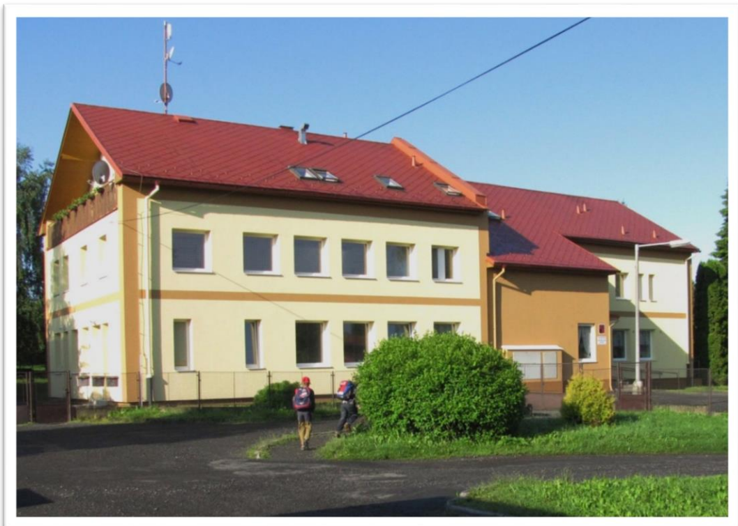
Obr. 4 Nová školní budova rok 2001 144