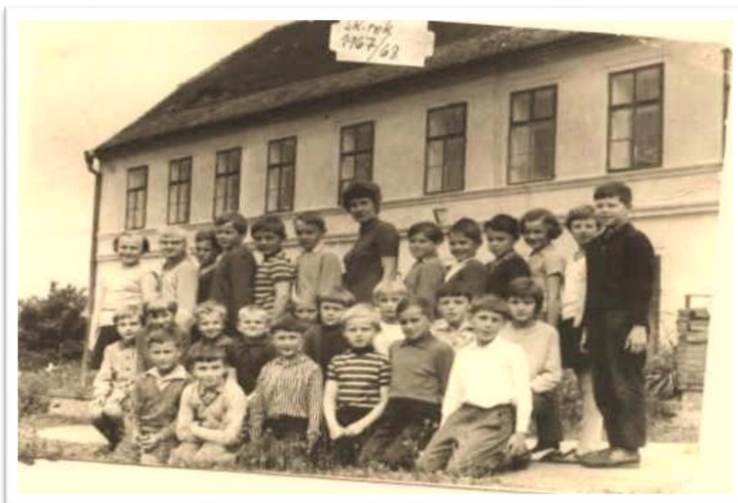
Obr. 2 Školní rok 1967/68 142