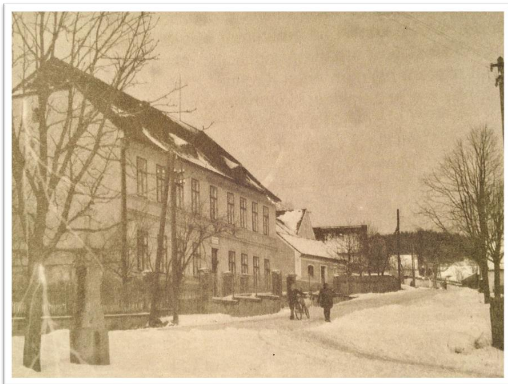
Obr. 1 Původní školní budova 141