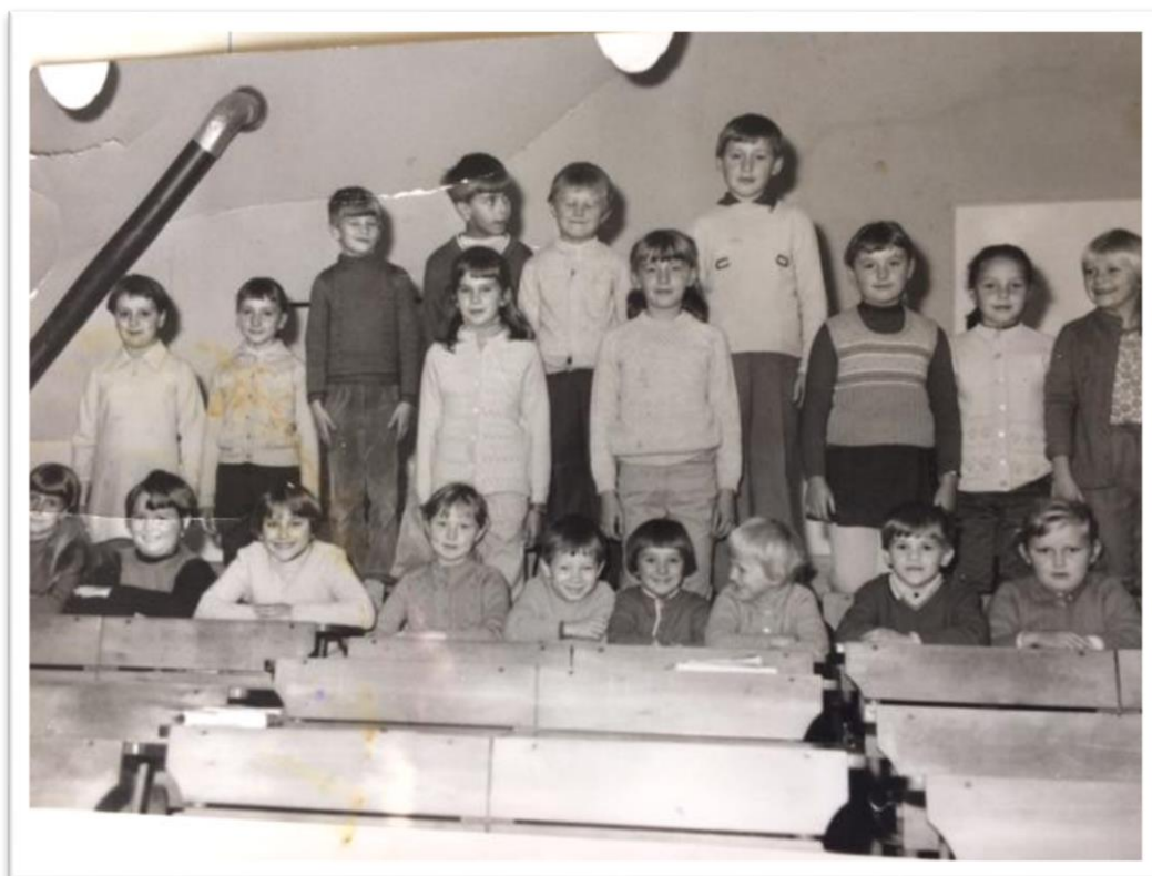
Obr. 5 Školní třída rok 1972/73 145