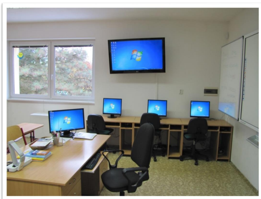
Obr. 6 Učebna po realizaci projektů rok 2016 146