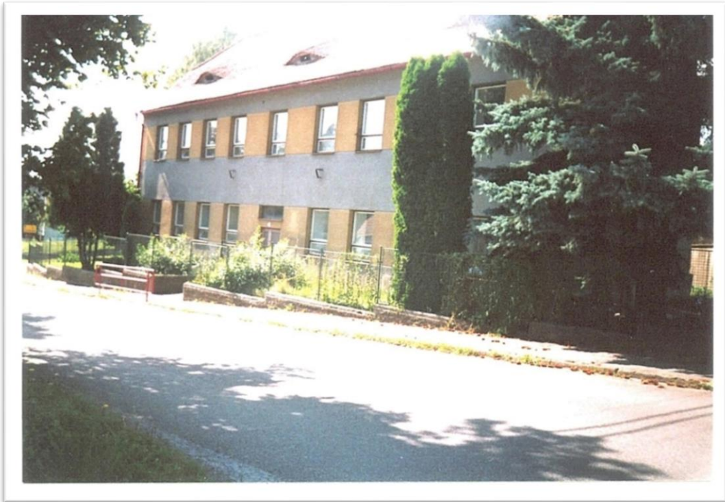
Obr. 3 Školní budova po rekonstrukci, rok 1974 143