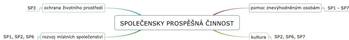
Schéma 6: Společensky prospěšná činnost

Předpokladem pro splnění této podmínky je stanovení způsobu vykonávání společensky prospěšné činnosti a stanovení podmínek nakládání se ziskem, a to v zakladatelském právním jednání. Přehled vykonávaných společensky prospěšných činností zobrazuje schéma č. 6.