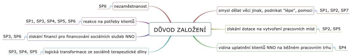
Schéma 1: Důvod založení

V první otázce rozhovoru jsem se zaměřila na důvody, které informanty vedly k založení sociálního podniku, jaké byly pohnutky k tomu začít sociálně podnikat. Přehledně tyto důvody zobrazuje schéma č. 1 níže.