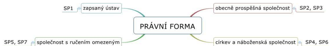
Schéma 2: Právní forma podnikání