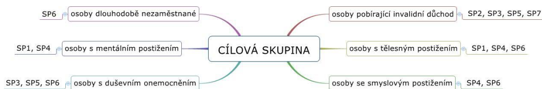
Schéma 3: Cílová skupina

V dalších otázkách rozhovoru jsem se zaměřila na zaměstnance sociálních podniků. Jelikož všechny zkoumané podniky jsou zároveň podniky integračními, zajímalo mne, na jakou cílovou skupinu osob se znevýhodněním se zaměřují, respektive které osoby zaměstnávají. Přehled je uveden ve schématu č. 3.